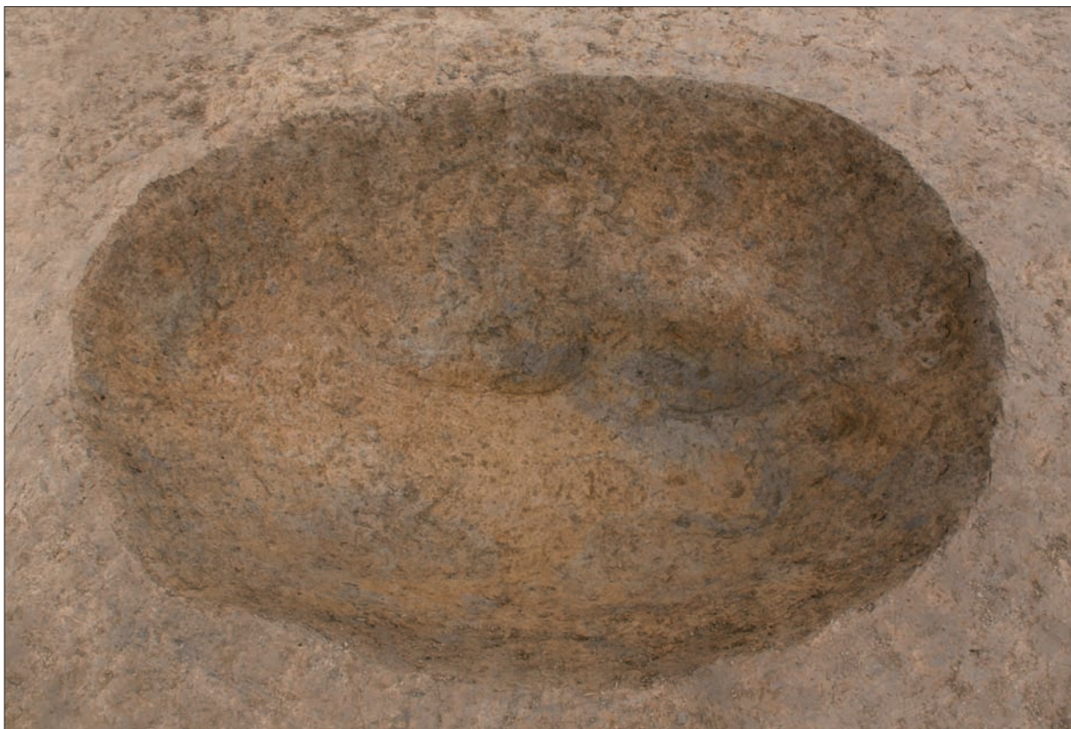
Sl. 8 Jama SJ 1171 iz kasnoga srednjeg vijeka.