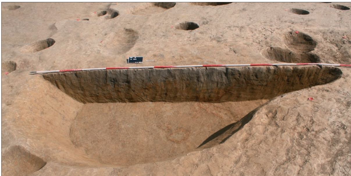
Sl. 2 Presjek zapuna jame SJ 1357 lasinjske kulture (snimio: M. Vojtek).

Fig. 2 Section of the fills of pit SU 1357 of the Lasinja culture (photo: M. Vojtek).