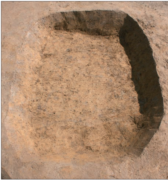
Sl. 6 Jama SJ 1353 iz mlađega željeznog doba.

Fig. 6 Late Iron Age pit SU 1353.