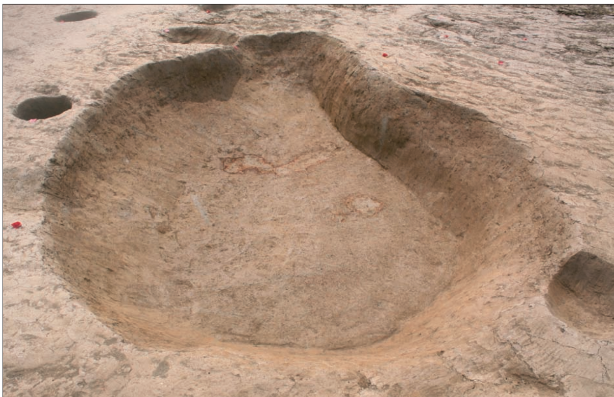
Sl. 3 Jama SJ 1357 lasinjske kulture.

Otkriće dijela naselja ranobrončanodobne vinkovačke kulture na nalazištu AN 4 Poljana Križevačka 1 od posebne je važnosti zato što su istodobna nalazišta iznimno slabo poznata na prostoru sjeverozapadne Hrvatske (Durman 1982; Jakovljević 2005; 2008; 2009). Tipološka analiza keramičkih nalaza omogućit će poznavanje keramografije vinkovačke kulture na zapadnom prostoru njezina rasprostiranja, što odgovara i posljednjim rezultatima istraživanja u slovenskom Prekomurju koja svjedoče o snažnoj prisutnosti vinkovačke kulture na prostoru jugozapadne Panonije tijekom početka brončanog doba (Velušek, Čufar 2003; Šavel 2005; Guštin, Zorko 2010).