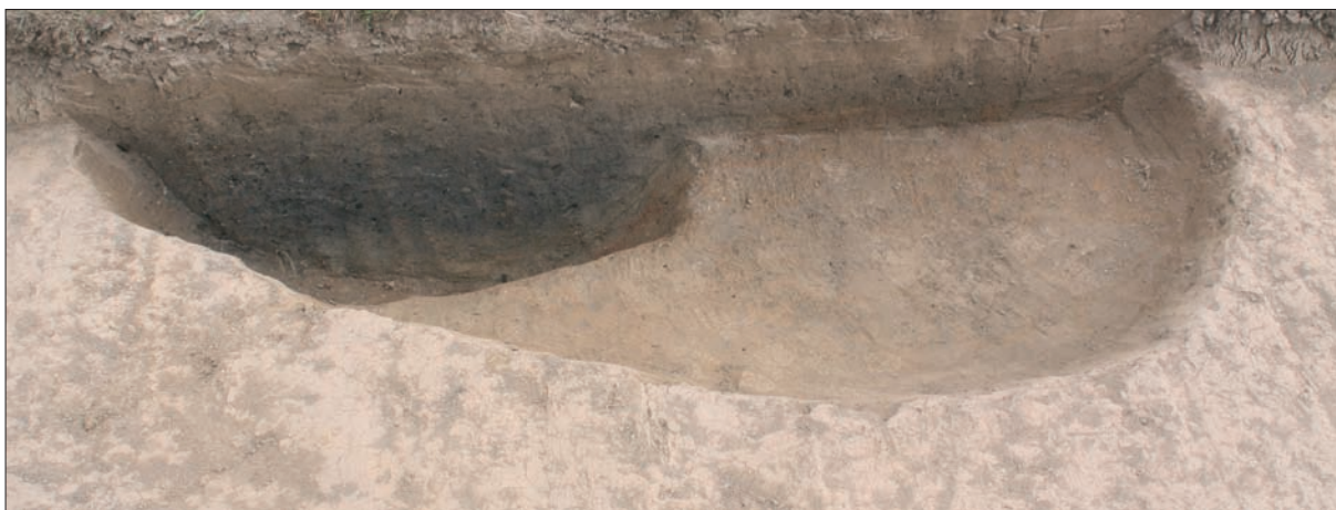
Sl. 4 Presjek zapuna jame SJ 1223 vinkovačke kulture.

Fig. 4 Section of the fills of pit SU 1223 of the Vinkovci culture.