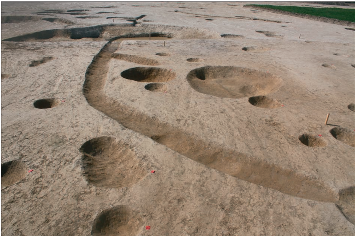
Sl. 7 Dio infrastrukture naselja iz mlađega željeznog doba s kanalom SJ 585.

Naselje se vjerojatno kontinuirano nastavlja i u ranorimsko vrijeme, jer su se sačuvali jednaki tipovi objekata i dio keramičke ostavštine. Na središnjem dijelu uzvišenja izdvojeno je nekoliko jama ovalnog oblika, no brojni su i ukopi rupa za stupove koji ukazuju na postojanje kuće na jugoistočnom dijelu istražene površine oko koje je raspoređen veći broj jama te ostaci manjih okruglih i plitko ukopanih peći od kojih se sačuvalo samo dno sa zapečenom zemljom. U zapunama su pronađeni karakteristični ulomci rimske provincijalne keramografije – lonci, zdjele, vrčevi izrađeni na lončarskom kolu, no zabilježeni su i oblici koji su modelirani rukom u autohtonim tradicijama. Rijetki su nalazi željeznih i staklenih predmeta. Nalazi iz rimskog razdoblja otkriveni su na Velikom Kalniku (Karavanić et al. 2011), dok je veći broj nalaza, posebno novca, zabilježen na širem području Križevaca s okolicom (Tomičić 1999: 126–127).