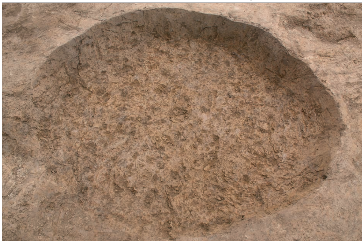
Sl. 5 Jama SJ 1473 iz kasnoga brončanog doba (snimio: M. Vojtek).

doba pripada slabo poznatim nalazištima toga vremena na križevačkom prostoru, od kojih je jedno otkriveno na položaju Ciglana u samim Križevcima (Homen 1982). Još se jedno naselje spominje u Martincu jugozapadno od Križevaca (Tomičić 1999), dok su na Kalniku na položaju Igrišće u posljednjim istraživanjima pronađeni i nalazi iz mlađe faze kulture polja sa žarama (Karavanić et al. 2011). Blisku usporedbu predstavlja istraživana gradina u Donjem Orešju kod Svetog Ivana Zeline (Balen-Letunić, Bakarić 1984; Balen-Letunić 1996: 15, Sl. 5). Naselje iz mlađe faze kasnoga brončanog doba pronađeno je u istraživanjima visinskog naselja Kuzelin nedaleko od Sesveta (Sokol 1986). Spomenuta nalazišta otvaraju zanimljiva mikrotopografska pitanja u proučavanju mlađe faze kasnoga brončanog doba u križevačkom kraju. Još su neka kasnobrončanodobna naselja poznata na križevačkom području iz terenskih pregleda (Tkalčec et al. 2007: 7, 12) i slučajnih nalaza (Tomičić 1999: 121–123), što svjedoči o gustoći naseljenosti ovoga kraja u vrijeme kulture polja sa žarama (Vinski-Gasparini 1973; 1983).