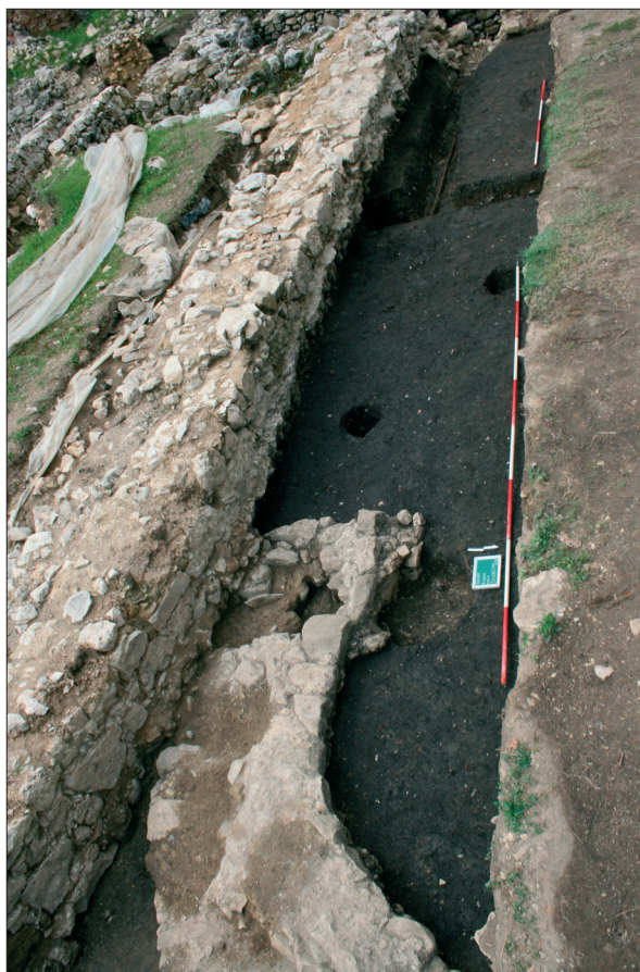
Sl. 3 Ranosrednjovjekovni kulturni sloj ustanovljen sjeverno od obrambenog zida Staroga grada, a unutar romaničke crkve (snimila: F. Sirovica).