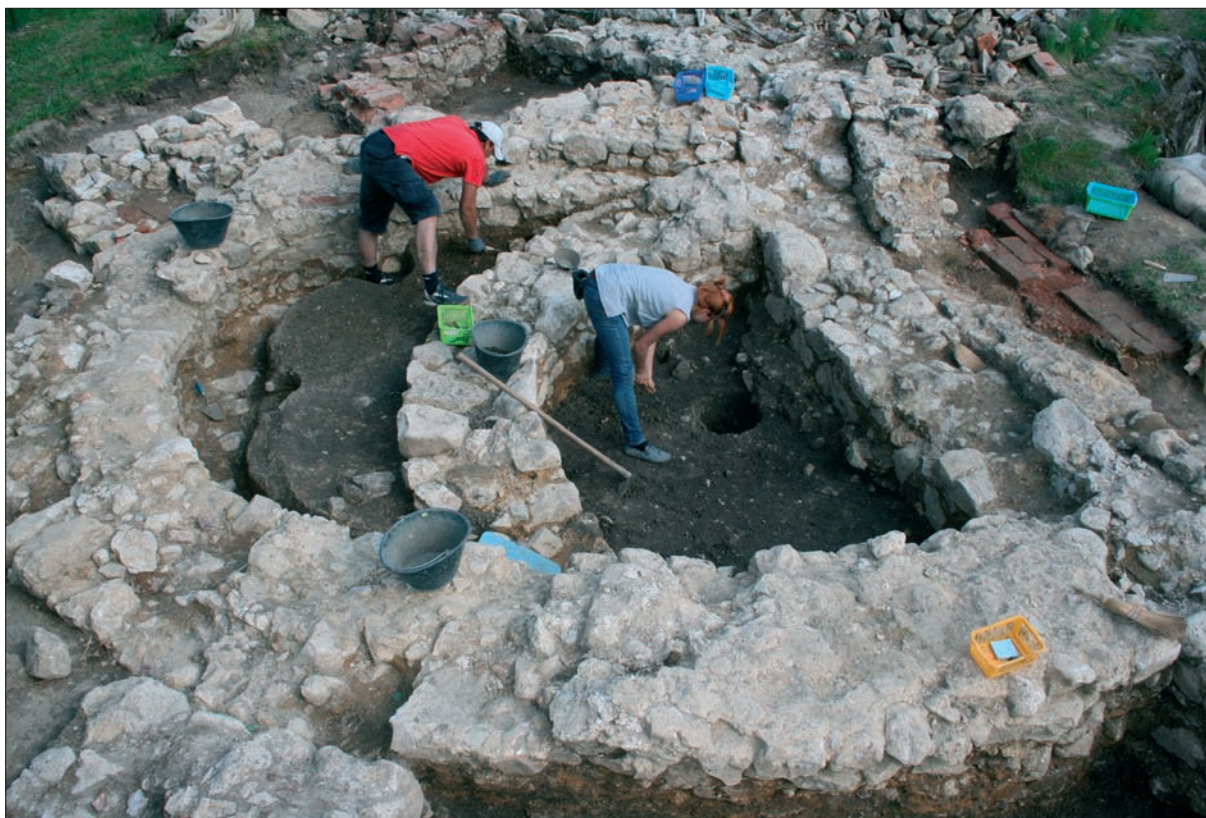
Sl. 5 Sjeveroistočna kula tijekom istraživanja.