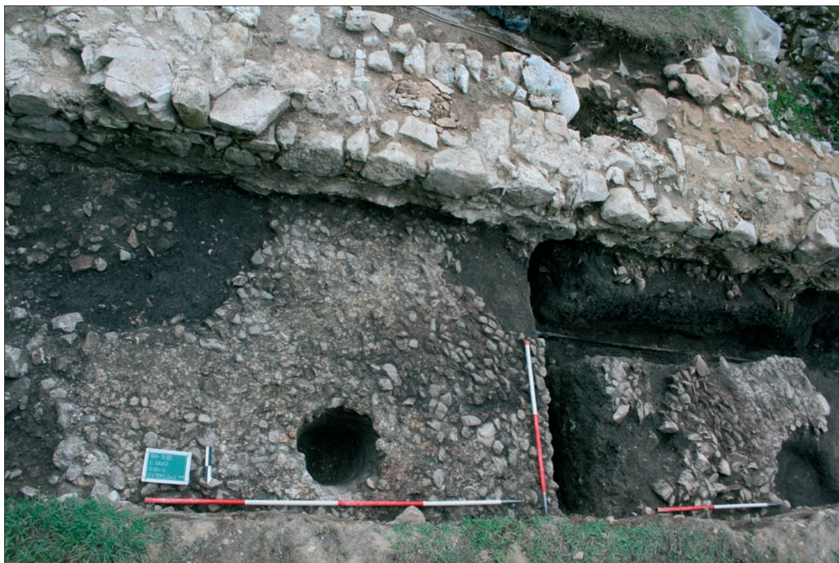
Sl. 2 Ostaci popločenja od oblutaka u brodu romaničke crkve.