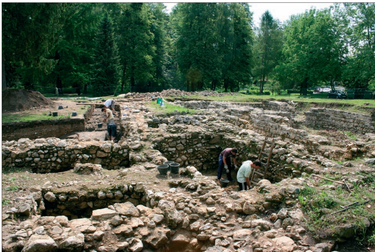
Sl. 1 Nalazište Ivanec–Stari grad tijekom istraživanja.