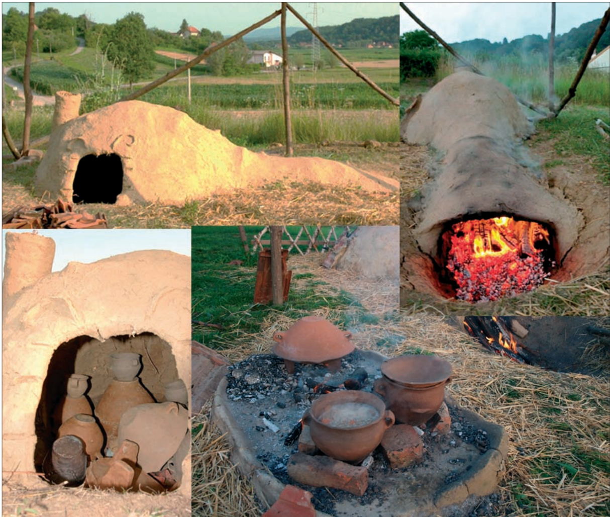
Sl. 3 Prvo paljenje peći i kuhanje na ognjištu.