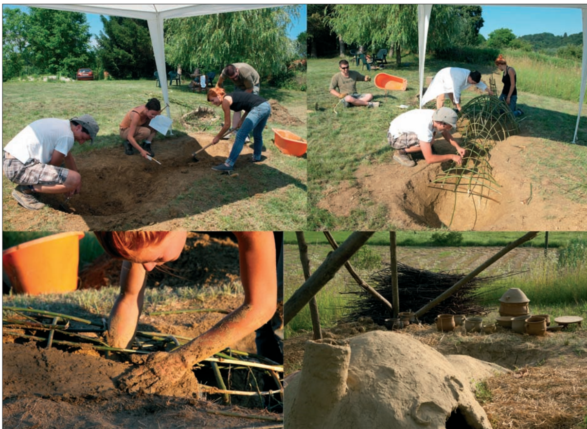
Sl. 2 Postupak gradnje peći.