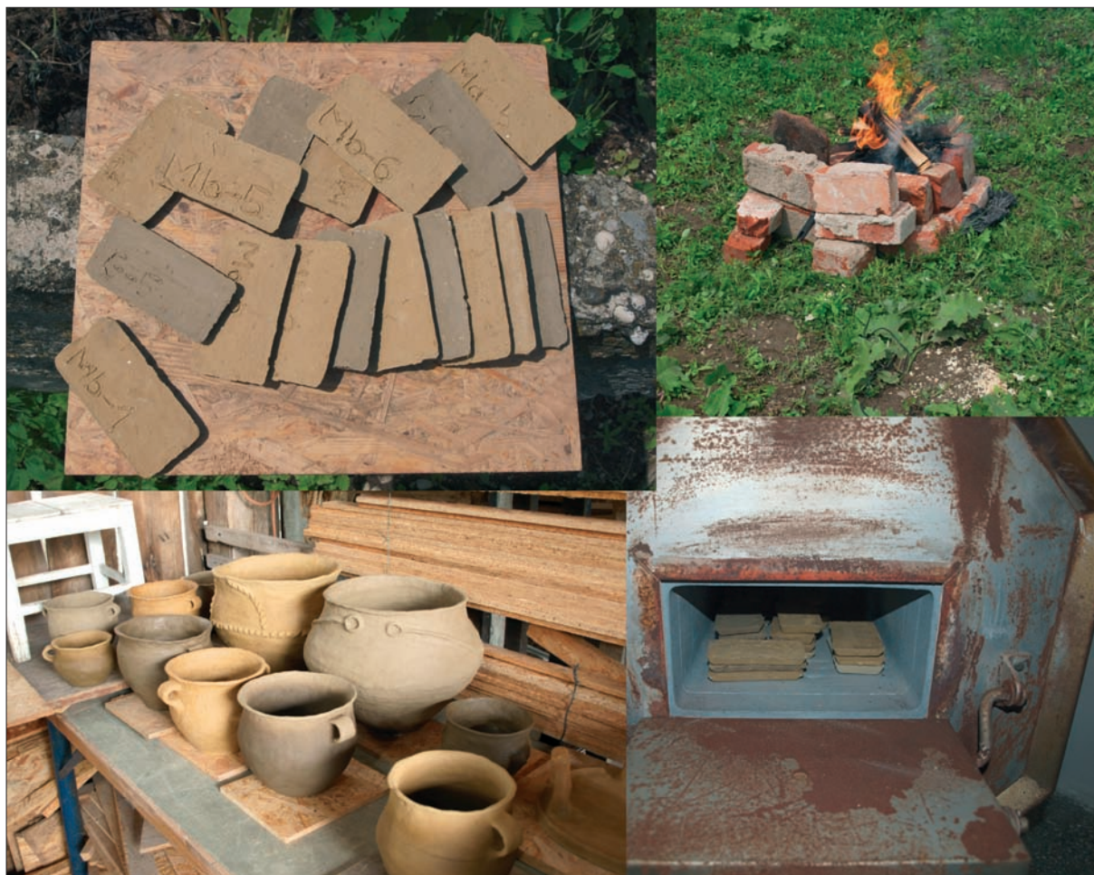
Sl. 1 Testiranje smjese i izrada posuda.