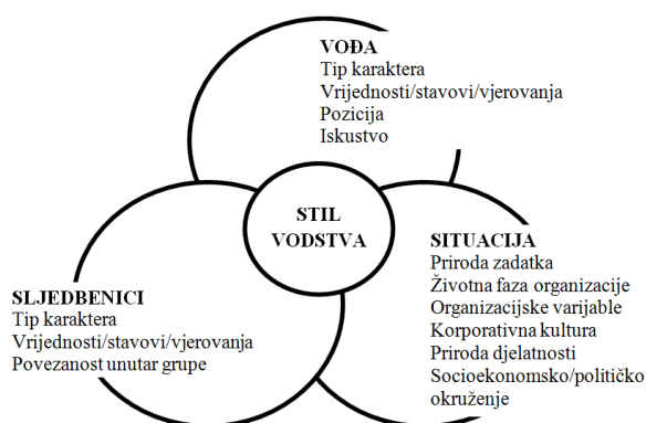
Slika 1. Domena vodstva (prema [3])

djelatnosti i socioekonomska/politička situacija). U literaturi se za spomenuto može pronaći i naziv „jednadžba vodstva“ [3].