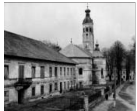
SL. 3. DVOR I CRKVA U PLAŠKOME 60-IH GODINA 20. STOLJEĆA FIG. 3 PALACE AND CHURCH IN PLAŠKI IN 1960'S