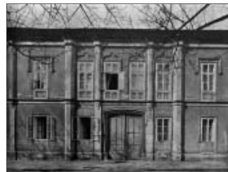
SL. 6. JANKO GRAHOR: KANONIČKA KURIJA, KAPTOL 12, ZAGREB, 1860.

FIG. 6 JANKO GRAHOR: PRELATES' RESIDENCE, KAPTOL 12, ZAGREB, 1860