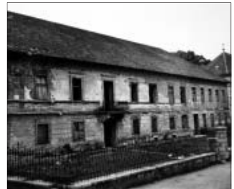
SL. 2. DVOR U PLAŠKOME 60-IH GODINA 20. STOLJEĆA FIG. 2 PALACE IN PLAŠKI IN 1960'S