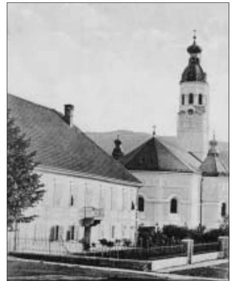
SL. 1. DVOR I CRKVA U PLAŠKOM OKO 1915. FIG. 1 PALACE AND CHURCH IN PLAŠKI AROUND 1915