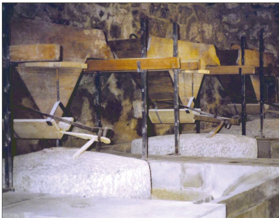
Slika 1. Tri mlina u Fratarskoj mlinici na Roškom slapu