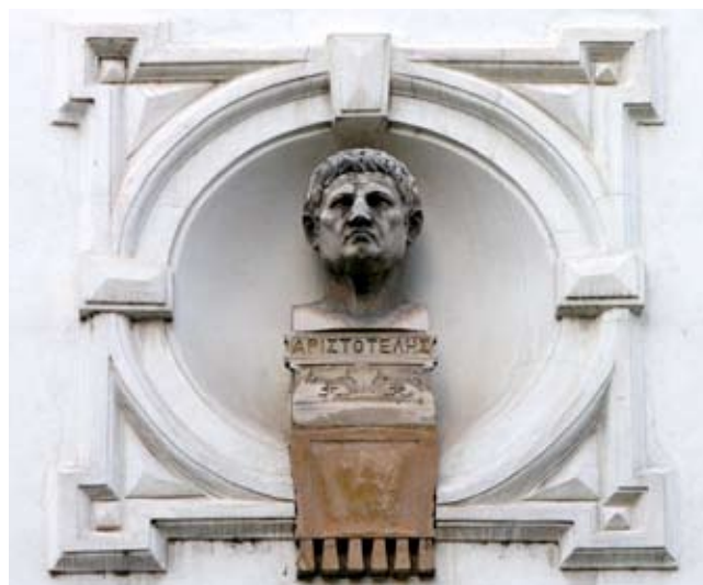
11. Aristotel , 1898., kamen, potpis, Opatička 10, Zagreb Aristotle , 1898, stone, signed, 10 Opatička Street, Zagreb

Aristotle , 1898, gypsum, unsigned, Collection of Plaster Casts of the Croatian Academy of Arts and Sciences, Zagreb