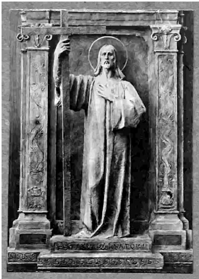
4. Krist Salvator, 1898., sadra, bez potpisa, nepoznato