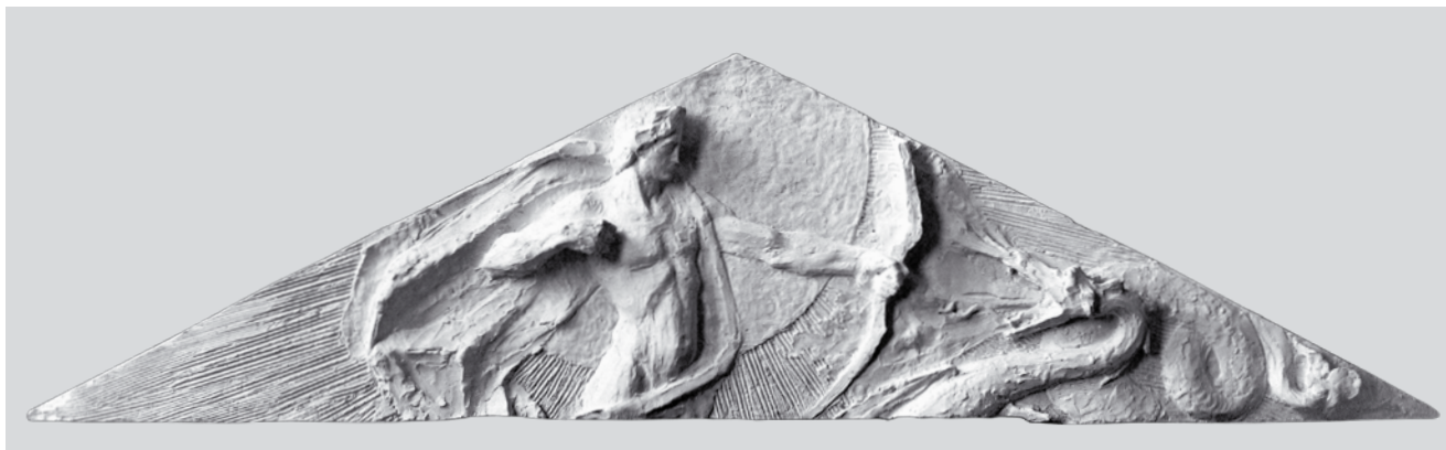
2. Apollo pythothonos , 1898., sadra, skica za timpanon Umjetničkog paviljona, bez potpisa, nepoznato Apollo Pythoconos , 1898, gypsum, study for the pediment of the Pavilion of the Arts, unsigned, unknown

Drugi reljef prikazuje mladoga Apolona odjevena u kratku haljinu bez rukava kako stoji uz mladicu lovora, držeći nježno desnom rukom grančicu s lovorovim lišćem (sl. 1, dolje). U lijevoj mu je ruci lira. U desnome donjem uglu kompozicije još je jedna lovorova grančica s trima listovima. Ti detalji odgovaraju vegetabilnu dekorativnom secesijskom stilu, a i simbolički su atributi Apolona musagetesa , Apolona na Parnasu kao vođe Muza. Lovorovo stablo i grančica simboliziraju Dafne. Otac, riječni bog, pretvorio ju je u lovorovo stablo. Ono je posvećeno Apolonu, Dafninu progonitelju. Lovorov vijenac, uz srebrni luk i zlatnu liru, treći je Apolonov atribut. Ovjenčan lovorovim vijencem Apolon se raduje na svetkovinama kod Hiperborejaca. 11 Pisanje na grčkom, kada su u pitanju likovi iz grčke mitologije ili filozofije, također je zasluga klasičnog obrazovanja ondašnjih intelektualaca i umjetnika. I Valdec je na grčkome alfabetu isklesao svoje portrete Platona i Aristotela na pročelju južnog odnosno sjevernog krila zgrade u Opatičkoj 10.