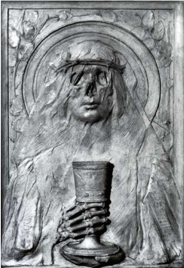
5. Ljubav, sestra smrti , 1897., reljef, bronca, sadra, bez potpisa, Gliptoteka HAZU, Zagreb

Love, the Sister of Death, 1897, relief, bronze, gypsum, unsigned, Collection of Plaster Casts of the Croatian Academy of Arts and Sciences, Zagreb