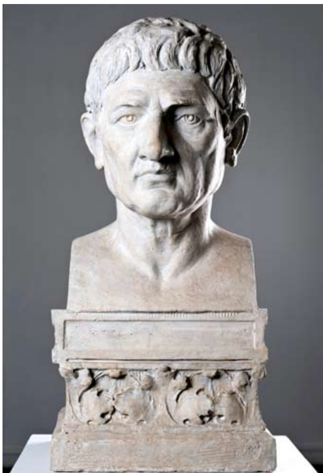
10. Aristotel , 1898., sadra, potpis, Gliptoteka HAZU, Zagreb

je Oton Iveković naslikao Orfeja i Euridiku, Hipokrita, Perikla te Sokrata, Platona i Aristotela. Sav taj klasični rimski i grčki scenarij, kao i djela u tzv. Renesansnoj sobi (Kršnjavijevu radnom kabinetu), trebao je pokazati temelje na kojima počiva europska znanost, književnost i umjetnost. 49 Sâm je Iso Kršnjavi objasnio htijenja pri uređenju palače: „Htio sam da tu slike i skulpture sjećaju na bogoštovlje, nastavu, znanost i umjetnost i na četiri fakulteta sveučilišta, a na stijene da dođu slike iz hrvatske kulturne povijesti. Htio sam nadalje da jedna soba bude u pompejanskom stilu slikana, jer je klasična prošlost jedan od glavnih temelja naše nastave, a drugu sam sobu dao urediti u stilu renesance, jer smo prožeti duhom toga duševnog pokreta. Izvana na zgradi odredio sam da budu busti Platona i Aristotela, a u uložnicama kraj ulaza htio sam da budu cijeli kipovi Tome Akvinca i Bacona Verulamskog. Usred dvorišta namjeravao sam postaviti nad česmom kip Perzeja, Atheninog junaka. U