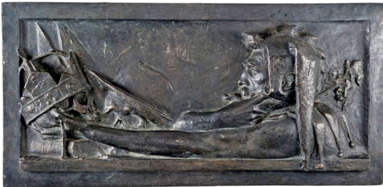
7. Memento mori , 1898., reljef, bronca, potpis dolje desno: R. Valdec, Gliptoteka HAZU, Zagreb

Memento Mori , 1898, relief, bronz, signed in the bottom right: R. Valdec, Collection of Plaster Casts of the Croatian Academy of Arts and Sciences, Zagreb