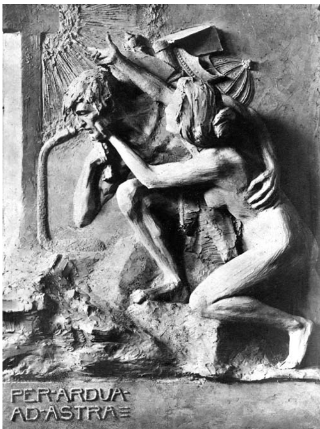
3. Per aspera ad astra (Per ardua ad astra) , 1898., sadra, bez potpisa, nepoznato

O Valdecovu Luciferu saznajemo iz novina: „Gledao sam njegova ‘Lucifera’. To je poprse: Starac s ono malo zadnjega života, što ga očituje pogled očiju, inače tek kost i koža. Na glavi mu kapa, a iz malog mozga izišle s uzdignutim glavama zmije do ispod vrata i sikuću. Obrazi su nabrani, ističu se gotovo beskrvne žile, oči su pune pritajena bijesa.” 21 I Obzor u tekstu nepotpisanoga autora opisuje slično ovo djelo: „Lucifer je muško poprse s licem izrovanim od strasti. Na glavi mu