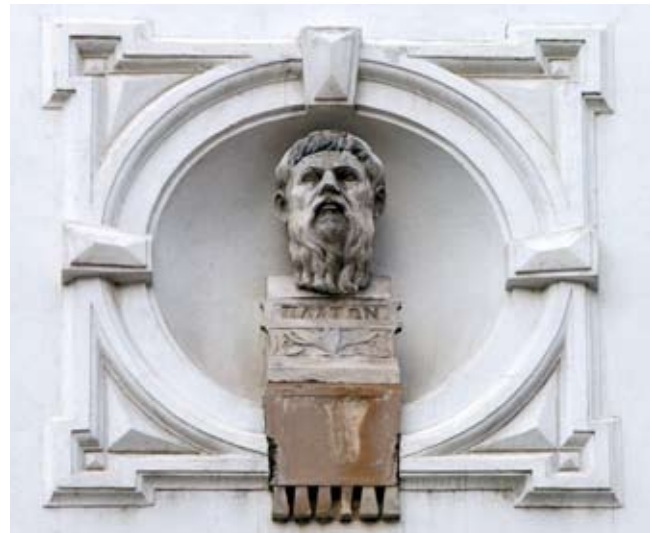
9. Platon, 1898., kamen, bez potpisa, Opatička 10, Zagreb Plato, 1898, stone, unsigned, 10 Opatička Street, Zagreb

Plato, 1898, gypsum, unsigned, Collection of Plaster Casts of the Croatian Academy of Arts and Sciences, Zagreb