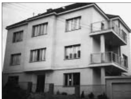
SL. 6. SLOBODNOSTOJEĆA NAJAMNA VILA BAJRAKTAREVIĆ, VOĆARSKA 56, 1937., OVL. GRADITELJ FRANJO MOKROVIĆ

FIG. 5 SEMI-BUILT-IN VILLA FOR RENT RESNIK, VOĆARSKA 48, 1937, VJEKOSLAV MURSEC, LICENSED BUILDER