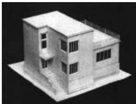
SL. 9. MODEL SLOBODNOSTOJEĆE OBITELJSKE VILE, MRKOPAJSKA 14, OKO 1933., OVL. GRADITELJ VILKO EBERT FIG. 9 DETACHED SINGLE-FAMILY VILLA (SCALE MODEL), MRKOPAJSKA 14, AROUND 1933, V. EBERT, LICENSED BUILDER