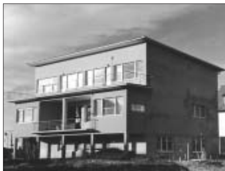
SL. 8. SLOBODNOSTOJEĆA DVOBITELJSKA VILA KRALJ, II. CVJETNO NASELJE 17, 1941., VLADO ANTOLIĆ FIG. 8 DETACHED DUPLEX VILLA KRALJ, II CVJETNO NASELJE 17, 1941, VLADO ANTOLIĆ