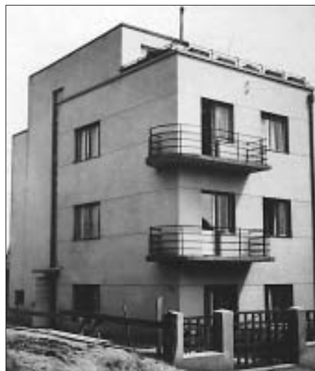
SL. 5. POLUUGRAĐENA NAJAMNA VILA RESNIK, VOĆARSKA 48, 1937., OVL. GRADITELJ VJEKOSLAV MURSEC

FIG. 4 DETACHED VILLA FOR RENT PUŠKAŠ, TORBAROVA 16, 1934, ANON.