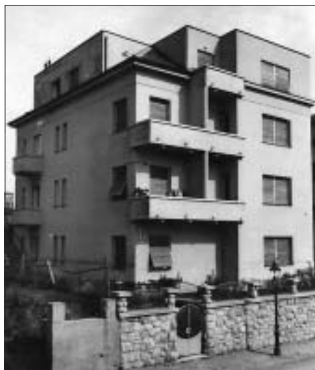
SL. 4. SLOBODNOSTOJEĆA NAJAMNA VILA PUŠKAŠ, TORBAROVA 16, 1934., ANON.

FIG. 3 BUILT-IN VILLA OREŠKI, LIVADIĆEVA 14, 1937, JOSIP BEZIC