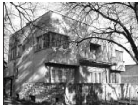
SL. 10. SLOBODNOSTOJEĆA NAJAMNA VILA, BOLNIČKA 36-38, ANON. FIG. 10 DETACHED VILLA FOR RENT; BOLNIČKA 36-38, ANON.

ba, dakle u tadašnjim predgrađima (sl. 9, 10). Stambene kuće Novoga građenja izvan sjevernih dijelova grada uvrstio sam u bazu podataka, dok sam istovrsne kuće izvan tadašnjega Zagreba uvrstio u zaseban popis. Radom u Državnom arhivu sastavio sam popis projekata stambenih kuća Novoga građenja koji su došli na upravni postupak izdavanja građevne dozvole.