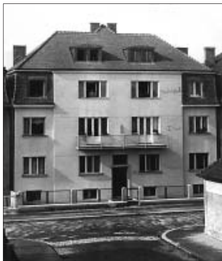
SL. 3. UGRAĐENA NAJAMNA VILA OREŠKI, LIVADIĆEVA 14, 1937., JOSIP BEZIC

FIG. 3 BUILT-IN VILLA OREŠKI, LIVADIĆEVA 14, 1937, JOSIP BEZIC