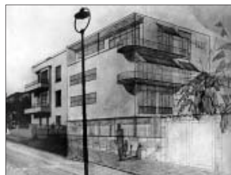
SL. 12. FOTOMONTAŽA POLUUGRAĐENE NAJAMNE VILE KRALIK, VINKOVIĆEVA 16A, 1941., ANON. U POZADINI POLUUGRAĐENA DVOBITELJSKA VILA RADOVINOVIĆ-SENDERDI, VINKOVIĆEVA 18, 1937., ING. LUJO SENDERDI FIG. 12 SEMI-BUILT-IN VILLA FOR RENT KRALIK; PHOTOMONTAGE, VINKOVIĆEVA 16A, 1941, ANON. IN THE BACKGROUND: SEMI-BUILT-IN DUPLEX VILLA RADOVINOVIĆ-SENDERDI, VINKOVIĆEVA 18, 1937, LUJO SENDERDI, ENG.