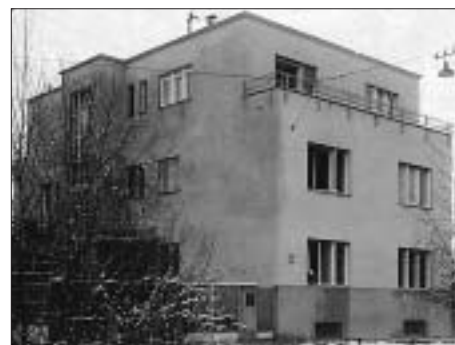
SL. 11. SLOBODNOSTOJEĆA NAJAMNA VILA BROZ, MEDVEŠČAK 98, 1937., OVL. GRADITELJ IVO VELIKONJA FIG. 11 DETACHED VILLA FOR RENT BROZ, MEDVEŠČAK 98, 1937, IVO VELIKONJA, LICENSED BUILDER