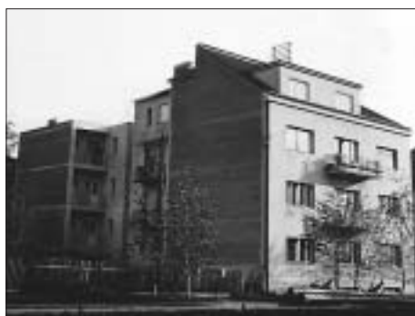
FIG. 7 SEMI-BUILT-IN VILLA FOR RENT ZEBIC, MEDVEŠČAK 42, 1932, CONSTRUCTION COMPANY KAISER AND ŠEGA, BACKYARD ADDITION FROM 1937, BOGDAN PETROVIĆ

noteže, vodoravno nanizani prozori, dubljenje građevnog tijela kako bi se omogućilo drsko strujanje sunca i zraka izdubljenim prodorima, prizor lebdećeg nosača, energični završetak ravnoga krova”... 28 nego i primjena zidarskog, dakle tradicionalnog načina izgradnje kada je jeftiniji, te tamo gdje nudi prednost školovane radne snage. 29 Novo građenje posjeduje „vlastitu volju za oblikom, koja se... osjeća kao izraz duha vremena”... 30 Dakle, Novo građenje označava škole u arhitekturi u prvoj polovici 20. stoljeća koje imaju za cilj arhitektonsko stvaranje temeljem tada suvremenih materijalnih i duhovnih uvjetovanosti. 31