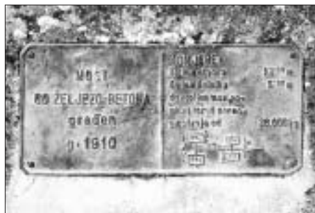
SL. 13. NATPIS NA MOSTU U PRKOVCI SA OSNOVNIM PODACIMA FIG. 13 INSCRIPTION ON THE BRIDGE IN PRKOVCI WITH BASIC DATA