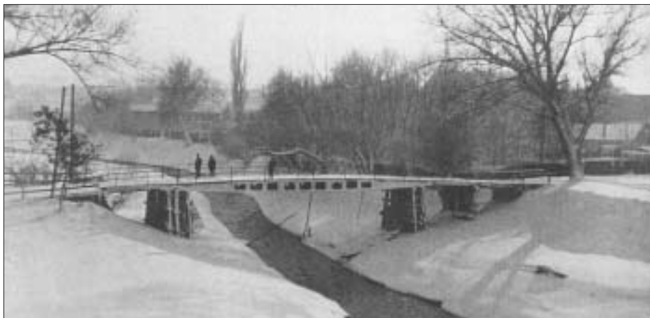
SL. 19. MOST PREKO RUKAVCA VUKE U VUKOVARU, 1912. FIG. 19 BRIDGE ACROSS THE BACKWATER OF THE VUKA IN VUKOVAR, 1912

Polemika završava u sljedećem broju „Viesti” s Carneluttijevim reagiranjem na Bellin odgovor. 63 Carnelutti se u početku osvrće na sam natječaj za mostove na Karašici i Vučići kao križaljka s rezultatima natječaja koju je Bella u svojem pismu donio nisu u potpunosti točni, te da nije istina da je tvrtka C predložila u svom elaboratu most od samo 16 tona opterećenja, umjesto 22. Ističe i svoju spremnost da taj elaborat priloži Društvu inženjera i arhitekata kako bi se u to svi mogli uvjeriti. Budući da se ne osvrće na veličinu otvora, gdje se prema Bellinim tvrdnjama tvrtka također nije držala natječaja, vjerojatno je taj dio tvrdnji bio točan. U nastavku pisma koje slijedi Carnelutti se ponovno općenito osvrće