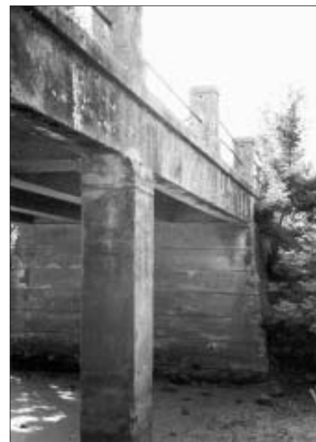
SL. 4. MOST KOD SELA RAČINOVACA PREKO POTOKA STRUŽNOGA, 1903.

Mostogradnje kod Račinovaca pridonijele su afirmaciji tvrtke ponajprije na srijemskom području, gdje je ona bila otprije poznata kao značajno cestogradveno poduzeće. Mnogo veći utjecaj na budućnost poduzeća imala je prva mostogradnja u Virovitičkoj županiji. Naime, 1905. Kotarska oblast u Osijeku odlučuje izgraditi most preko rijeke Vuke - prvi armiranobetonski podignut iznad te rijeke, koju će u još nekoliko navrata u iduća tri desetljeća Funtak premostiti. Most se trebao sagraditi na putu koji vodi iz sela Vuke do kolodvorske postaje, podignute nedaleko od mjesta na cesti koja u produžetku vodi u Dopsin. Ponude za gradnju poslale su tvrtkama Josip Banheyer i sin, Josip Dubsky te Eisner i Ehrlich. To je podatak koji je veoma dragocjen jer pokazuje da su samo tri godine nakon završetka prvoga armiranobetonskog mosta u Hrvatskoj, za koji se još morao tražiti projektant izvan granica Hrvatske, već postojale tri tvrtke koje su se specijalizirale za armiranobetonske gradnje. Samo se vukovarsko poduzetništvo odazvalo pozivu, pa je i dobilo realizaciju projekta. 36 Građevinski su radovi dovršeni tijekom ljeta i jeseni 1906. godine. Riječ je o prilično velikome mostu, s tri otvora 6-8-6 metara raspona i s ukupnim troškovima izgradnje od 9500 kruna. 37 Ovom su mostogradnjom organi vlasti bili više nego zadovoljni, pa je to poduzeću širom otvorilo vrata za buduće projek-