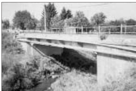
SL. 8. MOST NA BJELOVACKI - DANASNJE STANJE, S UNIŠTENIM IZVORNIM ARMIRANOBETONSKIM STUPOVLJEM OGRADE

FIG. 7 DRAWING FOR THE BRIDGE ACROSS THE BJELOVACKA ON THE ROAD BJELOVAR - BREZOVAC - NEVINAC, 1907