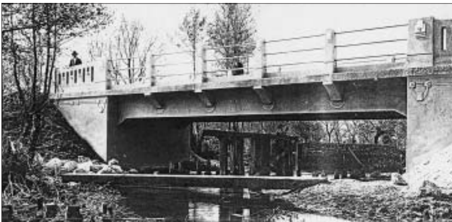
SL. 18. MOST KOD ORAHOVICE, 1912. FIG. 18 BRIDGE NEAR ORAHOVICA, 1912

osim na spoju pilona s gredom i plitkim diskovima sa strana. Kao i na mostu kod Vrpolja, na stupove ograde postavljen je motiv istaknutoga pravokutnika, a jednako je tako na oba mosta vrlo bitna koloristička artikulacija. Ovdje prvi put susrećemo rješenje kraja ograde s trokutnim poljem, kakvo će poslije Funtak nebrojeno puta ponavljati.