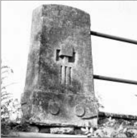
SL. 12. STUPAC OGRADE NA MOSTU U PRKOVCI, 1910. FIG. 12 BANISTER OF THE BRIDGE PARAPET IN PRKOVCI, 1910