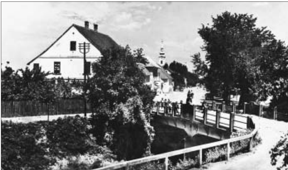
SL. 25. MOST NA RIJECI SUNJI U SUNJI, RAZGLEDNICA, 1912. FIG. 25 BRIDGE ACROSS THE RIVER SUNJA IN SUNJA, POSTCARD, 1912

raščlambe i činjenice da se njihove fotografije nalaze u ostavštini arhitekta nego i na osnovi izvora iz izvjestaja Virovitičke županije očito je da ih je projektirao Funtak. Naime, u Izvješću se ističe da je isto poduzetništvo podiglo sve tri gradnje po cijeni od 22.100 kruna – Izvješće Virovitičke županije za 1912., Osijek, 1913., str. 153.