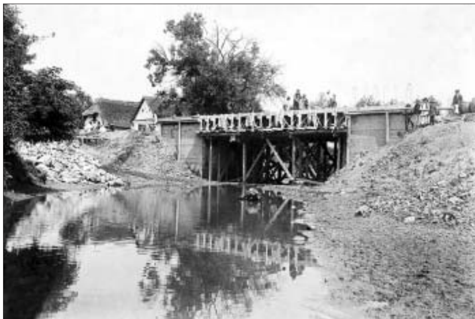
SL. 24. PODIZANJE NEPOZNATOGA MOSTA FIG. 24 BUILDING THE UNKNOWN BRIDGE

Tijekom 1912. godine Funtak podiže tri mosta u tadašnjemu građevnom Đakovačkom kotaru, koji se odlikuju posebnom kvalitetom izvedbe. Riječ je o mostovima u Orahovici i Čačincima, na zemaljskoj cesti Varaždin – Našice, te manji most na cesti koja veže Đakovo s Ruševom. 79