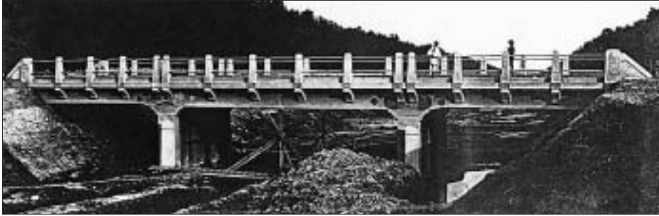
SL. 17. MOST NA KANALU VOČINSKA – DRAVA, 1911. FIG. 17 BRIDGE ACROSS THE CANAL VOČINSKA – DRAVA, 1911

stavlja konkavne konzole, kakve i ovdje susrećemo na središnjemu dijelu mosta.