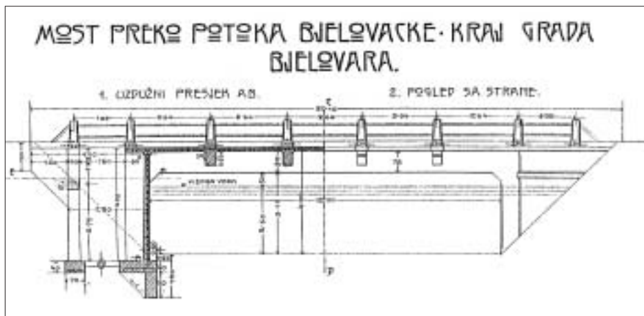
SL. 7. NACRT ZA MOST PREKO BJELOVACKE NA CESTI BJELOVAR – BREZOVAC – NEVINAC, 1907.

FIG. 7 DRAWING FOR THE BRIDGE ACROSS THE BJELOVACKA ON THE ROAD BJELOVAR - BREZOVAC - NEVINAC, 1907