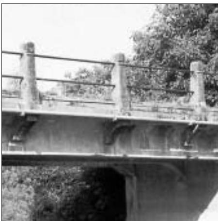
SL. 14. MOST PREKO BIĐA U PRKOVCI, POGLED NA SREDIŠNJI DIO FIG. 14 BRIDGE ACROSS THE BIĐ IN PRKOVCI, VIEW OF THE CENTRAL PART

nih dvaju primjera i poprima jasnije stilske odlike. Koliko se zasad može reći, Funtak prvi put postavlja na krajeve ograde mosta ojačane stupce s motivom, koji u ovome slučaju čine za secesiju uobičajen disk s tri vertikalna istaka, inače najraširenija motivika secesijske raščlambe.