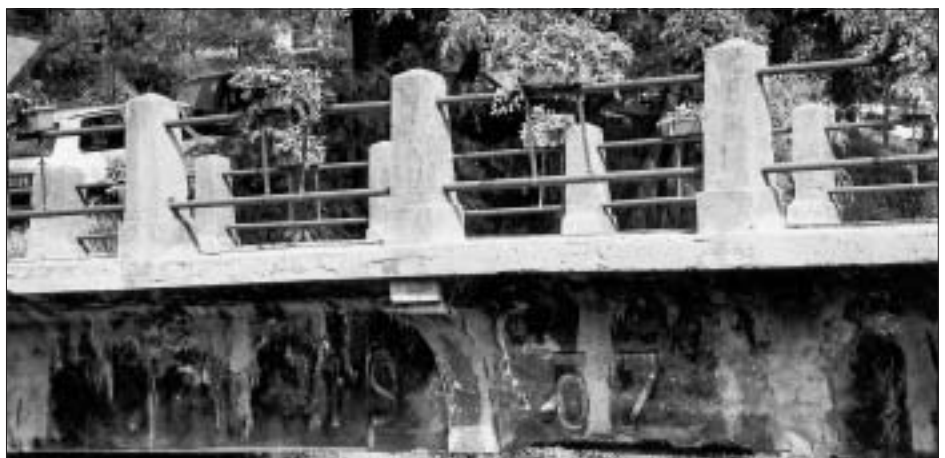
SL. 11. DETALJ MOSTA NA KRAPINICI U KRAPINI, 1907. FIG. 11 BRIDGE ACROSS THE KRAPINICA IN KRAPINA, DETAIL, 1907

Kao svojevrsan prijelaz prema novoj fazi u oblikovnom rješenju možemo navesti most sagrađen 1909. na putu Garešnica – Kapelica preko potoka Garešnice. Radi se o manjem mostu kojega je cijena iznosila 3793 kruna. 45 Most postoji i danas, no u prilično je lošem stanju i izvan uporabe. Uz njega je sagrađen nov, širi most koji adekvatnije udovoljava zahtjevima suvremenoga prometa. Oblikovno rješenje pokazuje promjenu od ranije situacije koju smo vidjeli na primjeru mostova u Krapini i Bjelovarskome kotaru. Još uvijek raščlambu (ako dio dekoracije nije otpao) čini secesijski stiliziran natpis godine izgradnje (1909.), kao u Krapini. Rješenje ograde počinje se udaljavati od već navedenih prethod-