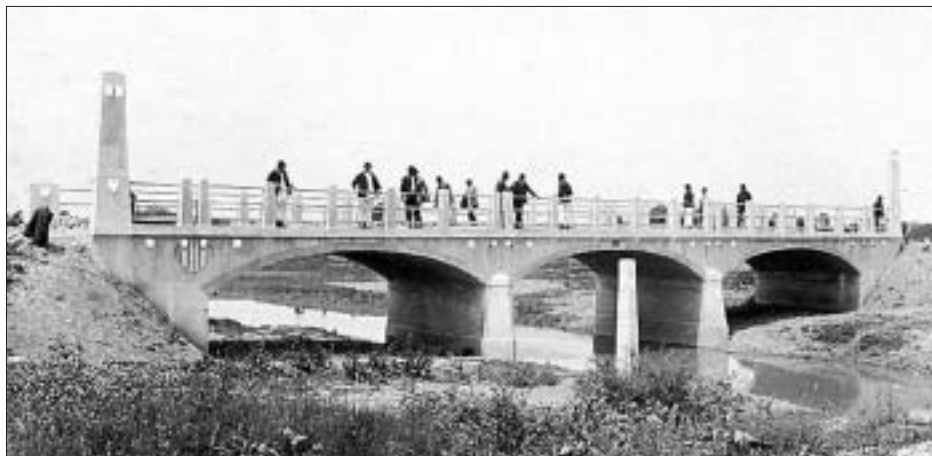
BREZNICA I DRUGI MOSTOVI ĐAKOVAČKE OKOLICE (1911.-1914.)