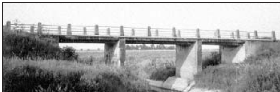
FIG. 6 BRIDGE ACROSS THE RIVER VUKA NEAR VUKA, 1905