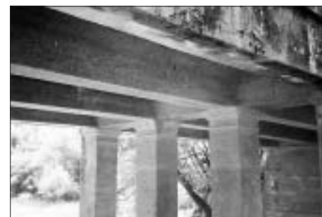
SL. 5. MOST PREKO STRUŽNOGA KOD RAČINOVACA, REBRATA KONSTRUKCIJA S PILONIMA

FIG. 4 BRIDGE ACROSS THE STREAM STRUŽNO NEAR RAČINOVCI, 1903