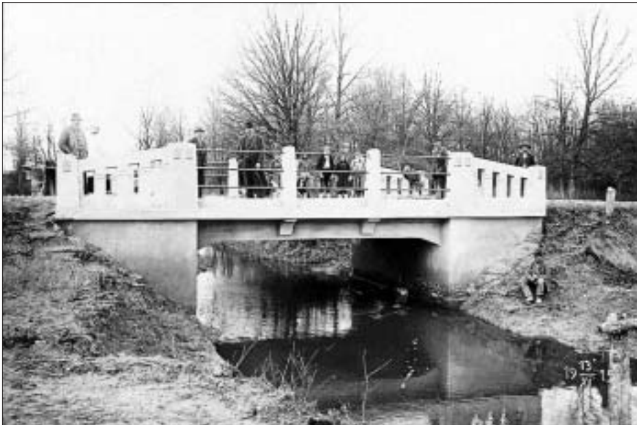
SL. 22. MOST NA CESTI ĐAKOVO – RUSEVO, 1912. FIG. 22 BRIDGE ON THE ROAD ĐAKOVO-RUSEVO, 1912

ju Županijske Posavine upravo tada jer su međunarodni konzorciji otkupili goleme površine hrastovih spačvanskih suma radi korištenja kvalitetnoga drva u industriji namještaja i buradi, te za proizvodnju tanina. Izgradnja armiranobetonskih mostova trebala je omogućiti prolaz težim strojevima, koje stari drveni mostovi ne bi mogli izdržati, do suma namijenjenih iskoristavanju. Tijekom 1910. godine najprije su podignuta 3 manja mosta, otvora samo 4 metra, s ukupnom cijenom od 27 200 kruna: preko bara Lubanj na 20./21., Tikar na 19./20. i Rabarje na 22./23. ceste Županja-Spačva, 66 dok je za iduću godinu ostavljena nešto veća mostogradnja preko potoka Brižnice, s otvorom od 6 m, koji je bio znatno skuplji pojedinačno od prethodnih mostova – ukupni troškovi njegove izgradnje iznosili su 13 680,26 kruna. 67