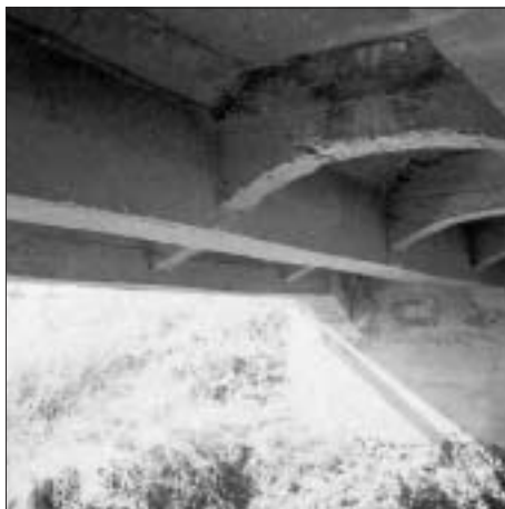
FIG. 9 BRIDGE ACROSS THE BJELOVACKA NEAR BJELOVAR, VIEW OF THE BEAM CONSTRUCTION

te, koje su zbog pouzdanosti često dobivali i bez natječaja. 38 Oblikovno most uvelike nalikuje većem objektu kod Račinovaca iako se jasno razabire da je to djelo projektanta koji je već počeo sazrijevati. Ograda mosta tako je riješena mnogo elegantnije, sa stupovima koji poprimaju proporcije i izgled obeliska, kakve će Funtak zadržati u cijelome prvom dijelu svoje karijere, sve do prije početka Prvoga svjetskog rata. Vanjske strane greda nisu uopće raščlanjene (ili im je dekoracija u međuvremenu otpala), dok su stupovi ostavljeni potpuno ogoljelima, kao suhi, iz drvenih kalupa izliveni nosači. S obzirom na spomenute dimenzije mosta, očito je da se Zemaljska vlada počela osmjeljivati na polju uporabe armiranoga betona, te da je taj materijal prestao biti pogodan samo za manje objekte.