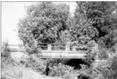
FIG. 3 BRIDGE ACROSS THE STREAM VRBOVAČA, NEAR RAČINOVCI, 1903