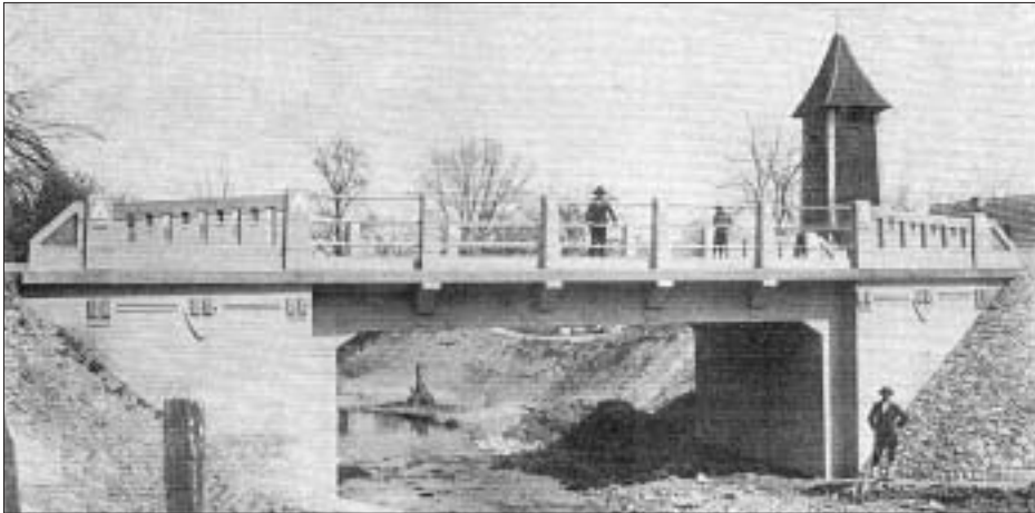
SL. 21. MOST U ČAČINCIMA, 1912. FIG. 21 BRIDGE IN ČAČINCIMA, 1912

čajno, budući da je tada krajnji istok Hrvatske, s izuzetkom zagrebackog i osječkog područja, gospodarski najpropulzivniji i općenito ekonomski najjači dio Hrvatske, gdje je seosko pučanstvo tamošnjih, doista golemih sela (od kojih su mnoga imala više stanovnika negoli bilo koji grad u gorskom području tadašnje Trojednice) svojim kapitalom, uz manju ili veću potporu Zemaljske vlade i Krajiških imovnih općina (Brodске i Petrovaradinske), sagradilo golem broj mostova.