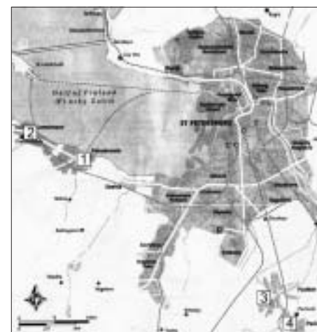
SL. 2. PERIVOJI IZVAN SANKT PETERBURGA FIG. 2 PARKS OUT OF SANKT-PETERBURG

Godine 1914. ime grada je preimenovano u Petrograd. Petrograd je tada imao 2,1 milijun stanovnika. Nekoliko godina poslije, nakon nebrojenih poraza na bojniom polju i milijun stradalih ljudi, Petrograd će ponovno postati kolijevka revolucije. Protesti su se pretvorili u opći štrajk i rada se želja za ukidanjem monarhije. U travnju car Nikola abdicira, te je s obi-