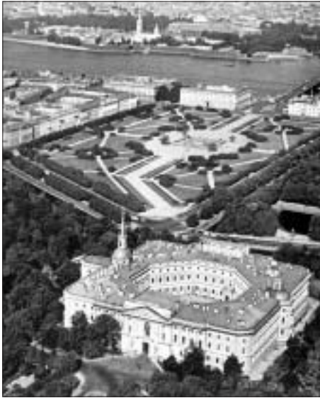
SL. 11. MARSOVO POLJE FIG. 11 MARS FIELD