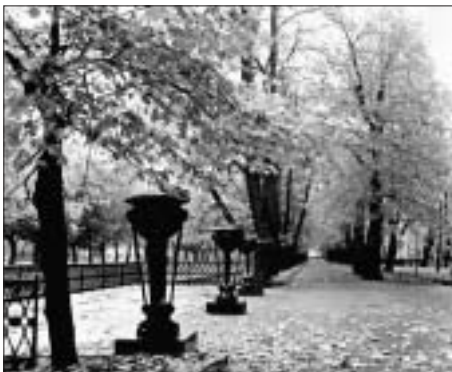
SL. 13. ŠETNICE LJETNOG PERIVOJA FIG. 13 PARK ALLEYS OF THE SUMMER PARK