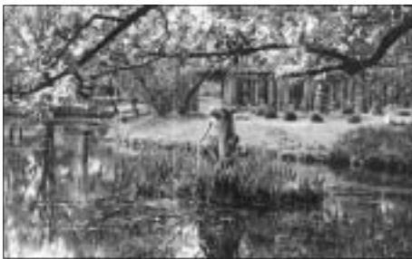
SL. 4. LOMONOSOV PERIVOJ FIG. 4 LOMONOSOV PARK