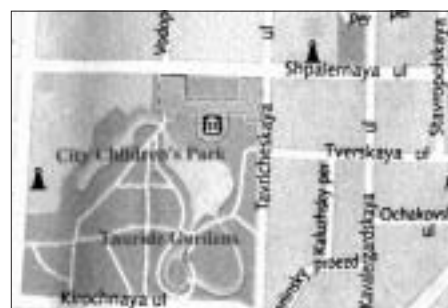
SL. 14. TLOCRT TAVRIJSKOG PERIVOJA FIG. 14 TAVRIAN PARK, PLAN

U Sankt Peterburgu riječ kontradiktoran dobiva puno značenje. Grad raskoši i sjaja je grad zapuštenosti i propadanja, grad senzualne ljepote i grad tvrde okrutnosti, grad hladne ljepote je grad snažnog temperamenta, vjeći-