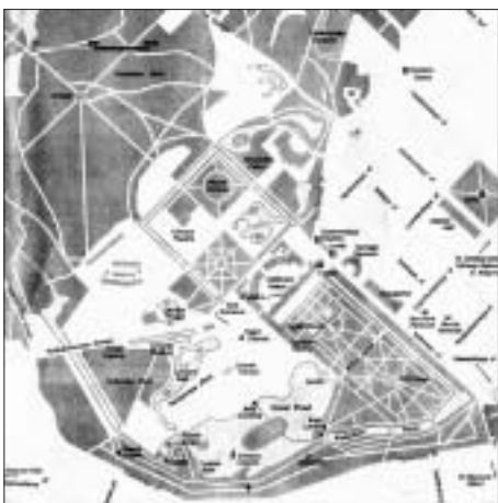
SL. 5. TLOCRT SKLOPA PUSKIN FIG. 5 PUSKIN COMPLEX; PLAN

telji protjeran u Jekaterinberg. 11 Uslijedila je revolucija 1917. godine. 12