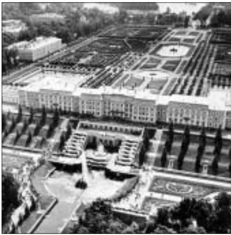
SL. 3. PETRODVOREC FIG. 3 PETRODVORETS