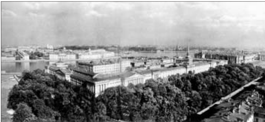
SL. 9. PERIVOJ ADMIRALITETA FIG. 9 THE ADMIRALTY PARK

Osim spomenutih, u perivoju nalazimo još nekoliko različitih građevina: „piramida” u kojoj