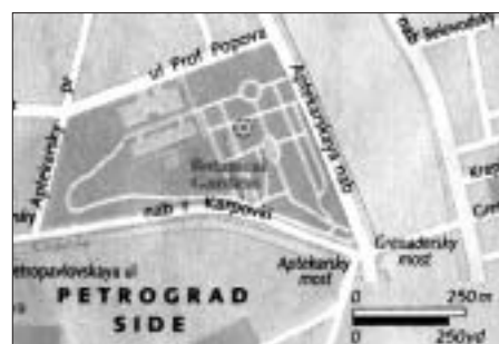
SL. 15. TLOCRT BOTANIČKOG VRTA FIG. 15 BOTANICAL GARDEN, PLAN