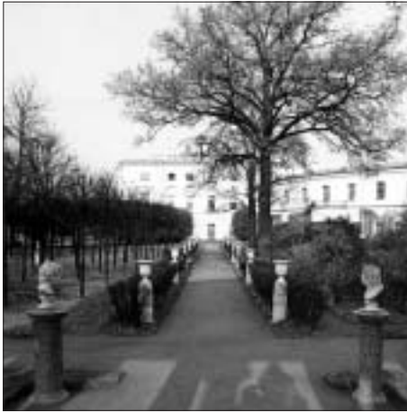
SL. 8. PRIVATNI VRT PERIVOJA PAVLOVSK FIG. 8 PRIVATE GARDEN OF THE PAVLOVSK PARK

opskrbljivali pomoću strojeva, ovaj je sustav jedinstven: koristi se prirodni pad terena s brezuljka Ropsha (22 km od Petrodvoreca) do mora. Izvorska se voda, naime, pomoću kanala skuplja u 14 vodospremnika. Zatim se s vrha brezuljka voda slije kroz cijevi velikom silom i izade na površinu prsteci kroz fontane. Pritisak je vode tako snažan da mlaz vode koji izlazi iz Samsona, tj. lavljih razjapljenih čeljusti, doseže visinu od 22 m.