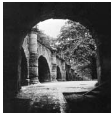
Sl. 7. KATARININ PERIVOJ, RAMPA IZMEĐU GALERIJE CAMERON I PERIVOJA Fig. 7 CATHERINE'S PALACE, RAMP BETWEEN THE CAMERON GALLERY AND THE PARK

Sustav opskrbe vodom izgradili su u 18. st. hidraulički inženjer Vasilij Tuvolkov te arhitekti Mihail Zemcov i I. Ustinov. Za razliku od fontana europskih perivoja, koji su se vodom