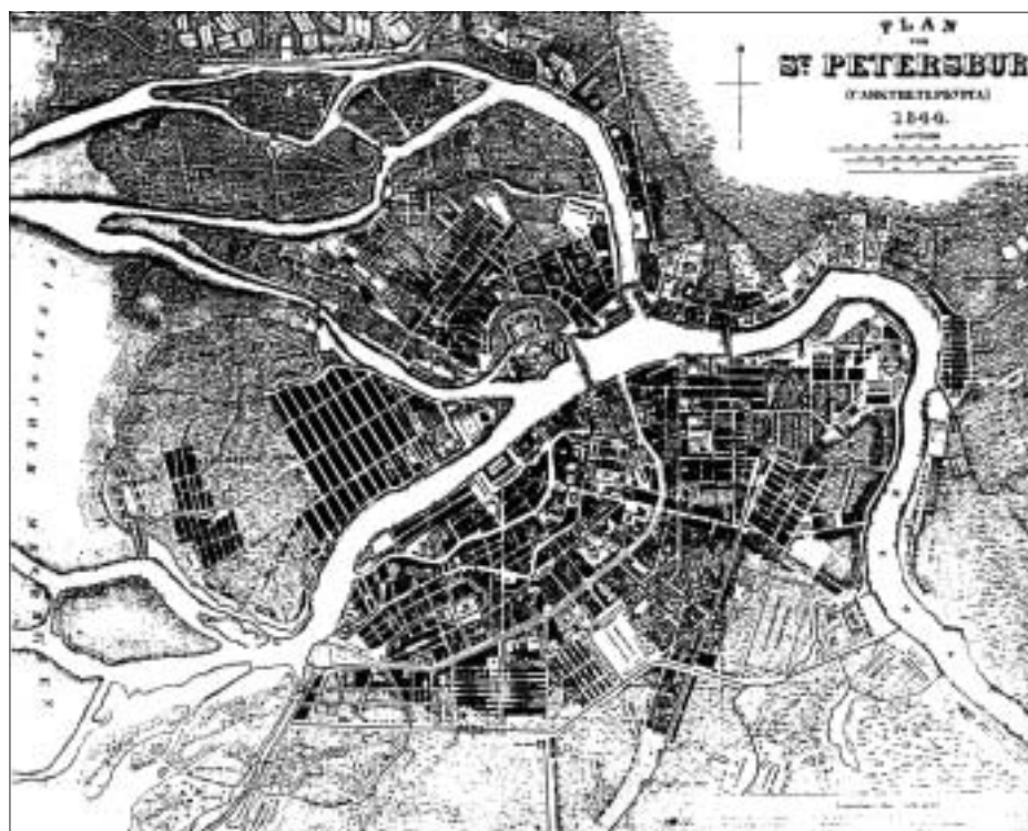
SL. 1. SANKT PETERBURG 1844. GODINE FIG. 1 SANKT-PETERBURG, 1844

Tijekom vladavine Aleksandra II. (1855.-1881.) 8 i njegova sina Aleksandra III. (1881.-1894.) 9 središnja je Azija došla pod vlast Rusije. Na istoku su zauzeli dugačak potez obale do Kine i izgradili luku Vladivostok, a 1867. prodali su „beznačajnu” Aljasku SAD-u za 7,2 milijuna dolara. Gradile su se željeznice, tvornice, a