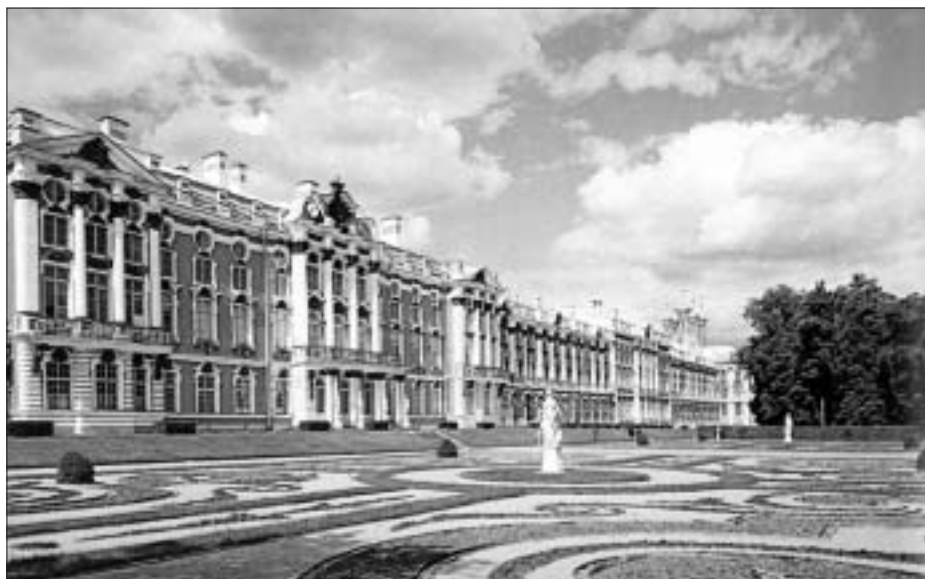
Sl. 6. GLAVNO PROČELJE KATARININE PALAČE, PUSKIN Fig. 6 CATHERINE'S PALACE, PUSKIN; FRONT

palača. Njeno južno pročelje gleda na gornji perivoj čiji je plan organski povezan s kompozicijskom shemom palače. Veliki zeleni parter pred njom omogućuje pogled na palaču već s ulaza u perivoj. Uzduž te središnje osi od ulaza, preko perivoja do palače, smještene su Neptunova i Hrastova fontana, a neposredno uz palaču, u velikim kvadratičnim bazenima, fontane posvećene Proljeću i Ljetu. 15