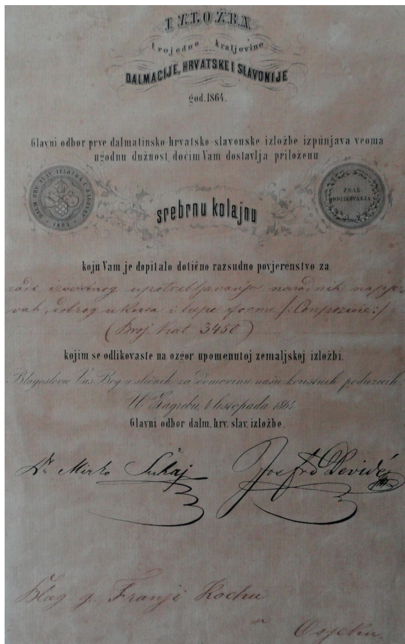
Sl. 2: Izložba Trojedne kraljevine Dalmacije, Hrvatske i Slavonije, Zagreb, 1864. Obrazloženje povjerenstva uz dodijeljenu srebrnu kolajnu.