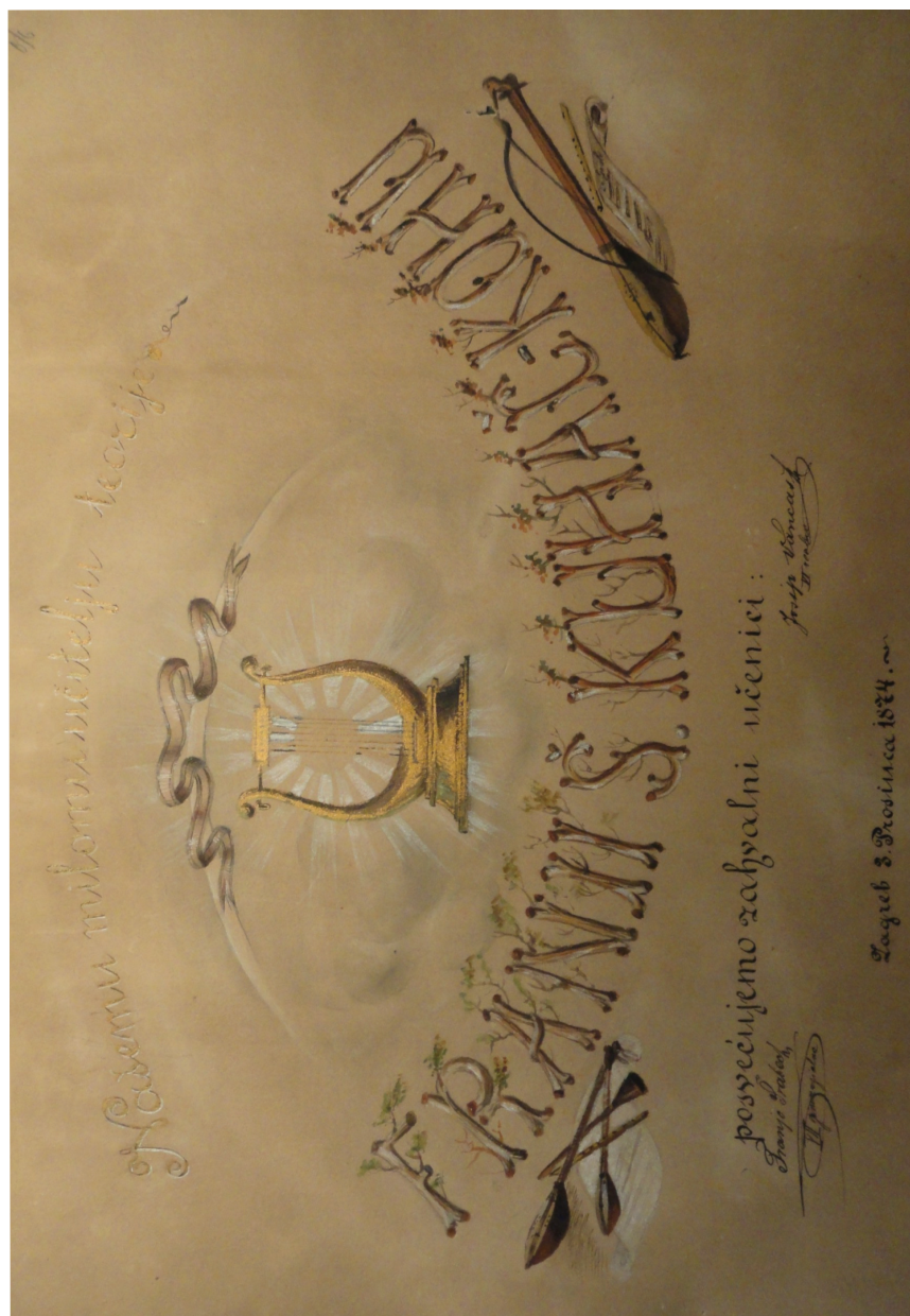
Sl. 4: Zahvala učenika Franje Šrabeca i Josipa Vancša, Zagreb, 3. XII. 1874.