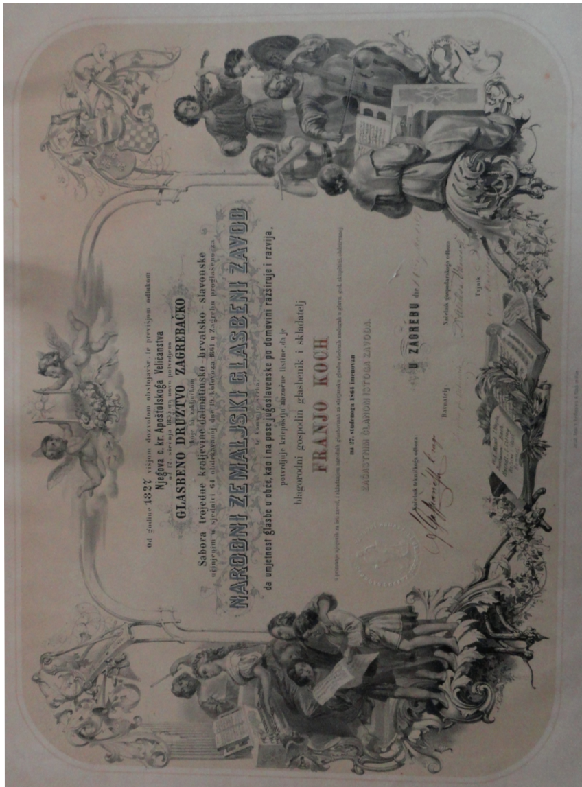
Sl. 3: Narodni zemaljski glasbeni zavod — Glasbeno društvo zagrebačko, Zagreb, 1. III. 1867. Diploma počasnog člana.