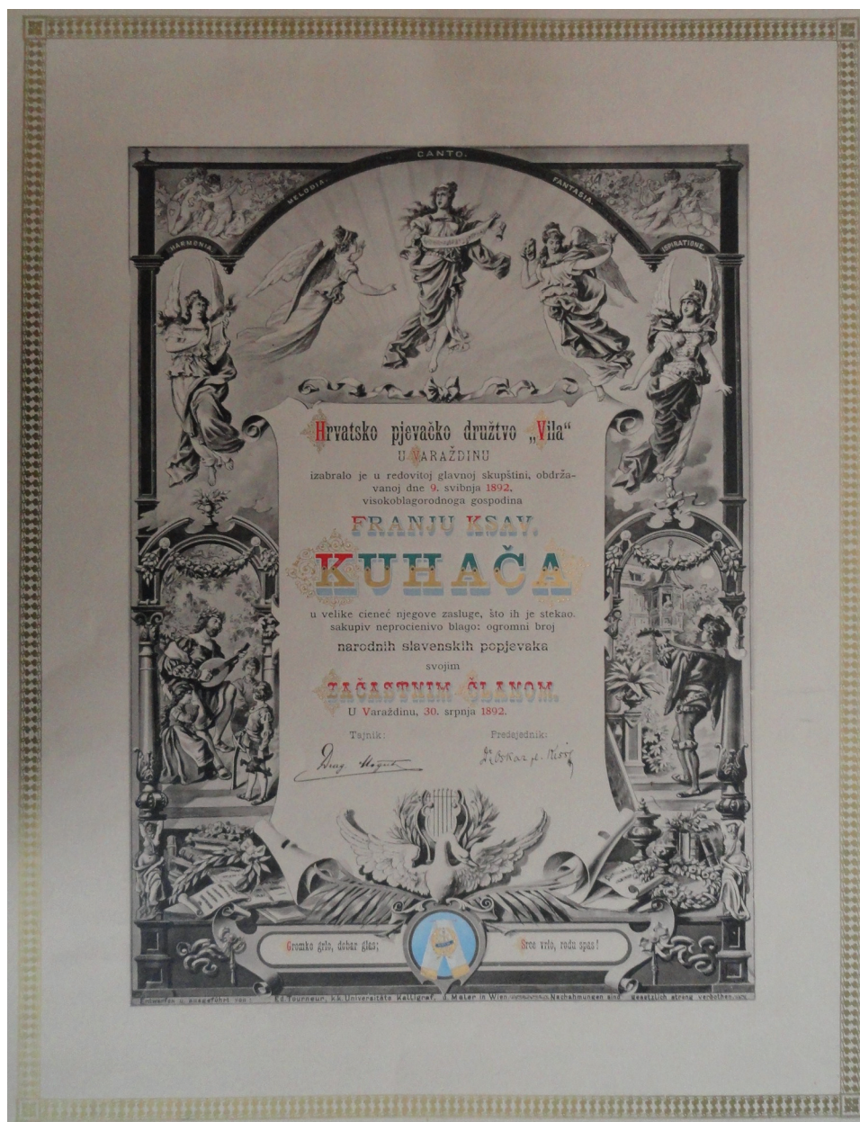
Sl. 5: Hrvatsko pjevačko društvo Vila, Varaždin, 30. VII. 1892. Diploma počasnog člana.