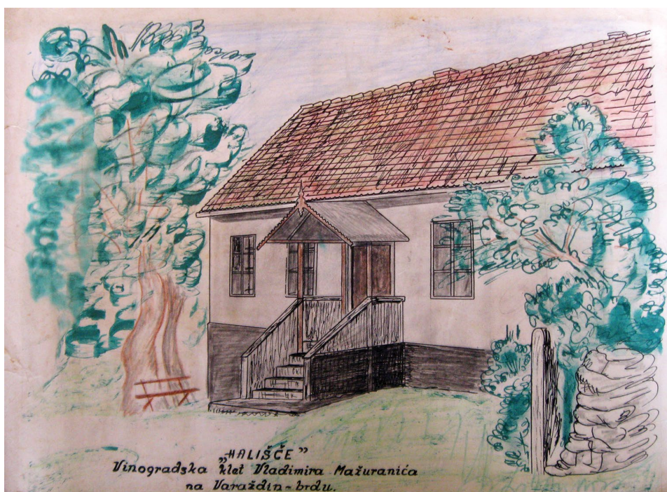
Sl. 2. Nepotpisan crtež vinogradske klijeti Vladimira Mažuranića na Varaždin brijegu, na tzv. Haliču ili Hališću. Fig. 2 Anonymous drawing of Vladimir Mažuranić's wineyard cottage located on the Varaždin Hill, called Halič or Hališće.