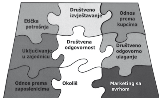
Slika 1. Odnos elemenata društvene odgovornosti

Figure 1. Relation between elements of social responsibility