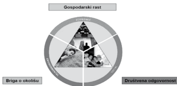
Slika 2. Trokut uvjetovanosti održivog razvoja

Velike tvrtke u Hrvatskoj, mahom one u stranom vlasništvu, već iskazuju svoju društvenu odgovornost, ali prepreka široj implementaciji jest nepostojanje jasnog pravnog okvira. Stoga se često društveno odgovorna politika u poslovanju velikih korporacija u Hrvatskoj pričinja kao isključivo marketinški potez. To je najvećim dijelom rezultat procjene da potrošači, globalno gledajući, zahtijevaju da gospodarski subjekti pozitivno utječu na društvo u cjelini.