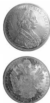
Slika 5. Lice i naličje velikog dukata

Zbog svoje rasprostranjenosti i popularnosti kroz prethodno stoljeće, on se i danas često može naći u Slavoniji. Osobito je ističe kao najvažniji nakit na ionako bogatoj slavonskoj nošnji kojoj daje poseban sjaj. Postoji nekoliko različitih načina vezanja dukata na ženskoj nošnji (u „grozd“, vertikalne redove i polukrug).