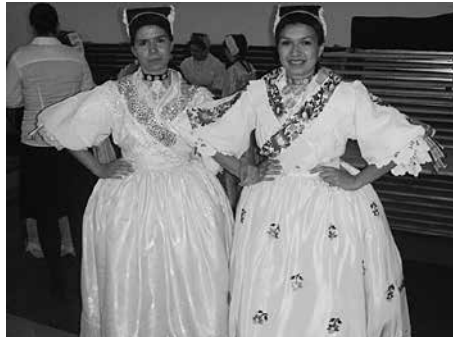
Slika 6. Slavonke odjevene u narodnu nošnju (s dukatima vezanima u „grozd” oko vrata)

Na snaši 6 Janji su na poprsju veliki dukati povezani u „grozd”. Prvi red (koji stoji uz vrat) sadrži 7 dukata, a svaki sljedeći red koji se nalazi ispod prethodnog sadrži jedan dukat manje u odnosu na red iznad njega. Koliko redova čini taj „grozd” te koliko ukupno dukata resi snašu Janju ako znamo da oko vrata nosi vrpču ukrašenu sa 6 dukatića, u ušima nosi naušnice od dva mala dukata (ušnjaci) te na ruci dukat-prsten? U slučaju da su veliki dukati snaše Janje povezani u vertikalne stupce (linije na trakama), odredite na koliko bi ih ukupno načina Janja mogla prikazati ako je najmanji mogući broj stupaca 3, a najveći 6, te ako je najmanji broj dukata u pojedinom stupcu jednak 4, a najveći 8?