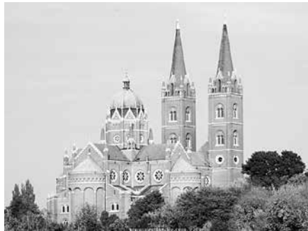
Slika 1. Katedrala u Đakovu sa svoja dva vitka tornja i prepoznatljivom kupolom

Svjedok obrane od turskih najezdi u Osijeku (četvrtom po veličini gradu u Hrvatskoj) je Tvrđa, a u drugom po veličini slavonskom gradu, Slavnskome Brodu, o tome govore ostaci nekada moćne Tvrđave Brod ( Festung Brod ) koju zbog njezine veličine i povijesne važnosti zovu i „Dioklecijanovom palačom sjevera”. Nedaleko od te znamenitosti, uz samu rijeku Savu, smještena je i kuća u kojoj je jedna od najznačajnijih hrvatskih spisateljica za djecu, Ivana Brlić-Mažuranić (nazivana i „hrvatski Andersen” i „hrvatski Tolkien”), proživjela većinu života te napisala mnoga svoja djela (najpoznatije su „ Priče iz davnine ”).