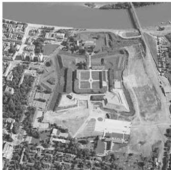
Slika 2. Sadašnji izgled Tvrđave Brod

Svjedok obrane od turskih najezdi u Osijeku (četvrtom po veličini gradu u Hrvatskoj) je Tvrđa, a u drugom po veličini slavonskom gradu, Slavnskome Brodu, o tome govore ostaci nekada moćne Tvrđave Brod ( Festung Brod ) koju zbog njezine veličine i povijesne važnosti zovu i „Dioklecijanovom palačom sjevera”. Nedaleko od te znamenitosti, uz samu rijeku Savu, smještena je i kuća u kojoj je jedna od najznačajnijih hrvatskih spisateljica za djecu, Ivana Brlić-Mažuranić (nazivana i „hrvatski Andersen” i „hrvatski Tolkien”), proživjela većinu života te napisala mnoga svoja djela (najpoznatije su „ Priče iz davnine ”).