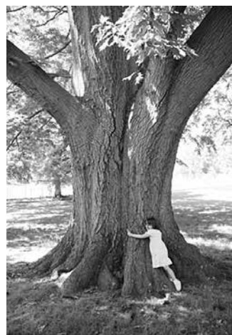
Slika 8. Iznimno dirljiva scena sa školskog izleta u šumu

Dragi Matkači, pozivam vas u Slavoniju! Tu ćete susresti seljaka hrapavih ruku poput kore višestoljetnog hrasta, koje su cijeli život stoljećima obrađivale tvrdnu zemlju hraniteljicu. Od njezina je praha slavonski čovjek potekao, na zemlji i od zemlje je živio, a na kraju će se i vratiti svojoj majčici zemlji. Tu vas čekaju prirodne ljepote, pjesma, smijeh, veselje, podcikivanje u kolu, ugodni mirisi, umilne i gizdave djevojke i snaše, momci ponosna hoda, blaga lica djedova i baka te radišni ljudi široke slavonske duše i velika srca koji čuvaju svoj dom i diče se svojim rodom, tradicijom, baštinom, običajima i bogato ukrašenom nošnjom. Dobrodošli!