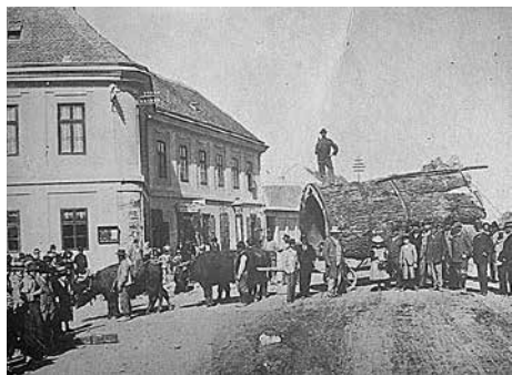
Slika 7. Dio starog slavonskog hrasta orijaša (Vinkovci, 1900. g.)

ruku u prosjeku 5 cm veći od visine, odredite koliko je najmanje učenika potrebno da, držeći se međusobno za ruke, zajedno obgrle to stablo? (Pretpostavljamo da je presjek stabla kružnog oblika.)