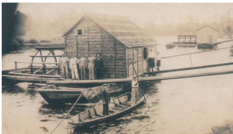
Slika 4. Vodenice na Muri snimljene oko 1950. godine (kod Kotoribe)

U okviru aktualnoga teritorijalnog ustroja Hrvatske, RP Mura-Drava proteže se kroz 5 sjevernohrvatskih županija, odnosno kroz dijelove teritorija 8 gradova i 46 općina. Od ukupno 87.680,52 hektara površine, na području Međimurske županije nalazi se 19,40 posto RP Mura-Drava, zatim na području Varaždinske županije 11,23 posto, Koprivničko-križevačke županije 19,19 posto, Virovitičko-podravске županije 20,35 posto i Osječko-baranjske županije 29,84 posto (Tablica 2.). U Međimurskoj županiji dijelovi RP Mura-Drava zahvaćaju poloje u općinama Dekanovec, Domašinec, Donja Dubrava, Donji Kraljevec, Donji Vidovec, Goričan, Kotoriba, Nedelišće, Orehovica, Podturen, Sveta Marija, Sveti Martin na Muri i Štrigova, te gradovima Čakovcu, Murskom Središću i Prelogu. U Varaždinskoj županiji dijelovi parka nalaze se u općinama Cestica, Martijanec, Mali Bukovec, Petrijenec, Sračinec, Sveti Đurđ, Trnovec Bartolovečki i Veliki Bukovec, te gradu Varaždinu. U Koprivničko-križevakoj županiji park zahvaća dijelove općina Drnje, Đelekovec, Ferdinandovec, Gola, Hlebine, Legrad, Molve, Novo Virje, Peteranec i Podravske Sesvete, a u Virovitičko-podravskoj županiji dijelove općina Čađavica, Gradina, Lukaš, Pitomača, Sopje, Suhopolje i Špišić Bukovica. U Osječko-baranjskoj županiji park se dijelom proteže na području općina Bilje, Darda, Erdut, Jagodnjak, Marijanci, Petlovac, Petrijevc, Podravska Moslavina i Viljevo, te gradova Belišće, Donji Miholjac, Osijek i Valpovo.