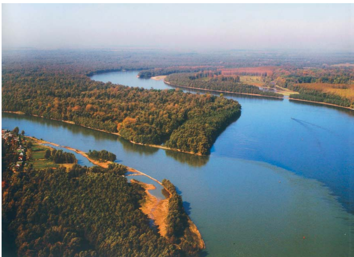
Slika 14. Ušće Drave u Dunav kod Aljmaša