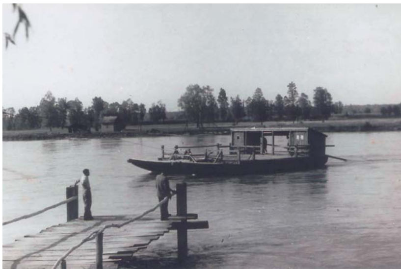
Slika 5. Dravu se stoljećima prelazilo skelom (brodom) - snimljeno kod Drenovice u Podravini oko 1980. godine