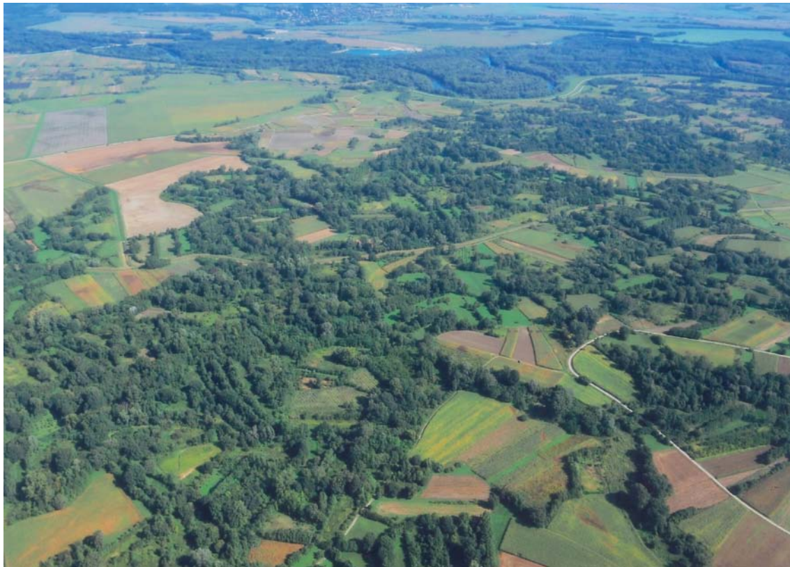
Slika 9. Šume i šumarci u poloju Mure između Goričana i Kotoribe