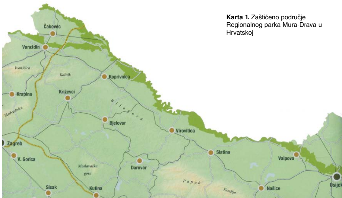
Karta 1. Zaštićeno područje Regionalnog parka Mura-Drava u Hrvatskoj