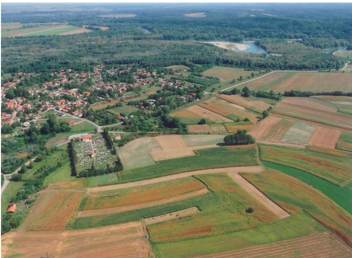
Slika 11. Pogled na Legrad i sutok Mure u Dravu