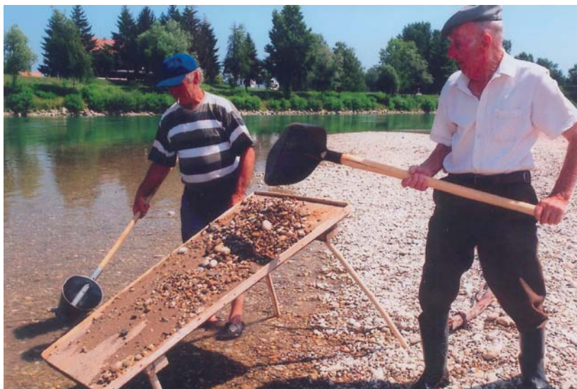
Slika 6. Specifično zanimanje na dravskim sprudovima - ispiranje zlata. Snimljeno kod Donje Dubrave 2013. godine

tinuirano je rastao do početka 20. stoljeća (u rječima i do polovice toga vijeka), a potom slijedi stagnacija i opadanje. U zadnjih 40-ak godina proces depopulacije tih naselja ima znatno ubrzanje, tako da su mnoga sela uz Dravu već ušla i u fazu demografskog odumiranja. Razlog tomu je stalna migracija u gradove, te tradicionalno vrlo niski natalitet.