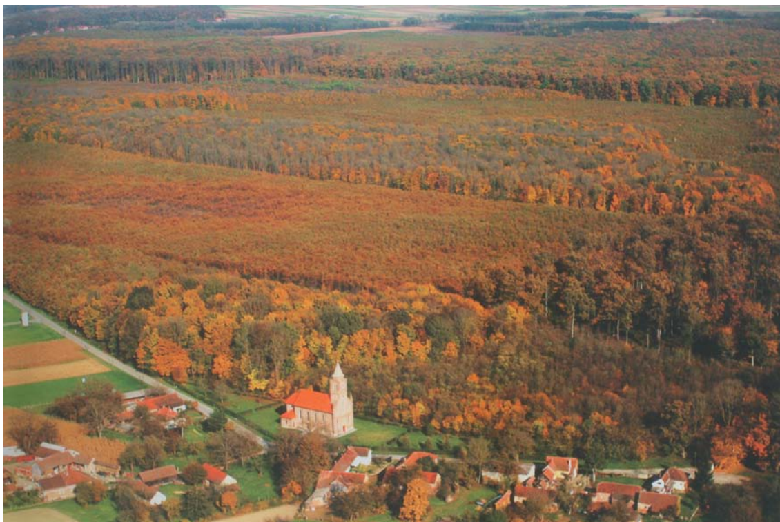
Slika 13. Najveći kompleks šume hrasta lužnjaka sačuvan uz Dravu - Repaška šuma ima površinu od 4500 hektara