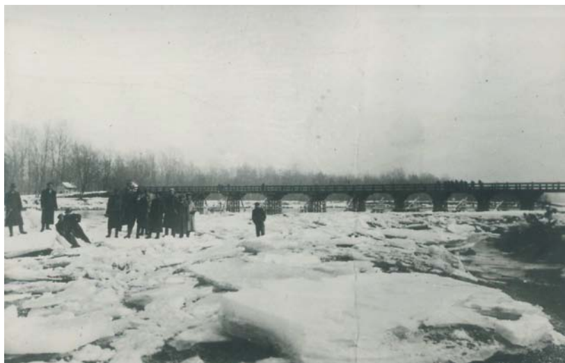
Slika 3. Snaga zime i leda na Dravi - snimljeno kod starog drvenog mosta na Dravi kod Donje Dubrave 1963. godine