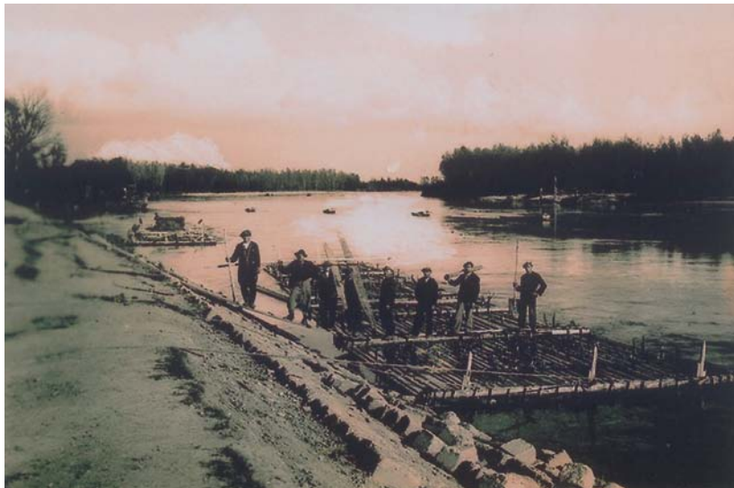
Slika 7. Drava je nekad služila i kao važna prometnica - trgovina drvom na splavima (flijsima). Snimljeno kod Donje Dubrave oko 1922. godine