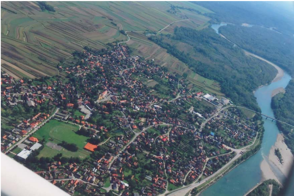
Slika 11. Pogled na Dravu kod Donje Dubrave