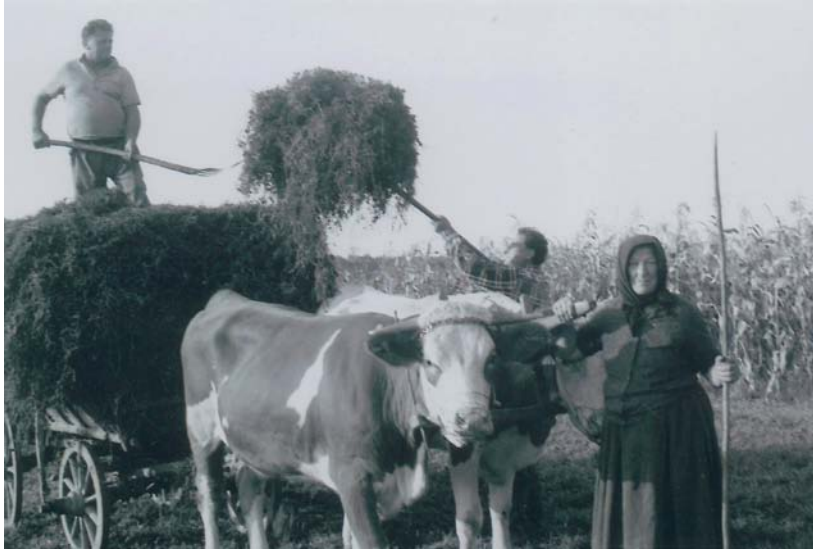
Slika 1. Ekološka poljoprivreda u poloju Drave - odvozi se sijeno s livada kod Novoga Virja