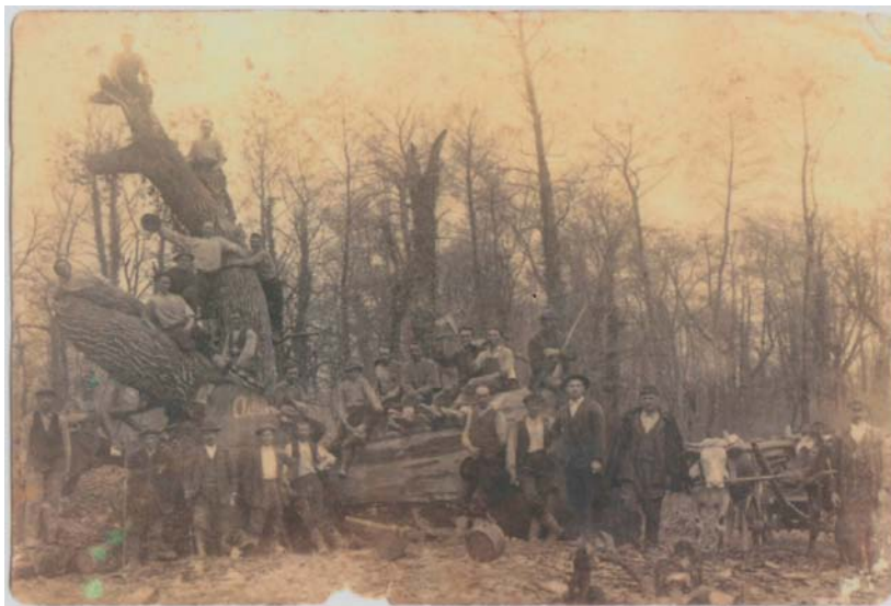
Slika 2. Sječa hrasta Adama kraj Mure 1925. godine

nema više nekadašnje intenzivne morfološke dinamike. Veći dio voda teče derivacijskim kanalima, dok je nakon brana u starim koritima ostalo malo vode, tek biološki minimum. Sve te promjene znatno utječu na živi svijet u rijeci i oko nje. Život uz rijeku i s njom bitno se promijenio i za priobalno stanovništvo.