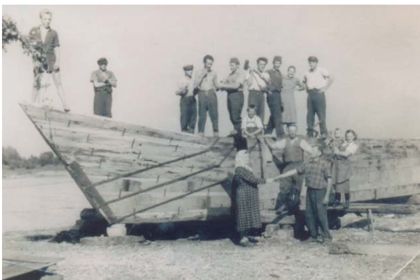
Slika 8. Građenje drvene kompe za mlin na Dravi - snimljeno kod Novoga Virja oko 1950. godine

Na formiranje tla, ali dakako osobito i na biljni i životinjski svijet, kao i na djelatnosti čovjeka, velik utjecaj i na području parka imaju specifične klimatske karakteristike. Ovdašnja klima ima izražene kontinentalne značajke, s određenim mijenama od zapada prema istoku. Prosječna godišnja temperatura na zapadnom dijelu parka kreće se u siječnju na oko minus 1°C, a na istoku oko nule. Srpanj je na zapadu prosječno vruć oko 20°C, a na istoku dva stupnja više. Međutim, za život pejzaža i čovjeka bitni su ekstremi koji su ovdje vrlo izraženi. Godišnja temperaturna amplituda zna doseći i 65°C, što znači da se živa ljeti zna podići i na 40°C a zimi spustiti i na minus 25°C. Kiše nose uglavnom zapadni vjetrovi, pa na zapadu parka prosječno godišnje padne od 900 do 950 mm padavina po četvornom metru, a na istoku samo 700 mm. Cijelo područje parka uglavnom pripada zajednici hrasta lužnjaka ( quercus robur ) i pripadajućih prirodnih biljnih vrsta, a na istoku (prema Vojvodini) park već graniči i sa stepskom vegetacijom.