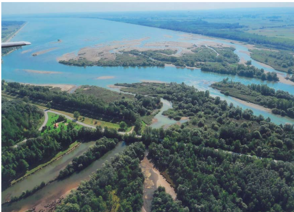
Slika 10. Na početku najveće akumulacije u Hrvatskoj - Dubravskog jezera kod Preloga