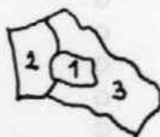
(b) Moguća podjela