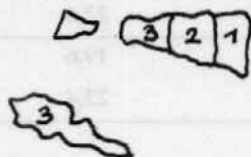
(a) Postojeća podjela