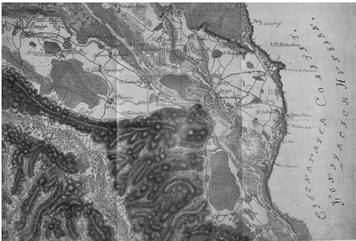
Slika 2: Jožefinska vojaška karta: izris področja rečne situacije tik okrog mesta Radgona (Slovenija na vojaškem zemljevidu 1763-1787, Karte, 6. zv., sekcija 144.) Celotno novoveško mesto je locirano na Murskem otoku, dostopno pa je bilo izključno prek obeh mostov.