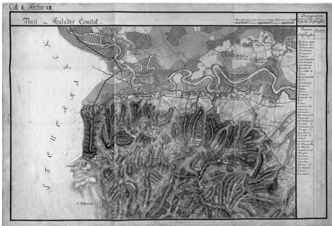
Slika 5: Jožefinska vojaška karta: izris področja rečne situacije v okolici med Gornjo, Srednjo in Dolnjo Bistrico ter Razkrižjem: lepo je razvidna lokacijska situacija vasice Dolnja Bistrica (nad Razkrižjem), na karti direktno označene le z izpisom unter (Slovenija na vojaškem zemljevidu 1763-1787, Karte, 7. zv., sekcija II - 13.)