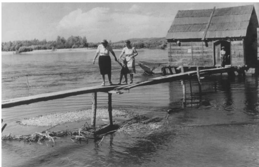
Mlin na rijeci Muri kod Dekanovca

na širem međimurskom području, ne samo uz prostor rijeke Mure. Dok se austrijsko-slovenska knjižica više fokusirala na samu rijeku Muru i pojave i procese koji se vežu uz rijeku Muru.