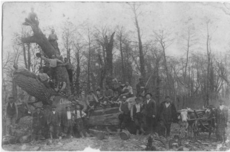
Sječa hrasta Adama kraj Mure 1925. godine

posljedica nedostatka joda u riječnoj vodi. Uz poplave odnosno obranu od poplava vežu se regulacije rijeka pa bi bilo dobro vidjeti koje su promjene u okolišu i životu ljudi donijele regulacije rijeke. U literaturi i izvorima moguće je pronaći podatke da se život ljudi uz rijeke Muru i Dravu razlikovao od života ljudi u unutrašnjost Međimurja po dodatnim obvezama koje su ljudi uz rijeku bili dužni izvršavati. Tako su do Drugog svjetskog rata obveze iz nepisanog zakona bile „grabe.“ „Grabe“ je bio obvezan rad na utvrđivanju rijeke od bujica. U slučaju naglog porasta vodostaja i opasnosti od poplava mještane se pozivalo putem seoskog bubnjara da dođu s alatom spašavati obalu, mostove, skele, mlinove i sela. Sela uz rijeke morala su imati pripremljeni materijal, zemlju i drvene snopove pruća. 71 Isto tako, bilo bi zanimljivo istražiti kakve posljedice je na rijeku Muru, a onda i na život ljudi imalo „malo ledeno doba,“ što o tom vremenu govore izvori, ukoliko postoje. Općenito, „malo ledeno doba“ je trajalo otprilike između 1400. i 1850. godine, a najhladnije je bilo oko 1550. i 1700.-1850. godine kada se u Europi javio niz hladnih zima. 72 Velika je hladnoća rezultirala smrzanjem rijeke, a rijeka Mura pogotovo se zamrzavala 1577. i 1578. godine što je pak Osmanlijama omogućavalo svakodnevni prijelaz preko rijeke u Međimurje. 73