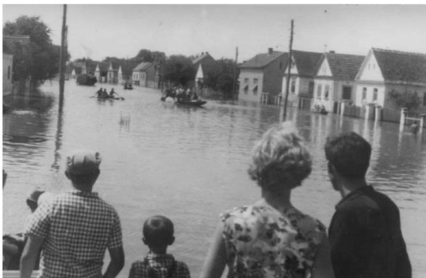
Poplava rijeke Mure u Kotoribi 1965. godine (D. Feletar)

Stjepan Hranjec u monografiji Goričana donosi podatke da je rijeka Mura široka 120-150 metara, da je mijenjala svoje korito (doduše, rjeđe nego Drava), pa odatle i pojedini mrtvi rukavi koji se nazivaju Stara Mura. Za visokog vodostaja u svibnju i lipnju Mura se donedavno vrlo često izlivala iz svog korita, plaveći obradive zemljišne površine sjeverno i istočno od sela. Ona je stoga donosila zlo i brige, no i korist (melini na Muri); čovjek se stoga prema njoj odnosio s određenim poštovanjem, pa nije čudno što se našla kao poticajan motiv u usmenoj narodnoj pjesmi. 8