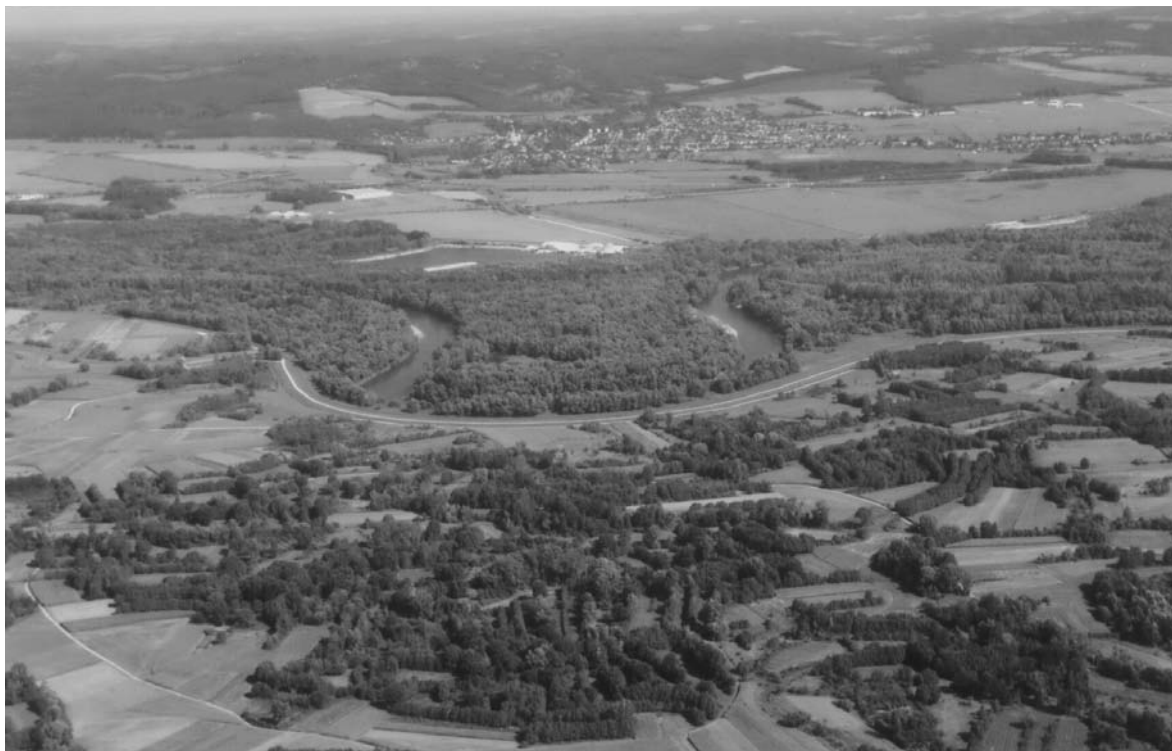
Pogled na šume i meandre Mure između Goričana i Kotoribe

u velikim gradovima smještenima na rijeci (Bruck an der Mur, Graz) te gradnjom hidroelektrana poboljšana je ekološka kvaliteta voda rijeke Mure. 3