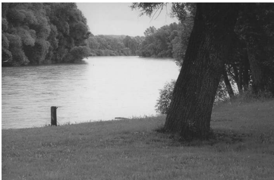
Rijeka Mura kod Velikog Pažuta, blizu Legrada (R. Ibršević)