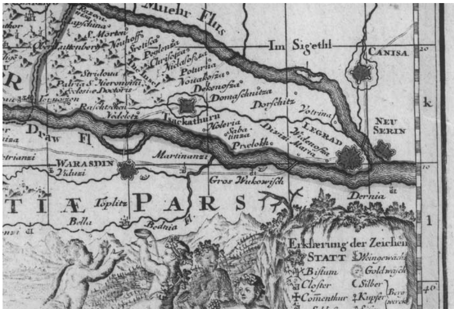
Rijeke Mura i Drava na karti Johana Baptiste Homanna iz 1714. godine

naziv ludbreščak, bosanac ili srbijanac. 13 Posljednji mlin na Muri prestao je s radom 1951. godine. 14 U ovoj monografiji autor se također ukratko dotiče teme poplava. 15