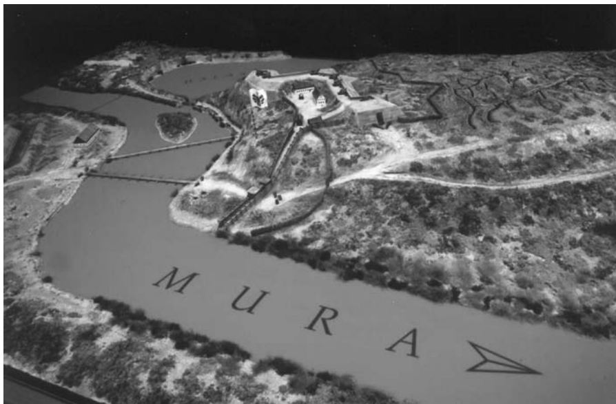
Rekonstrukcija zrinske utvrde Novi Zrin na Muri 1664. godine (Vojno povijesni institut Budimpešta, 2013.)

autor spominje smješta u razdoblje nakon Drugog svjetskog rata, 1945. godine. 28 Sljedeći podatak vezan uz rijeku Muru odnosi se na 1965. godinu kada se Mura izlila na čitavom svom toku kroz Međimurje. 29 Nakon toga veća poplava rijeke Mure dogodila se 1972. godine 30 te zaključna godina koju je autor obrađivao je 1989. 31 U zaključnim razmatranjima vezanim uz poplave u Međimurju autor donosi podatke da je rijeka Drava brža od Mure i kada dolazi do porasta vodostaja u isto vrijeme, tada rijeka Drava usporava protok rijeke Mure i tim usporavanjem dolazi do povišenja vodostaja rijeke Mure pa i do opasnosti da ona počne poplavljavati okolicu. Također, statistički gladno u razmatranom razdoblju (1963. - 1989. godine) mjesta koja su navije stradala od poplava uz rijeku Muru bila su Kotoriba, Podturen i Sveti Martin na Muri. 32 Zahvaljujući izgradnji vodoobrambenih nasipa na rijeci Muri te hidroelektrane na rijeci Dravi danas više nema većih opasnosti od poplava. Autor sam na kraju kaže da možda nije obradio sve poplave u 20. stoljeću, no dotaknuo se onih najvećih.