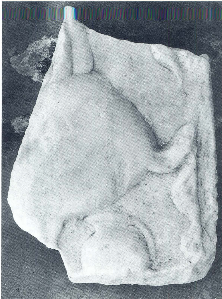
Izgubljeni rapski fragment antičkog sarkofaga

(42x31x7,5 cm) odlomljen je u obliku nepravilnog peterokuta. Veći dio polja zauzima zadak konja okrenutog nalijevo s valovitim repom, presječenim vertikalno desnim rubom fragmenta. U gornjem lijevom kutu vidi se gola stražnjica jahača, a neposredno iza noge konja kaciga (nekog pješaka) okrenuta također nalijevo. Neznatno valovito reljefno ispupčenje u gornjem desnom uglu fragmenta možda je kraj vijorećeg plašta (hlamide, kopčane fibulom) koji redovito nose, kao jedini komad odjeće, inače neodjeveni konjanici na antičkim reljefima toga tipa, a obično dužinom dosižu do konjskog repa.