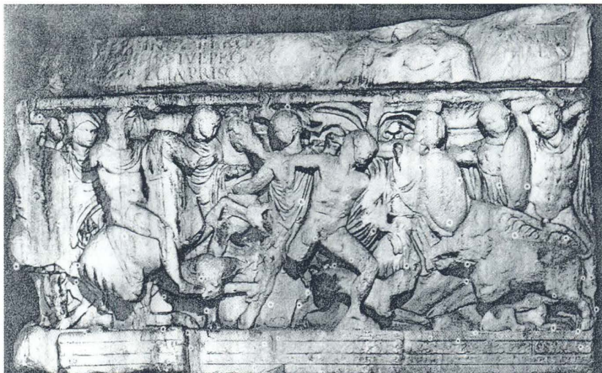
Sarkofag Meleagra iz Salone u Splitu

repa reljefa desnog kentaura iz kuće Geremia - Zlendić u Splitu (tb. XVII); sva su tri okrenuta udesno. Mnogo je bliži po kvaliteti izvedbe, kao što je već rečeno, lijevi konjanik na čeonj strani solinskog sarkofaga Meleagra u lovu na vepra (iz 240 - 250 g.) u Arheološkom muzeju u Splitu, 20 okrenut također u suprotnom smjeru.