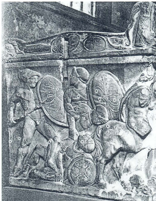
Atički sarkofag iz Istanbula, lijeva bočna strana

Ako precrtamo isječak navedene reljefne kompozicije s bočne strane carigradskog sarkofaga što sadržajem odgovara rapskom i okrenemo ga naopako, mislim da postaje očevidno kako je rapski fragment najvjerojatnije dio jedne veoma slične kompozicije. Logično je, međutim, pretpostaviti - s obzirom na suprotan smjer radnje - da je na rapskom sarkofagu ovaj prizor bio na desnoj ili na prednjoj strani sarkofaga. 14