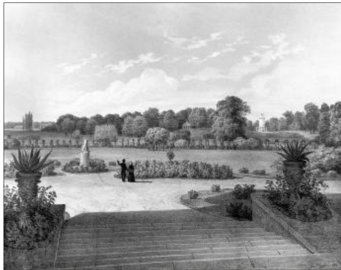
Sl. 5. Pogled s terase Haulikova ljetnikovca Fig. 5 View from the terrace of the Haulik's summer cottage

Vidjeli smo kamo je Vrhovac smjestio središnju točku svojega perivoja, a iz njegove kompozicije poznata nam je samo još jedna točka. Riječ je o ulazu u perivoj, na istome mjestu na kojemu se nalazi i danas. 27 Zanimljivo je pritom zašto Vrhovac nije odlučio ulaz smjestiti što je više moguće prema zapadu, uz kržanje današnje Maksimirske i Bukovačke. Time bi produljio prilaz prema brežuljku odnosno središtu perivoja, potez koji je očigledno poslije i Haulik cijenio jer ga je zadržao u svojem pejzažnom perivoju. No pogledamo li neke prikaze toga prostora prije Vrhovca, 28 opazit ćemo da taj najzapadniji dio nije bio posumljen. Da je ondje započet glavni prilaz, bio bi nekonzistentno oblikovan; prvi dio bio bi, naime, na istini pa bi tek valjalo saditi stabla, a nastavak bi prolazio već izraslom sumom. Rekli bismo da upravo zbog toga Vrhovac odabire za ulaz istočniji položaj, gdje može djelovati u ujednašenim uvjetima zatečene vegetacije. Izrasla, visoka hrastova šuma, međutim, nije pogodna za uređenje pravoga francuskog perivoja. U toj koncepciji zahvalnije su neke druge vrste stabala, koje je poželjno najprije saditi u željenom rasporedu, a zatim svakako podrezivanjem oblikovati u evrste i guste mase. Pravocrtni potezi kroz maksimirsku hrastovu šumu mogli su tek slići onim vanjskim, perifernim dijelovima klasičnih francuskih perivoja.