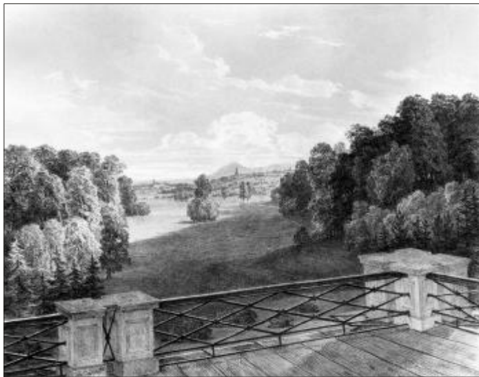
Sl. 4. Pogled s Vidikovca prema zapadu Fig. 4 View from the Vidikovac building westward