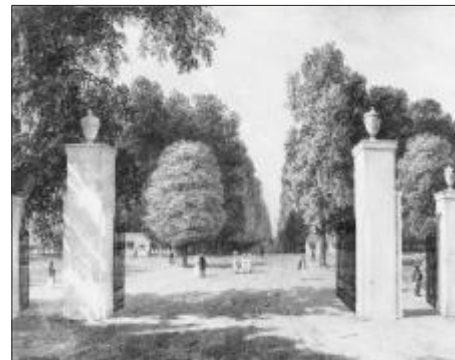
Sl. 1. Pogled s ulaza na glavnu aleju Fig. 1 Main alley, view from the entrance

Haulik tvrdi u citiranome navodu iz Parka Jurjavés da je Vrhovac zamislio perivoj u francuskom stilu. Do takve je ocjene došao nesumnjivo imajuæi na umu geometrijski pravilan oblik Vrhovèeve zvijezde s radialno postavljenim ravnim stazama, u njegovim oèima nespojivim s naèelima pejsažnog perivoja. I doista, takve pravocrtne oblike ne susreæemo u pejsažnom, engleskom perivoju, osim ponegdje u sluèajevima kada je perivoj nastao preu-