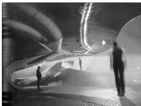
Sl. 3. Lars Spuybroek: Freshwater Pavilion Fig. 3 Lars Spuybroek: Freshwater Pavilion

Vodeni paviljon je prvi veliki, kompleksni, potpuno interaktivni trodimenzionalni okoliš ikada izveden. Objekt je koncipiran kao izložba vode na otoku Neeltje Jans u Nizozemskoj. To je permanentna struktura u kojoj ništa nije predvidljivo, nijedan presjek nije jednak i nijedan kut nije pravi kut. Vodeni je paviljon zapravo velik i spektakularan trodimenzionalni multimedijski umjetnički rad u kojem su forma i sadržaj intimno povezani. Struktura duljine oko 100 metara sastoji se od dva