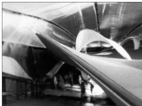
Sl. 4. Kaas Oosterhuis: Saltwater Pavilion Fig. 4 Kaas Oosterhuis: Saltwater Pavilion