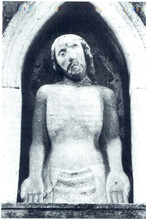
Stari Grad, crkva sv. Lucije, Imago Pietatis