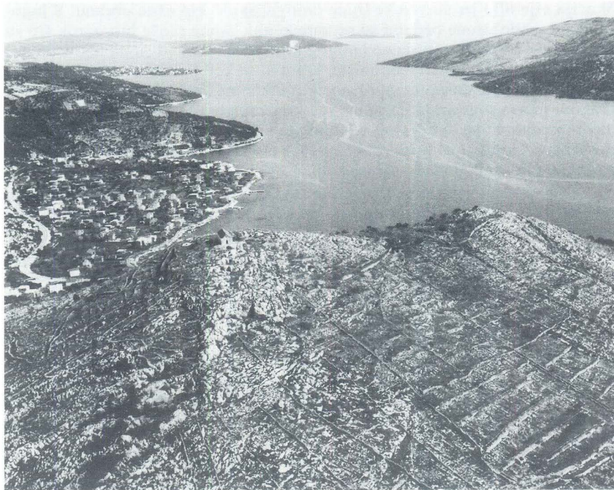
Zračni snimak Drida

Drid zapravo čine dva vrha smještena u pravcu sjeverozapad - jugo-istok. Veći sjeverozapadni zove se Veli vrh, dok se jugoistočni (po Jeliću), naziva Mali vrh.