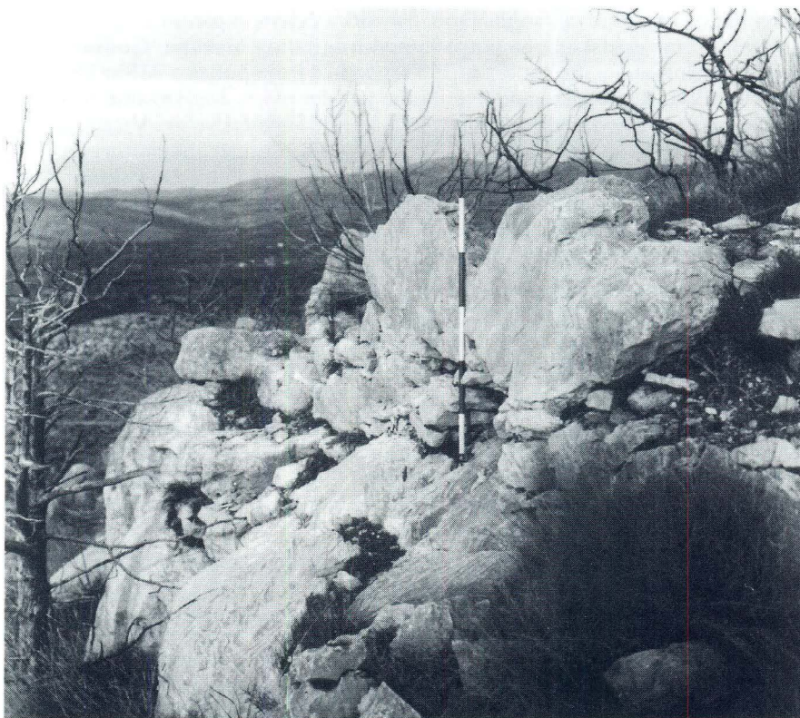
Jugozapadni kasnoantički bedem na Velom vrhu

središte starohrvatske županije, sredinom 12. st. i ranije u rukama hrvatskog plemstva. U dokumentima s kraja 11. st. spominju se i imena dridskih župana Osrine (Osrina Dridistici) 19 i Dragoslava (Dragoslao Dridistic). 20 Iako većina povjesničara smatra navedene dokumente falsifikatima, imena su se župana odnekuda morala preuzeti. Sadržaj samog dokumenta u ovom slučaju ne igra bitnu ulogu.