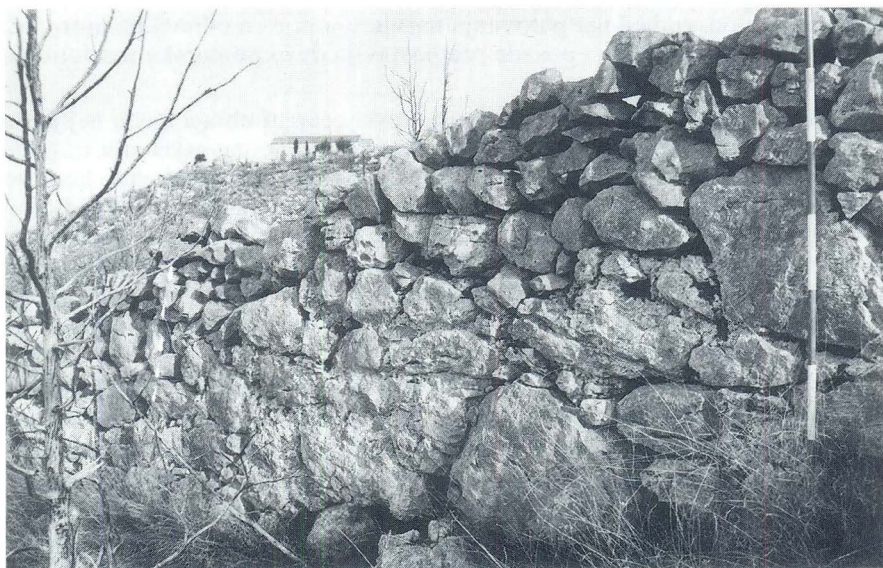
Dio bedema na Malom vrhu

Taj bedem je u jednom trenutku nadograđen na staru kasnoantičku utvrdu koju očito respektira, ali pri njegovoj izgradnji primjenjuje se potpuno drugačiji način gradnje. Bedemi vijugaju prateći konfiguraciju terena bez oštih lomova i bez kula; mort i način slaganja kamena su drugačiji. Izgleda da se više nije mogla doseći razina one kvalitete u izradi fortifikacija kojom je građen kasnoantički Drido. Ostaje pitanje je li se južna strana na Velom vrhu koristila kao drugi red bedema, odnosno je li po izgradnji kasnijeg donjeg trakta kasnoantička utvrda služila kao neka vrst akropole ili je njezin južni obrambeni zid nakon izgradnje kasnijeg bedema izgubio funkciju.