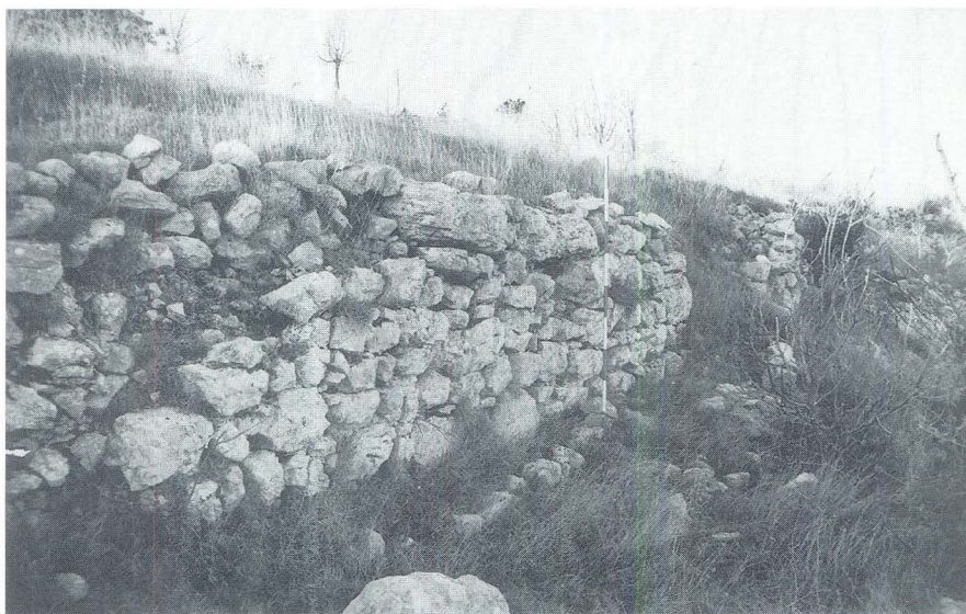
Sjeverni bedem na Velom vrhu

Cijeli je prostor između Velog i Malog vrha krševit, na njemu se ne zamjećuju nikakvi tragovi arhitekture. Eventualni ostaci nastambi mogli bi se očekivati tek u masliniku na istočnoj strani gdje se nalazi kraći trakt obrambenog zida, ili pak na zapadu, po sredini sedla, uz same bedeme gdje također postoji uži duguljasti plato.