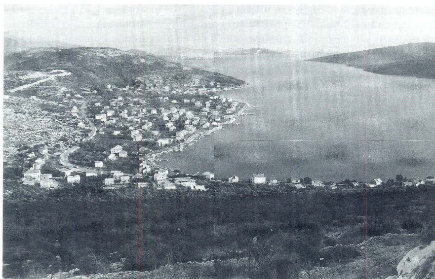
Pogled na uvalu s istočne strane Drida gdje je bila luka

Bosni i Hercegovini ranokarolinški metalni nalazi ukazuju na korištenje stare kasnoantičke utvrde Vrbljani na Sani u drugoj polovini 8. st. Vrbljani se ne razvijaju u kasnosrednjovjekovni utvrđeni grad, 27 već utvrda zadržava, kao i Drid, stari kasnoantički oblik.