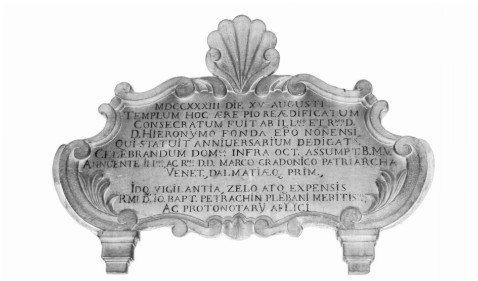
Natpis o posveti obnove crkve S. Fosca iz 1733. u kojemu se spominje ninski biskup Jeronim Fonda