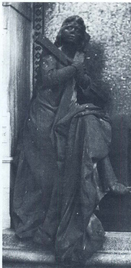
I. Rendić, "Vjera" sa nadgrobnog spomenika obitelji Katalinić

ture je Rendić bio izradio 1897. godine i postavio ju je, odlivenu u bronci, na grobnici Emanuela Pristera pod arkadama zagrebačkog groblja Mirogoja iste 1897. godine. Skulptura je visoka 170, a široka 120 cm. Drugi je put odlio alegorijsku skulpturu "Meditacije" 1908. za nadgrobnog spomenik splitskog načelnika Vicka Mihaljevića, postavljen na Sustipanskom groblju ljeti 1909. godine. Kompozicija čitave grobnice bila je jednostavna, a sjedište od crnog i crvenog granita pridonosilo je skulpturi. Nenametljive su bile brončane aplike secesijskog stila. Ukupna veličina grobnice bila je 310 x 326 cm. Rastavljena je i uništena 1961., a skulptura se nalazi na novom groblju, kod mrtvačnice. Tu je skulpturu Rendić još jednom odlio i postavio oko 1908. na grobnicu obitelji N. Colombisa na tršćanskom groblju. 3