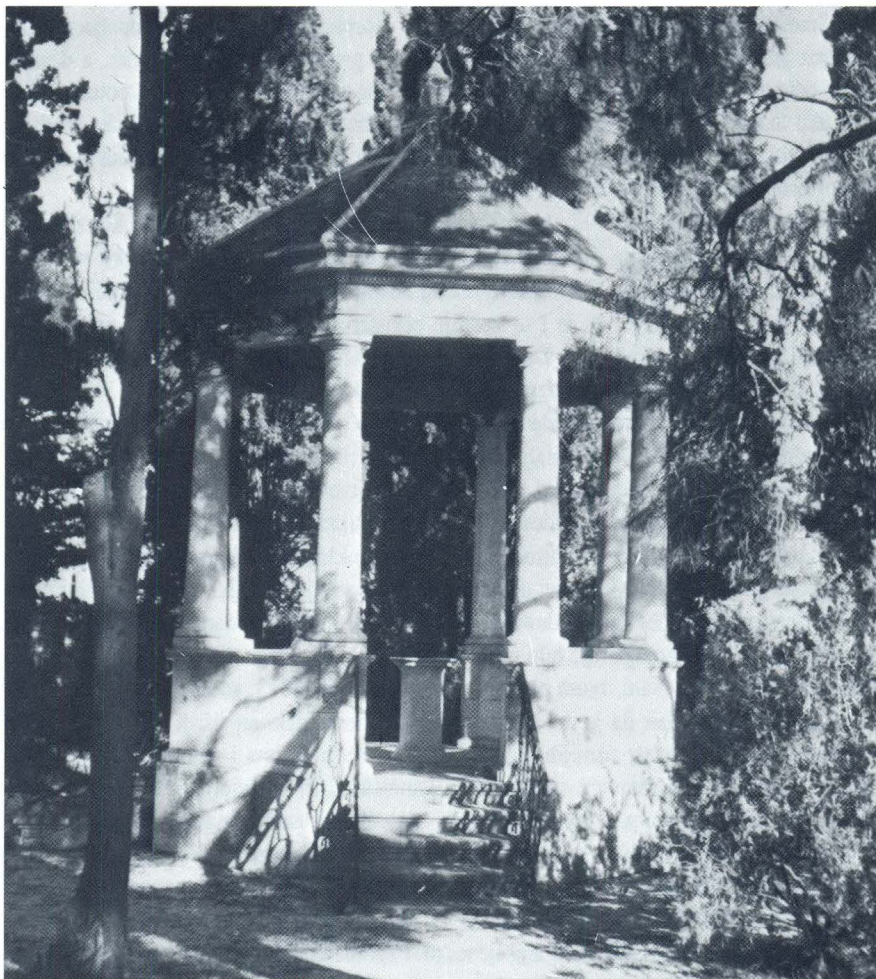
V. Andrić, Klasicistički paviljon

Postoji još jedan posredni dokaz o Andrićevom autorstvu tog klasicističkog paviljona. 14 Među ranim studentskim projektima što ih je mladi Andrić donio iz Rima nakon studija postoji i jedan projekt malog okruglog paviljona, "Tempio rotondo", iz 1815., koji općim izgledom odgovara onome sustipanskom. Iako je taj paviljon bio kružnog tlocrta, a sustipanski je šesterostran; iako je prvi predviđao stupove u cijeloj visini, a drugi kraće na zidanoj ogradi; iako je prvi imao kupolasti krov, a drugi šatorasti, opća zamisao minijaturnog antičkog hrama centralnog tlocrta, okruženog dorskim stupovima i jednostavnim vijencem nad njim, je istovjetna.