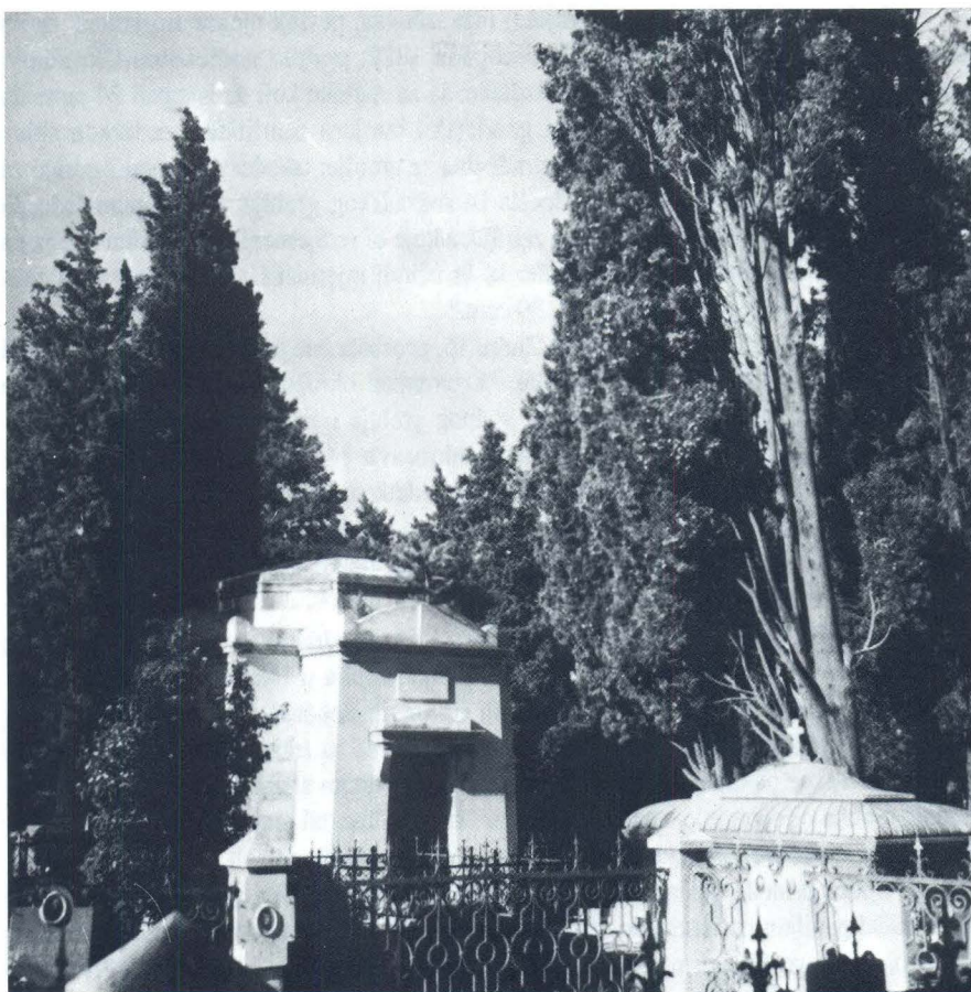
Mauzolej obitelji Micheli-Vitturi

Od grobljanske arhitekture većih dimenzija postojale su na Sustipanu samo tri sepulkralne spomeničke građevine. Prva je bila lijepi klasicistički središnji paviljon koji sam pripisao arhitektu Vicku Andriću.