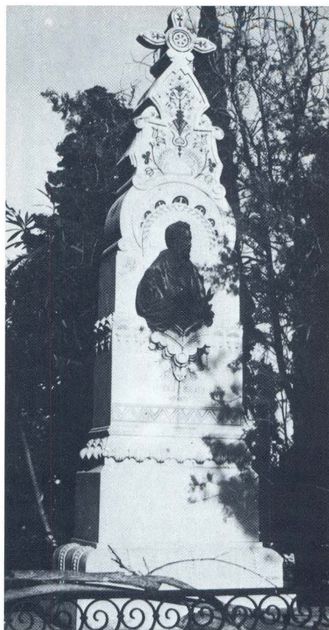
I. Rendić, Nadgrobní spomenik Gaje Bulata

Skulptura koja je privlačila pažnju posjetitelja Sustipanskog groblja bio je alegorijski lik u kamenu sjedeće žene s lubanjom u ruci na grobnici obitelji Nikolić. Taj je nadgrobní spomenik postavila kapetanu Visoinu njegova udovica, rođena Nikolić, 1907. godine. Rad je splitskog kipara i ebaniste Šimuna Carrare (1864.-1933.), koji je i sam bio pokopan na tome groblju. Iako je Carrara bio poznat po svojim sitnim, minuciozno izvedenim radovima u slonovoj kosti, kao i rezbarijama u drvu, ova skulptura prirodne veličine, isklesana u mramoru, odaje vrsnog kipara i izdiže se nad stereotipnim grobljanskim skulpturama klesarskih radionica. Zamišljeni lik djevojke što promatra mrtvačku lubanju i razmišlja o smrti realistički je izveden i nije zašao u banalnu romantiku, kako bi se od takvog motiva moglo očekivati. Figura je bila čak vrlo dobro uklopljena u arhitekturu čitavog nadgrobnog spomenika s kamenim postamentom i visokom stelom s križem u pozadini. Signatura na postamentu bila je: S. CARRARA, Danas se skulptura (bez ruke i lubanje koje je netko