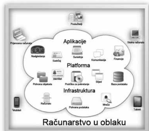
Slika 1. Računalstvo u oblaku.