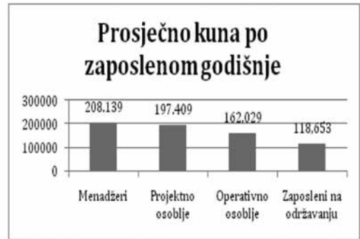
Grafikon 2. Prosječni troškovi po zaposlenom u Hrvatskim šumama d.o.o. za svaku funkciju informacijske podrške

Operativno osoblje i zaposleni na održavanju predstavljaju 71% od ukupno zaposlenih na poslovima vezanim uz ICT i 62% od ukupnih troškova osoblja što je vidljivo iz grafikona 3.