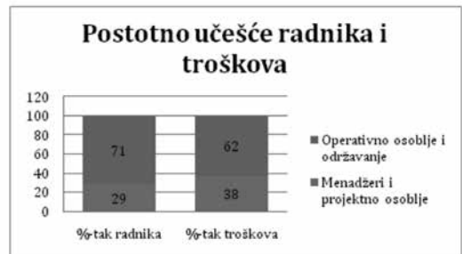
Grafikon 3. Odnos između zaposlenih na održavanju i operacijskim osobljem i menadžera s projektinim osobljem u Hrvatskim šumama d.o.o.

Upravo se na operativnom osoblju i osoblju koje radi na održavanju ICT-a mogu očekivati znatne uštede na troškovima korištenjem računalstva u oblaku. No, prelazak na rad u oblaku istodobno povlači i veće djelovanje menadžmenta i projektinoga osoblja na razvijanju novih poslovnih programskih aplikacija.