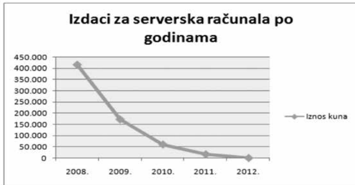
Grafikon 1. Izdaci za poslužiteljska računala po godinama od 2008. do 2012. godine u Hrvatskim šumama d.o.o.

Planirani troškovi licenci za aplikativna program-ska rješenja u 2013. godinu iznose 7.166.239 kuna, odnosno ako se vrijednost licenci za programska aplikativna rješenja podjeli s 2157 računala dobiva se izdatak od 3322 kune po računalo.