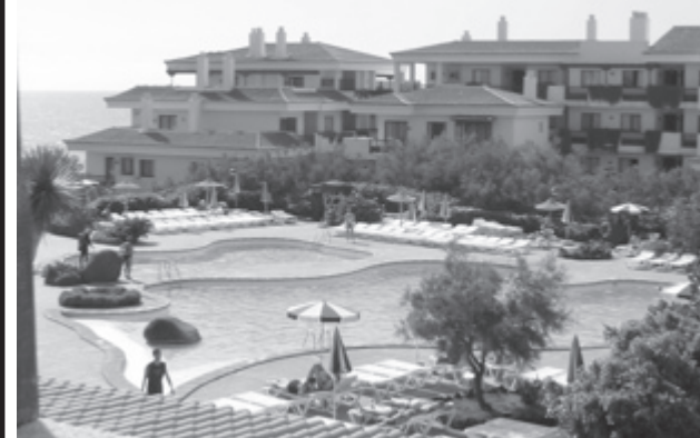
Hotel u kojem smo bili smješteni

Skroz zadnji odlomak: unatoč tome što se iz napisanog može štošta zaključiti, nemojte steći krivi dojam; mi volimo našeg čerčila i njegove podanike. ☹