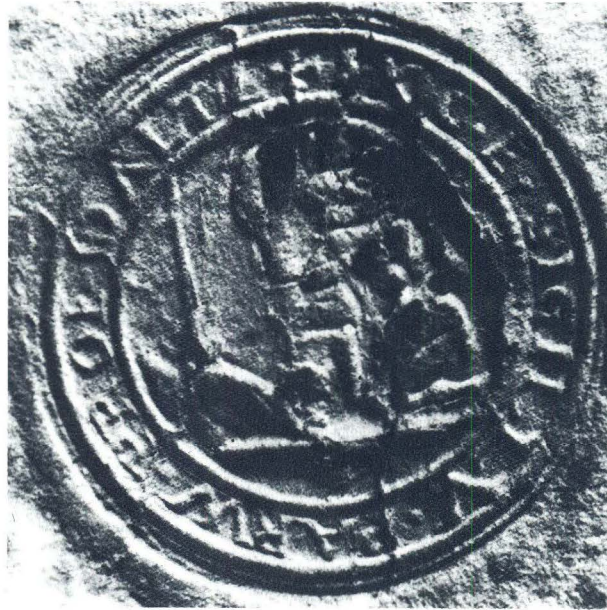
Vodeni pečat ispod prov. JakomeĹovića: oko Sv. Jerolima u spilji natpis: HOC. E(st). SIGILLV um). PARVV (m). PRO (vincia) E. DAL (ma) TI (ae)

Povijest picokara u hrvatskim zemljama još je gotovo netaknuta. Međutim, možemo pretpostaviti da se i u našoj sredini picokare javljaju nakon dolaska i učvršćenja prosjačkih redova, osobito franjevac i dominikanaca, već u 13. stoljeću, a naročito u važnijim središtima na Jadanu: Zadru, Trogiru, Splitu i Dubrovniku.