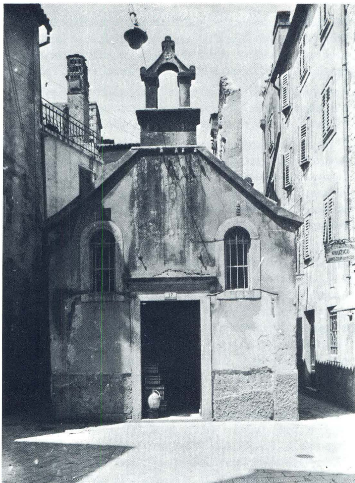
Crkvice sv. Ciprijana prije rušenja 1928. g.

temeljio na Pravilu trećega reda sv. Franje, a to je u našem slučaju Drugo pravilo koje je 19. kolovoza 1289. godine izdao prvi papa - franjevac Nikola IV. (1288.-1292.) 67 i koje je ostalo na snazi gotovo 600 godina, tj. do 1883. kada je papa Leon XIII. (1878.-1903.) za franjevački treći red propisao Treće pravilo.