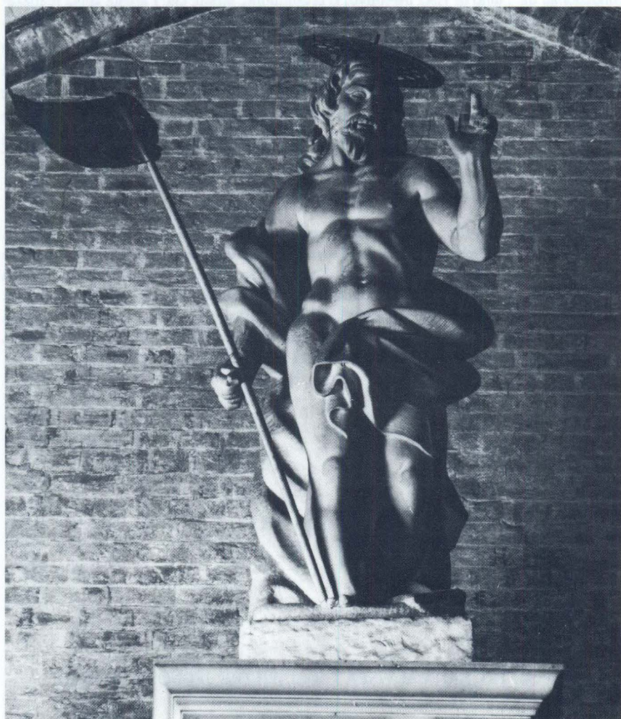
Bernardo Falconi, Redentore, Venezia, Basilica dei Frari, Altare di S. Antonio