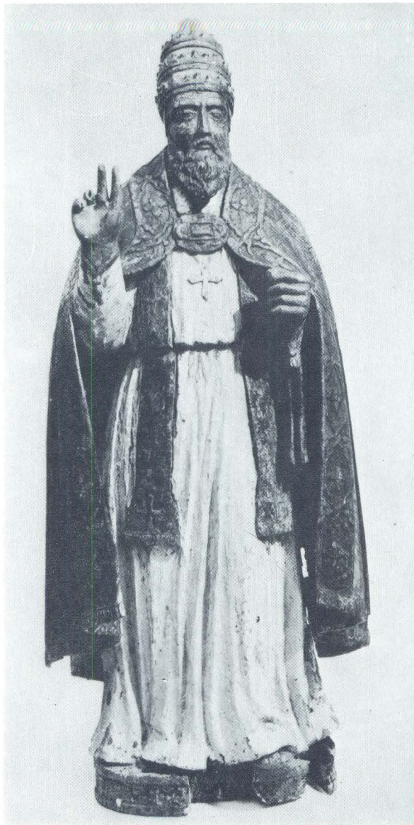
Franjo Čučić, Sv. Silvestar iz crkve sv. Silestra na Biševu

ljeća prema zapisu o pohodu biskupa Georgi 1637. 20 Opisujući crkvu sv. Silvestra F. Radić kaže da ona završava polukružnom apsidom, koja je zidom rastavljena od crkvene lađe i služi kao riznica. 21 To zatvaranje apside vezano je za podizanje oltara, što je uslijedilo kra-