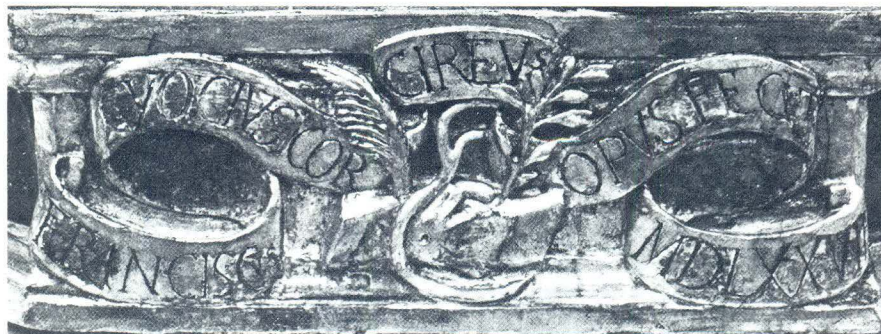
Potpis Franje Čučić na kipu sv. Roka iz Korčule

iscisisjelitelja, sv. Kuzme i Damjana. Nad njima u prostoru atike je Bogorodica s Djetetom na prijestolju, pored koje su lebdjeli anđeli, a u prostoru zabata na oblacima je lebdio Bog Otac raskriljenih ruku. U 18. stoljeću oltar je rastavljen i zamijenjen mramornim, a Čučićevi kipovi su postavljeni u niše među stupovljem. 7