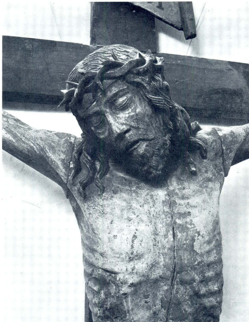
Franjo Čučić, Raspelo iz župne crkve u Pučišćima

Za veliko raspelo, koje je resilo bočni oltar, oduvijek se smatralo da je pripadalo ranijem inventaru, te ga se u skladu s odlikama kasne gotike i rane renesanse pripisivalo kasnom 15. stoljeću. Međutim, uspoređujući ga s kipom sv. Jerolima, te s fizionomijom sv. Roka u Korčuli ili sv. Petra u Omišu, očigledan je isti način oblikovanja koji prepoznajemo kao Čučićev rukopis. Kristovo tijelo (vis. 150 cm) je pribijeno na križ, u vrhu kojeg je titulus s natpisom INRI. Blago nagnuto prema naprijed, ima široko raskriljene ruke s napetim venama i zgrčenim prstima. Poput lika sv. Jerolima, naturalistički je obrađen toraks s uvučenim trbuhom i naglašenim rebrima. Glava sa spiralnim uvojcima počiva na desnom