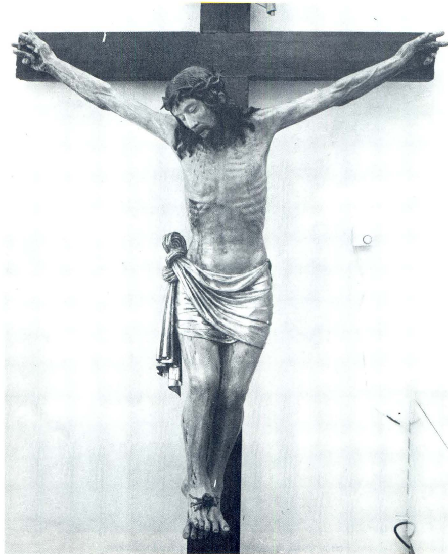
Franjo Čučić, Raspelo iz župne crkve u Pučišćima, nakon restauracije

ramenu okrunjena trnovom krunom. Kratke i snažno modelirane noge, jednim su čavlom pribijene na preklopljenim stopalima. Preko bokova je prebačena zlatna perizoma s plavom postavom i s dvostruko isprepletenim čvorom. Taj isti stilizirani detalj nalazi se na pojasu kipa sv. Mihovila u Omišu te kod lika sv. Ivana Krstitelja s Biševa, kojeg također pripisujem istom drvorezbaru. Gotovo idealizirano lice sivoružičasta inkarnata, s istaknutim