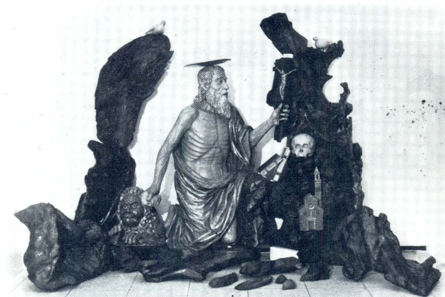
Franjo Čučić, Oltar sv. Jerolima iz župne crkve u Pučišćima na Braču

statičnu skulpturu oltara u arhitektonskoj niši, već joj stvara scenografski ambijent poput isječka iz crkvenog prikazanja. Čvornato i slojevito drvo sugerira okružje pećine, svijajući se prirodno poput edikule. Svetac u klečećem stavu stoji pred raspelom u zanosu pokajanja i molitve. U lijevoj ruci drži raspelo, a u desnoj kamen kojim se udara u prsa. Pored njega u pećini su lubanja i knjiga te model pučiške crkve, čiji je zaštitnik, do sveca je njegov vjerni pratilac lav i tri golubice koje su sišle na pećinu. Na ovom oltaru Čučić dostiže snažnu ekspresivnost u modeliranju isposnikova torza, detaljno obrađuje istaknuta rebra i mršave, žilama izbrazdane ruke. Ispijeni obrazi s opuštenim ustima starca obasjani su zažarenim pogledom na raspelo. Sjeda kosa i brada spuštaju se u dugim povijenim uvojcima. Ogrnut je zlatnim plaštem, te se svijetla figura ističe posebnim ozračjem u tami pećine. 12 Prilikom pohoda apostolskog vizitatora Augustina Valiera Pučišćima 1579.