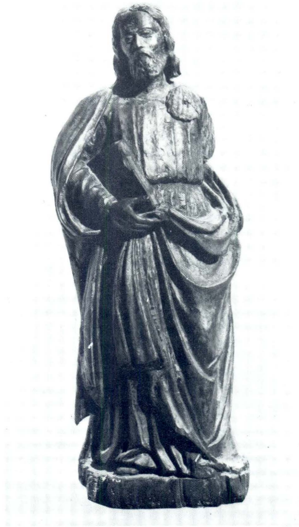
Franjo Čučić, Sv. Jakov, Opatska zbirka, Korčula

Bogorodica na tronu (vis. 63 cm) izrađena je samo do visine koljena, jer je kip bio namijenjen uzdignutom mjestu na gornjem dijelu oltara. Lagano priklanja glavu prema Isusu kojeg pridržava na desnoj strani. Uspravno golo Dijete desnicom blagoslivlja. Iznad gusto nabrane zlatne haljine Gospa ima prebačen tamnozeleni plašt sa zlatnim porubom koji u mekim valovima uokviruje nježni oval lica. Na ružičastom inkarnatu ističe se grafizam lučno spojenih obrva. Budući da je po impostaciji slična Bogorodicama kasnog Quattrocenta, poglavito produktima regionalnih škola oltarne skulpture, bila je i datirana u