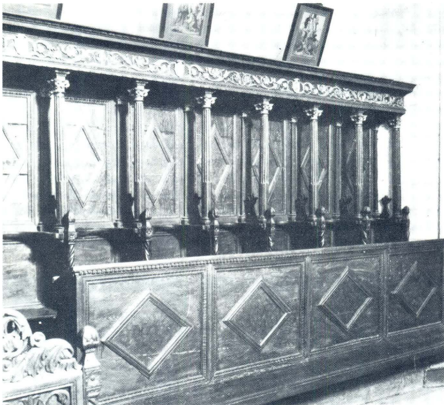
Hvar, Korska sjedala u Franjevačkoj crkvi

jagodicama, lučno razvedenim obrvama i tankim usnicama, lišeno je gotičke bolne grimase. 15