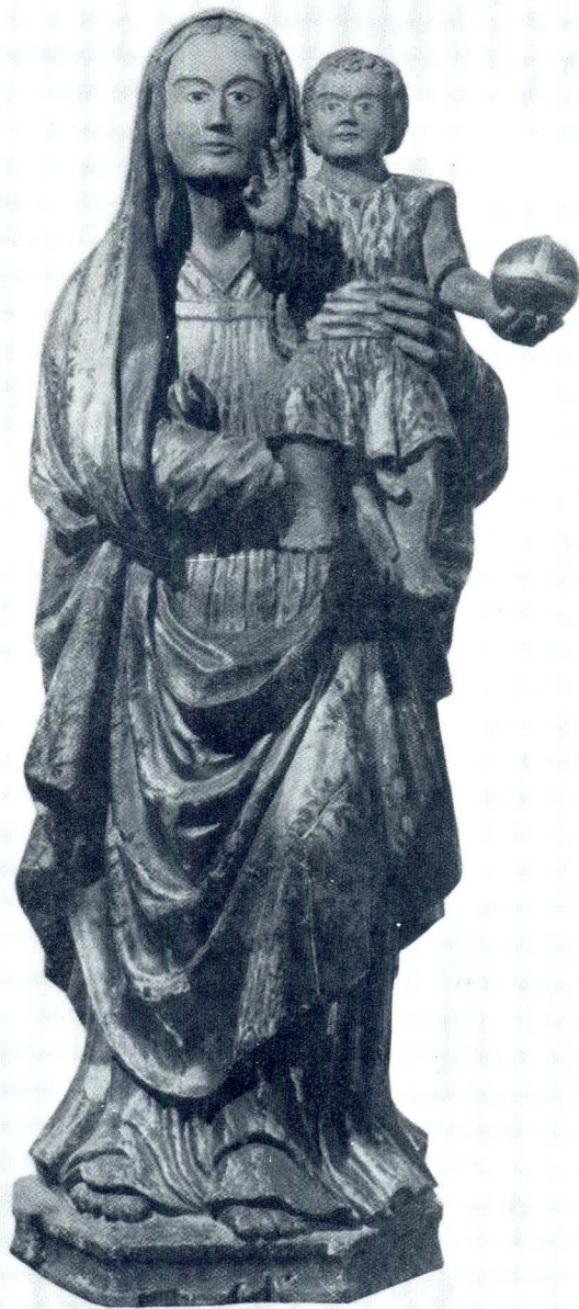
Franjo Čučić, Bogorodica s Djetetom, Omiš, župna crkva