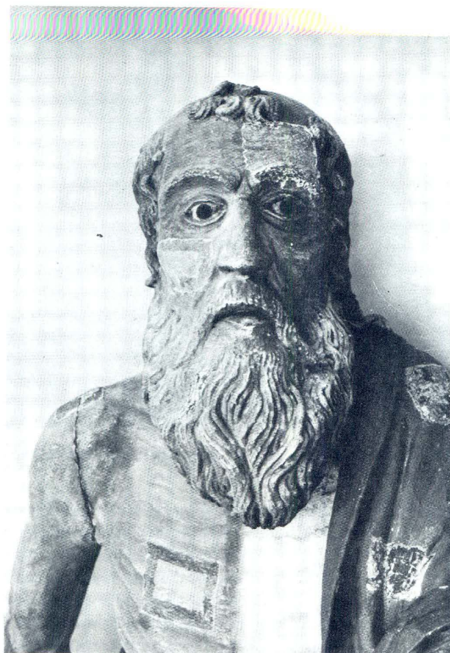
Pučišća, Župna crkva, Lik sv. Jerolima u toku popravka

godine, dakle neposredno nakon izrade glavnog oltara, još nisu bili pozlaćeni ni kip sv. Jerolima ni ostali kipovi svetaca nepoznata imena. Pored glavnog oltara sv. Jerolima, crkva je imala još četiri bočna oltara, ali bez naslova i bez pale. 13 Vjerojatno su do 1614. godine, kada je župnu crkvu posvetio biskup Cedulin, bili izrađeni i ostali oltari, poput oltara sv. Roka s palom Palme Mlađeg i oltar sv. Ante. 14