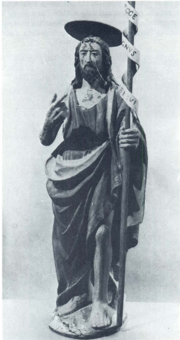
Franjo Čučić, Sv. Ivan Krstitelj iz crkve sv. Silvestra na Biševu

jem 16. ili na početku 17. stoljeću. Nekadašnja drvena arhitektura oltara vjerojatno je u novije vrijeme zamijenjena zidanim stupovima koji formiraju niše za kipove. Središnje susjednom otočiću Biševu, SHP II, br. 3, Knin 1896., 157.