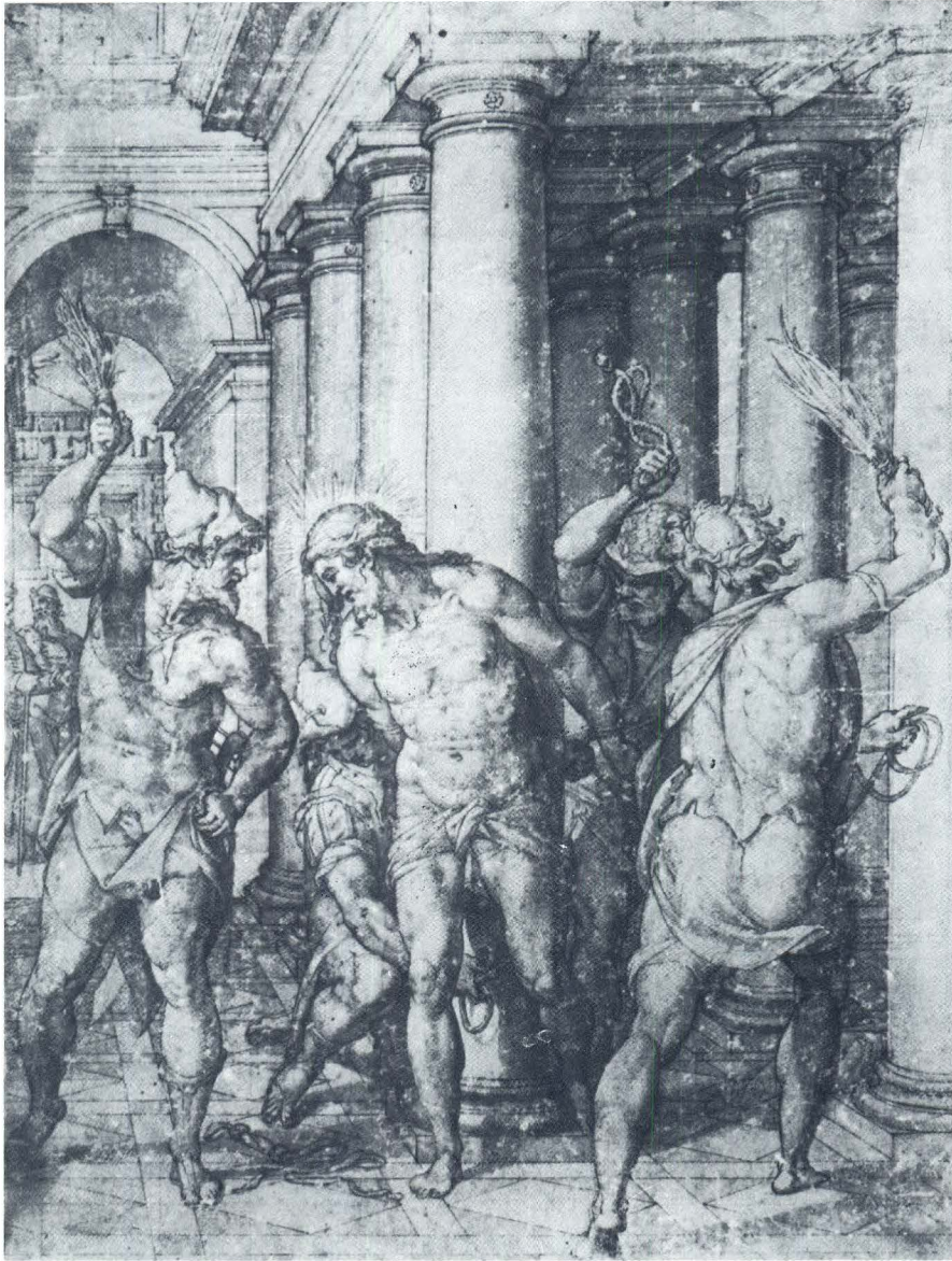
Orazio Samacchini, Bičevanje Krista, crtež, Rijksmuseum, Amsterdam