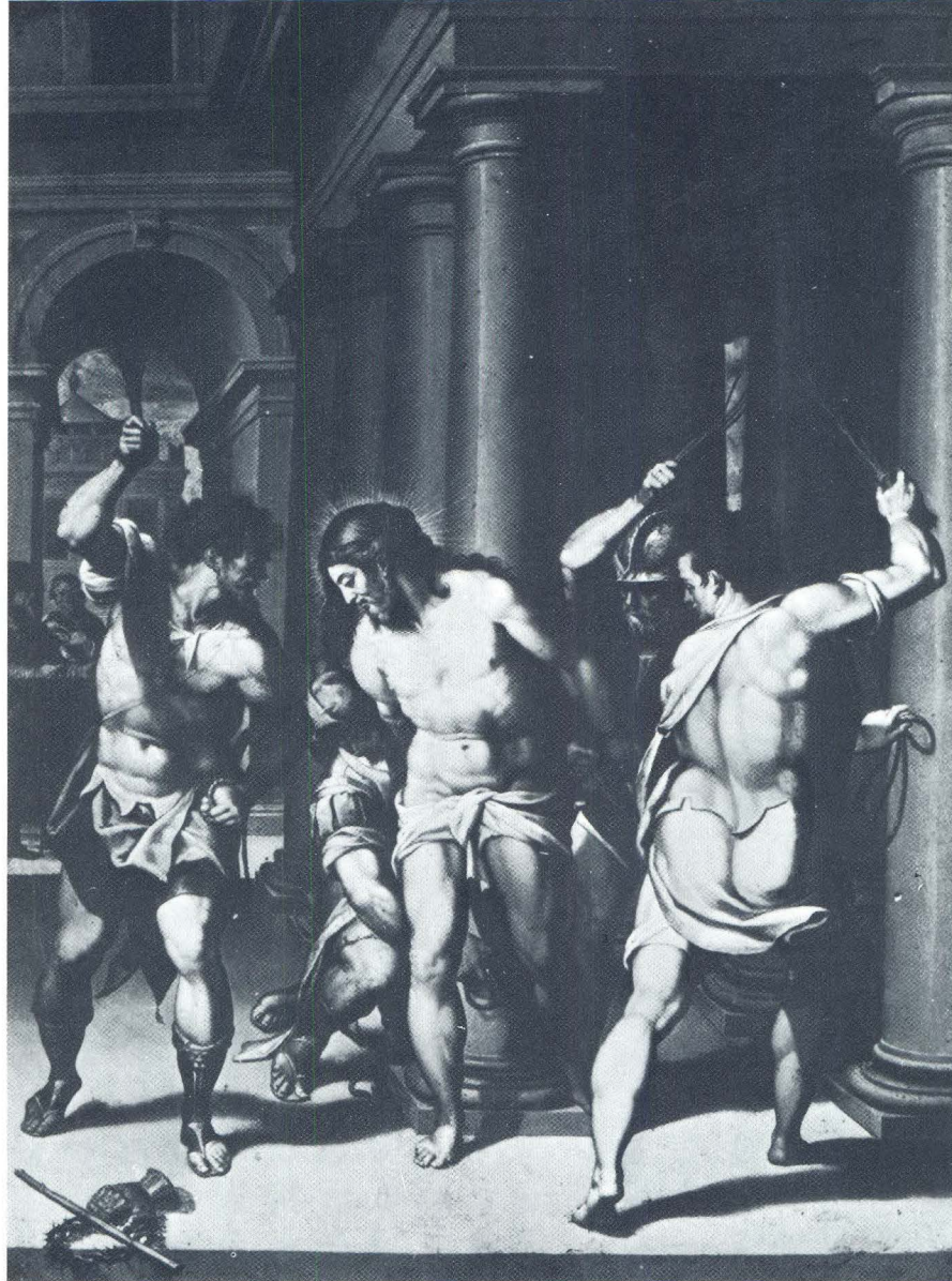
Orazio Samacchini, Bičevanje Krista, Galerija M. Simpson, London