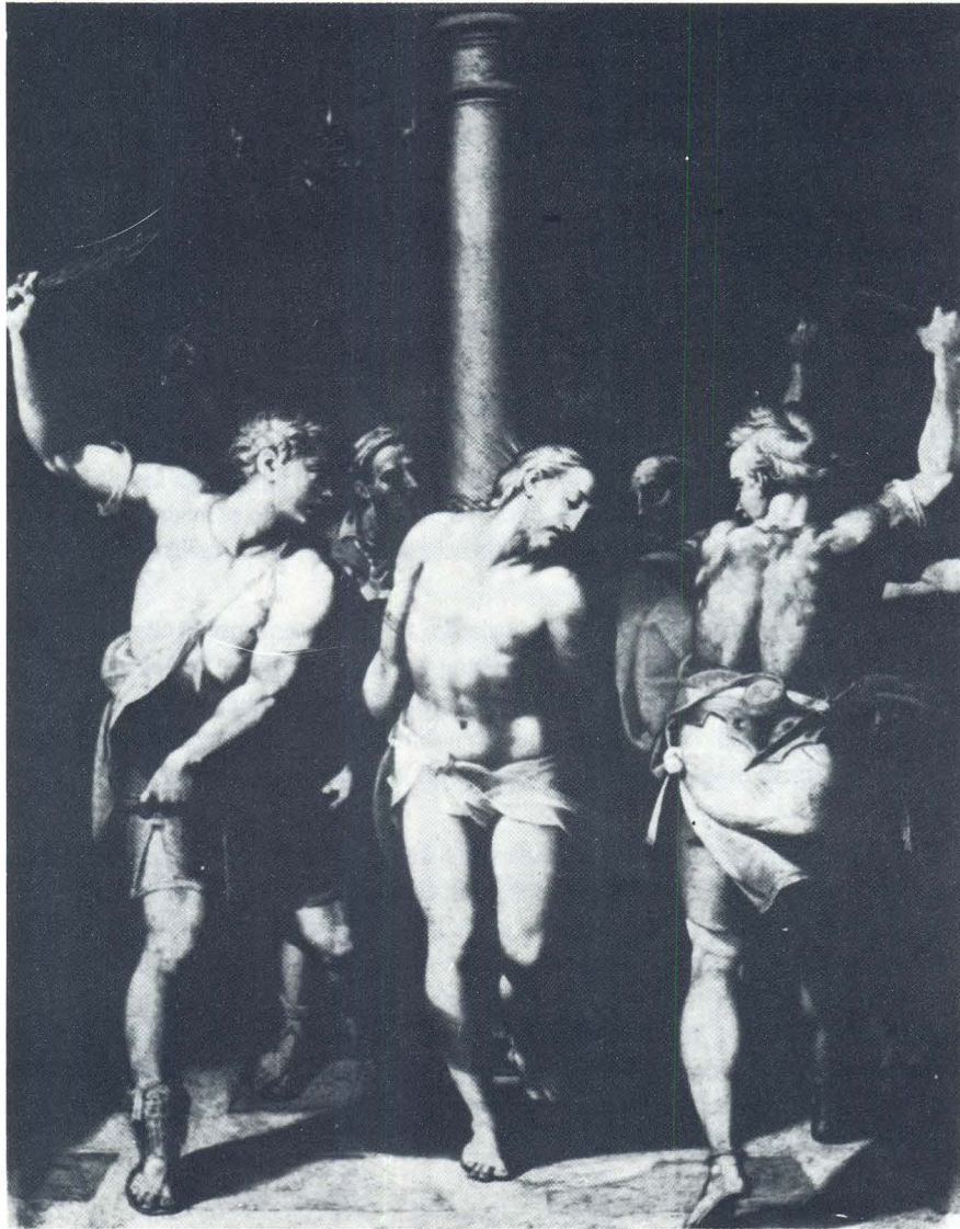
Orazio Samacchini, Bičevanje Krista, S. Salvatore, Bologna