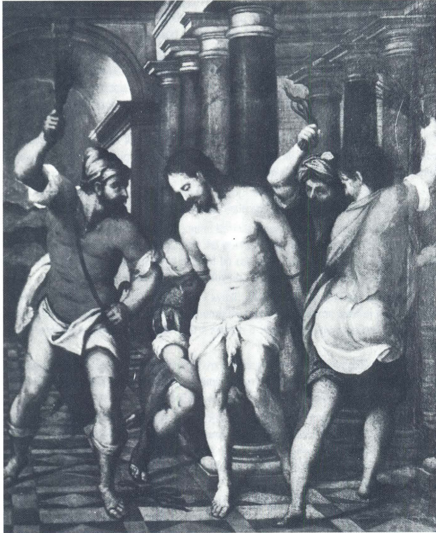
Bičevanje Krista, emilijanska maniristička škola, Stalna izložba sakralne umjetnosti u Zadru