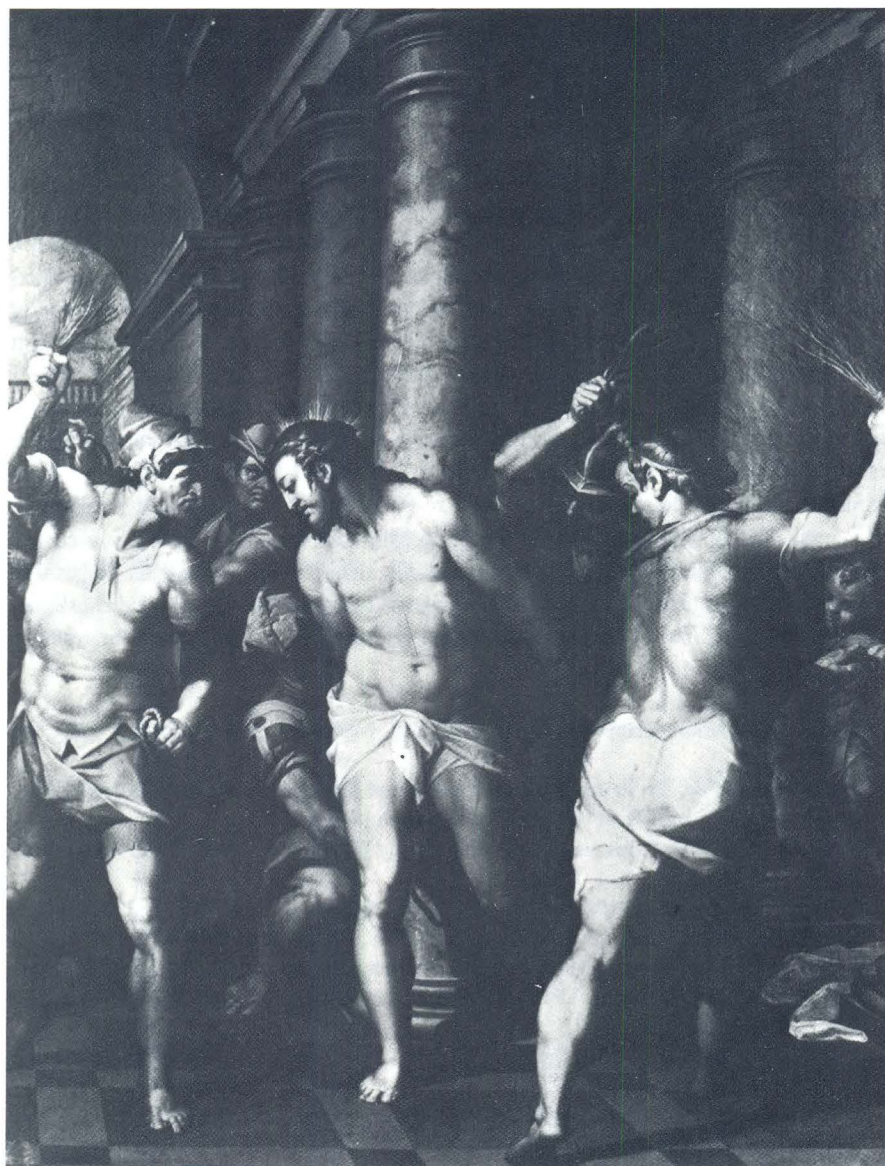
Denis Calvaert, Bičevanje Krista, Galerija Borghese, Rim