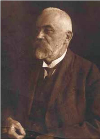
3 Josip Brunšmid

Josip Brunšmid