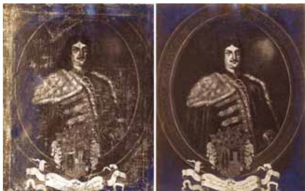
6 Fotografije portreta Petra Zrinskoga prije i poslije Goglijina restauratorskog zahvata

Photographs of the triptych from the demolished church of St Fabian and Sebastian in Novi Vinodolski prior, during and after Goglia's restoration interventions