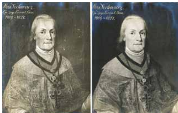
7 Fotografije portreta Maksimilijana Vrhovca prije i poslije Goglijina restauratorskog zahvata (arhiv Arheološkog muzeja u Zagrebu)

Photographs of the portrait of Petar Zrinski before and after Goglia's restoration interventions (archives of the Archaeological Museum in Zagreb)