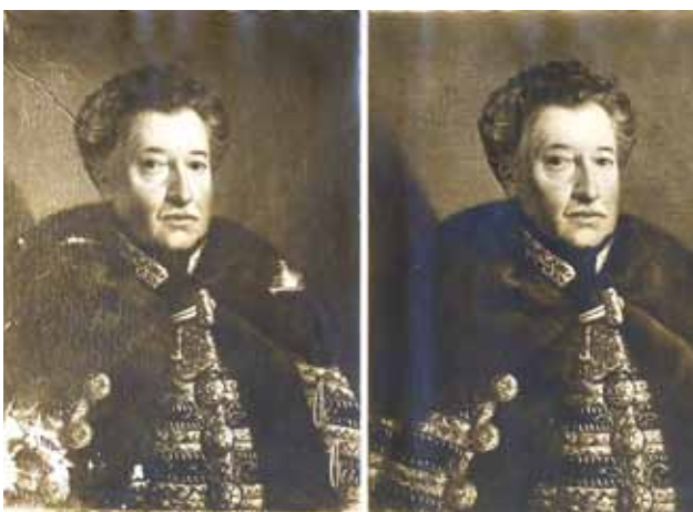
12 Fotografije portreta Nikole Zdenčaja Zahromićgradskog prije i poslije Goglijina restauratorskog zahvata

Photographs of the portrait of Bishop Josip Galliuff before and after Goglia's restoration interventions