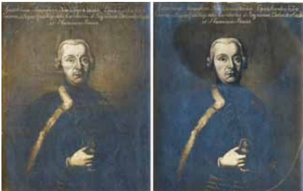
10 Fotografije portreta Adama Najšića prije i poslije Goglijina restauratorskog zahvata

Photographs of the portrait of Bishop Emerik Karl Raffay before and after Goglia's restoration interventions