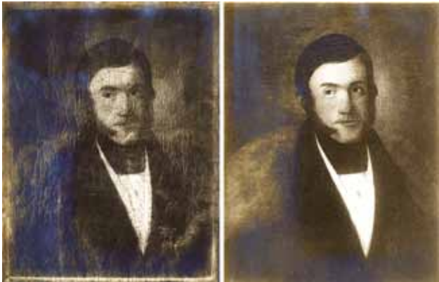
8 Fotografije portreta Franje Vjekoslava Kružića Kliškog prije i poslije Goglijina restauratorskog zahvata

Photographs of the portrait of Franjo Vjekoslav Kružić Kliško before and after Goglia's restoration interventions