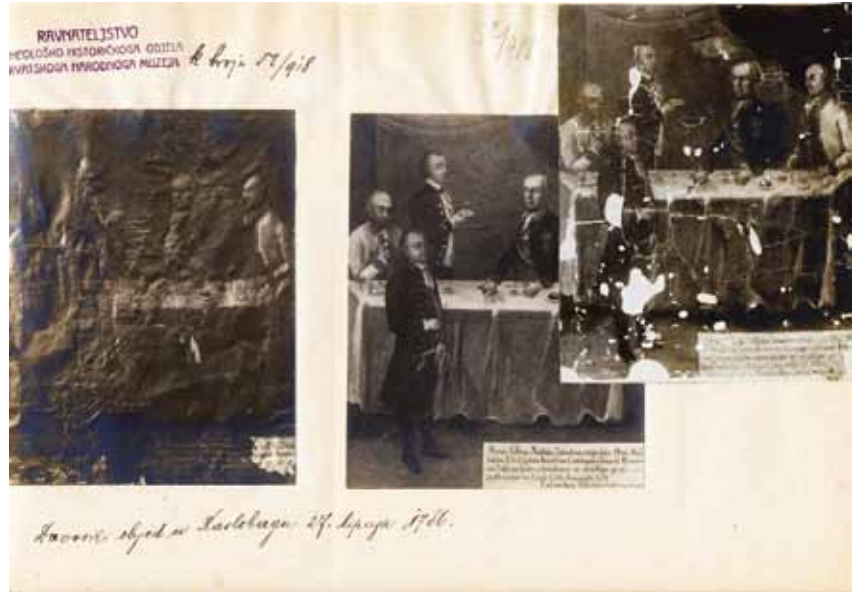
4 List papira iz arhiva Arheološkog muzeja u Zagrebu s fotografijama slike Dvorski objed u Karlobagu 27. lipnja 1786. prije, nakon i u tijeku Goglijina restauratorskog zahvata

Josip Brunšmid (archives of the Archaeological Museum in Zagreb)