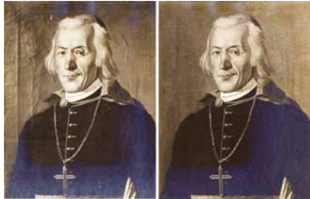
9 Fotografije portreta biskupa Emerika Karla Raffajja prije i poslije Goglijina restauratorskog zahvata (arhiv Arheološkog muzeja u Zagrebu)

Photographs of the portrait of Franjo Vjekoslav Kružić Kliško before and after Goglia's restoration interventions (archives of the Archaeological Museum in Zagreb)