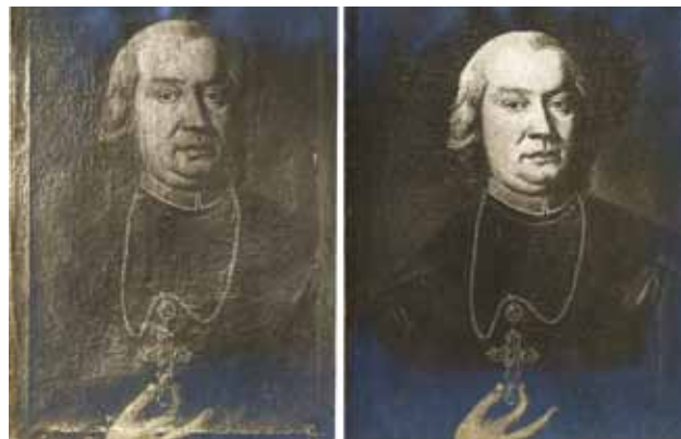
11 Fotografije portreta biskupa Josipa Galliuiffa prije i poslije Goglijina restauratorskog zahvata (arhiv Arheološkog muzeja u Zagrebu)

Photographs of the portrait of Adam Najšić before and after Goglia's restoration interventions (archives of the Archaeological Museum in Zagreb)