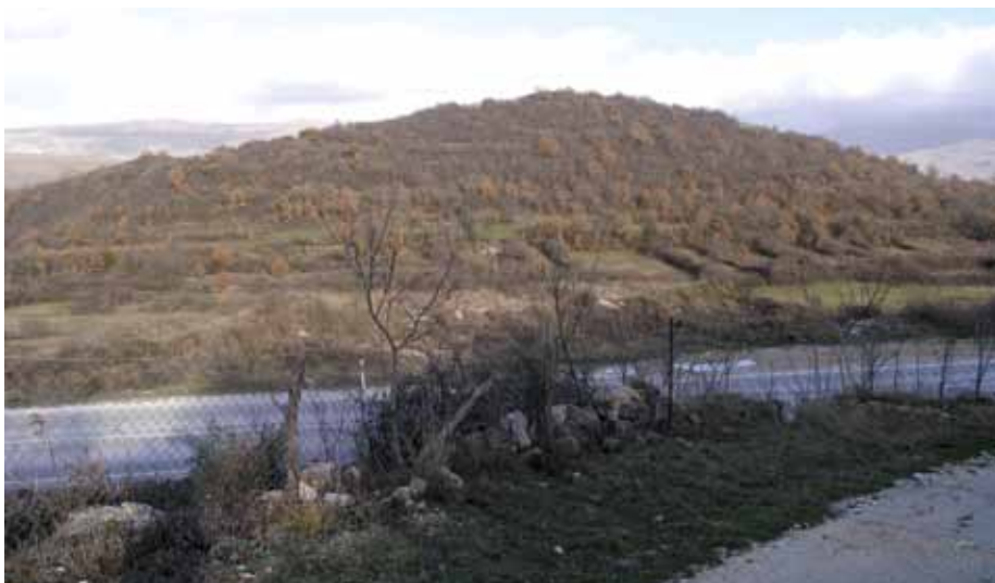
9 Pogled na Balinu glavicu iz smjera Umljanovića

View of Balina Glavica from the direction of Umljanović