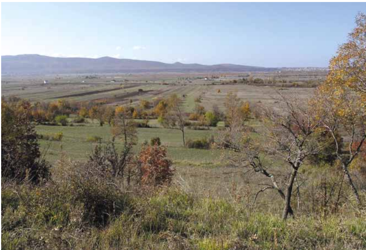
3 Pogled na prostor kaštela i Petrovo polje Position of the auxiliary castellum and Petrovo polje