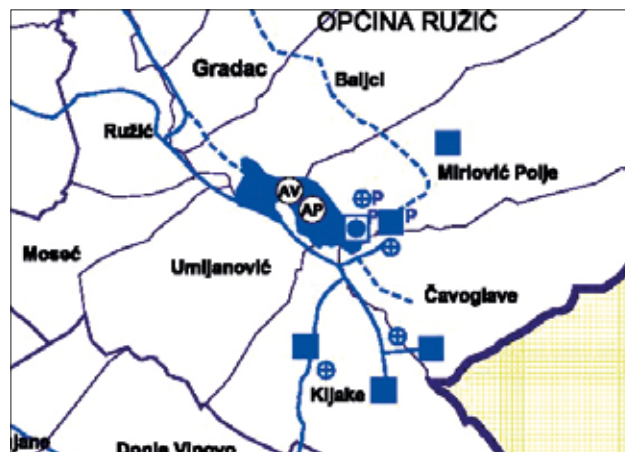
12 Detalj Prostornog plana Šibensko-kninske županije s pozicijom hidroakumulacije podno Baline glavice (priredio: I. Glavaš)

Detail of the physical plan of the Šibenik-Knin County with the position of the archaeological zone Umljanović (prepared by: I. Glavaš)