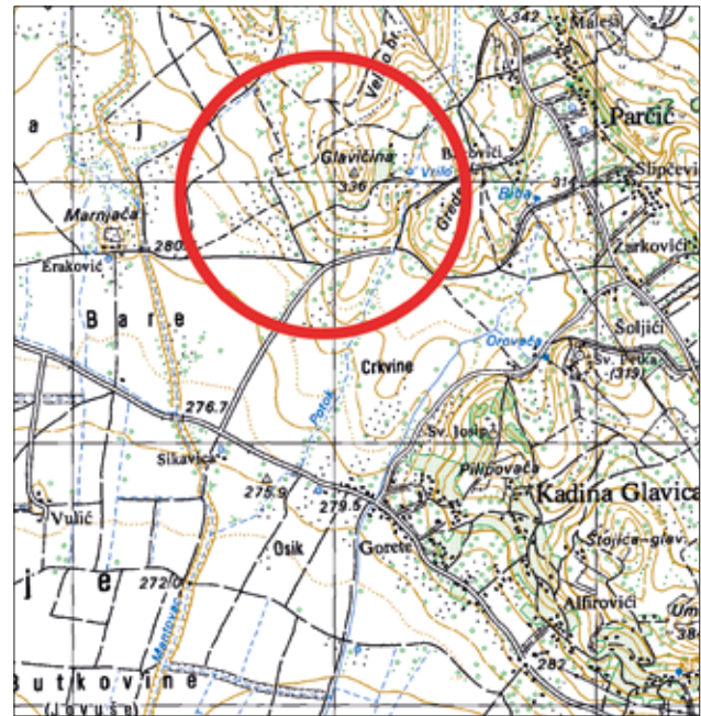
2 Pozicija augziliarnog kaštela na topografskoj karti M=1:25000 Position of the auxiliary castellum on the topographic map M=1:25000

općina Parčić. 3 Dimenzije prostora su približno 200 x 200 metara što čini površinu od 4 hektara. 4 Mjesto na kojem se nalazi pretpostavljeni castellum predstavlja blagu padina podno uzvisine Glavičina (kota 336) s koje se pruža pogled prema Drnišu i Petrovom polju (sl. 3). Strateške kvalitete lokacije su evidentne: zahvaljujući smještaju na blagoj uzvisini prostor nije nikad poplavljen, a posve je pregledno Petrovo polje i planina Promina na sjeverozapadu. Unutar pretpostavljenog prostora logora pomoćnih postrojbi teren je podijeljen na nekoliko horizontalno položenih parcela u smjeru istok-zapad, dok se izvan ovog prostora parcele nižu u pravcu sjever-jug. Uočavaju se različite nepravilnosti na tlu i bojama niske vegetacije koje su posljedica postojanja arhitekture ispod površine. Prostor je odijeljen stepenastim nasipima od okoline, a na nekim rubovima parcele, osobito na istočnoj strani pružaju se kamene suhozidne gomile nastale raščišćavanjem obradive zemlje ispod kojih se mogu pretpostaviti stariji zidovi (sl. 4). Rubovi parcele gotovo sigurno odgovaraju perimetru obrambenog bedema. Na istočnom rubu nalaze se ostaci objekta zidanog kamenim klesancima povezanim vapnenim mortom, koji nije iz rim-