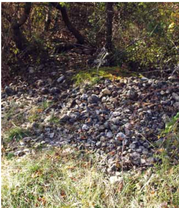
4 Kamene gomile na pravcu pružanja obrambenog bedema Stone heaps extending along the defensive wall

Dalmacije bila još uvijek slabo uznapređovala. 5 Dakle, logor pomoćnih postrojbi u Kadinoj Glavici mogao je osiguravati segment glavnog magistralnog prometnog pravca Akvileja-Dirahij i sve ostale prometne pravce koji su išli ovim prostorom. 6 Dio magistrale od Burna do Andetrija na kojem se nalazi logor pomoćnih postrojbi u Kadinoj Glavici izgrađen je najkasnije u Augustovo vrijeme. 7 Kako je glasilo ime logora u Kadinoj Glavici? Vrlo vjerojatno Promona prema imenu lokalne peregrinske zajednice centar koje je pagus obližnjeg municipija u Magnu. 8 Za tu analogiju imamo potvrdu i u nazivu samog legijskog logora u Burnu koji je ime dobio po središtu peregrinske zajednice Burnista. Za razliku od Burna koji je najkasnije za vrijeme Hadrijana dobio municipalni