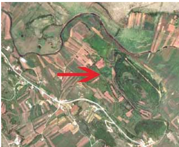
10 Satelitski snimak centra municipija Magnum s pozicijom beneficijarske stanice (preuzeto s: Google Earth) Satellite image of the centre of the Municipium Magnum with the position of the beneficiarii station (taken from: Google Earth)