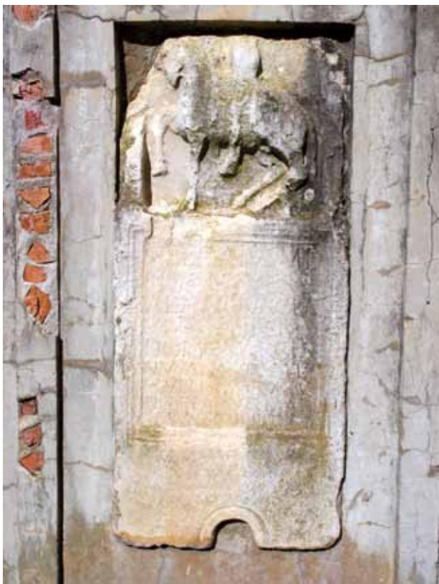
7 Stela Verkaja, konjanika ale Klaudivje nove

Stella of Vrkaja, cavalryman of the Claudius nova cavalry unit