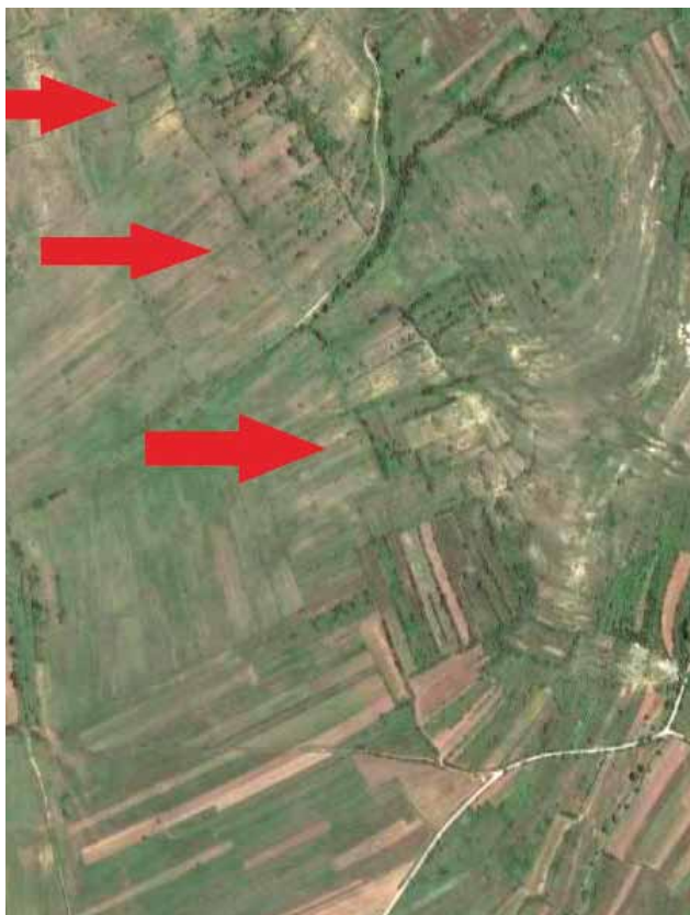
5 Satelitska snimka trase rimske ceste koja izlazi iz kaštela

Satellite image of the Roman road route existing from the castellum