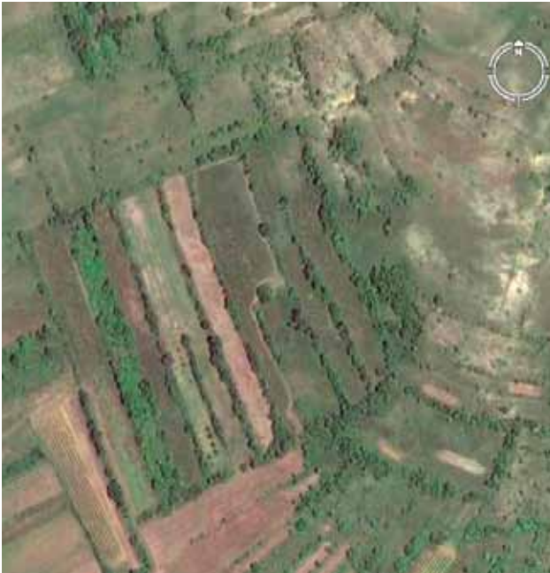
1 Satelitski snimak kaštela u Kadinoj Glavici Satellite image of the castellum at Kadina Glavica