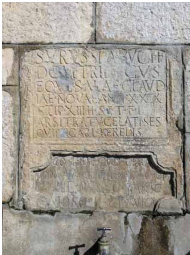
6 Nadgrobni spomenik Sura, konjanika ale Klaudivije nove

Satellite image of the Roman road route existing from the castellum