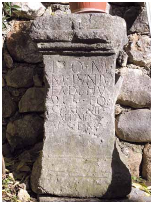
8 Žrtvenik Jupiteru koji postavlja Marko Junije Fadeno, dekurion III. kohorte Alpinaca

Stella of Vrkaja, cavalryman of the Claudius nova cavalry unit