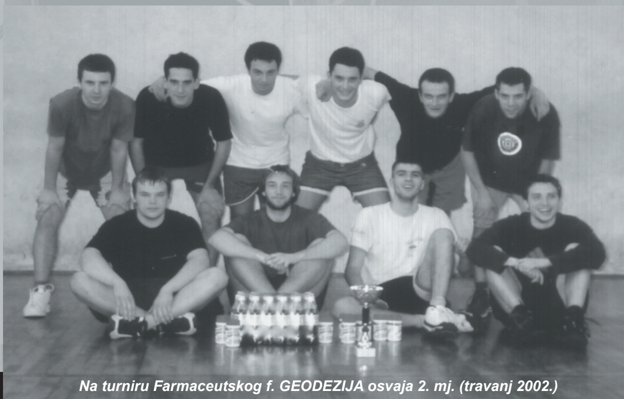
Na turniru Farmaceutskog f. GEODEZIJA osvaja 2. mj. (travanj 2002.)

Ne znam na koju foru, ali Ratko je uspio izmusti te novce od faksa. Trenirali smo dva puta tjedno. Možda treniranje nije prava riječ, već igranje na dva koša s ciljem da se što bolje upoznamo u igri, odnosno da naš trener uoči 'ko što može.