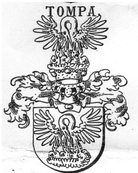
Grb 4: Grb Žigmunda Tompe de Palychna/Palicsna iz 1686. Iz Bojničić, I. Siebmacher's Grosses und allgemeines Wappenbuch .

fonda obitelji Tompa u HDA, da je grana Tompa de Palychna najstarija i da se tek kasnije od nje odcijepila grana de Horzowa. 46