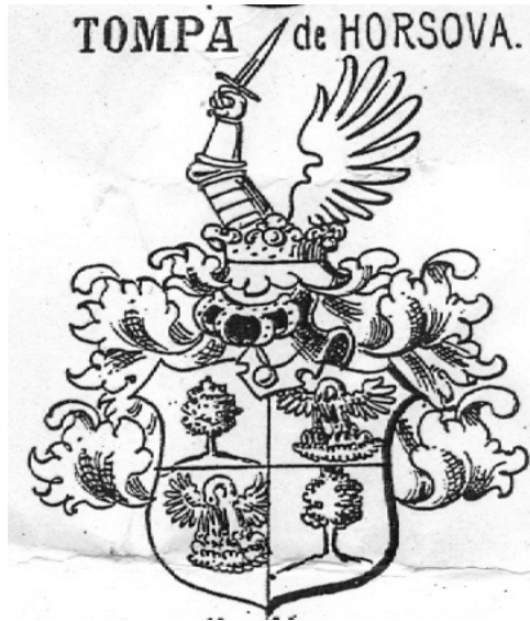
Grb 3: Grb Franja Tompe de Horsova iz 1661. godine. Iz Bojničić, I. Siebmacher's Grosses und allgemeines Wappenbuch .

( nedeliczi főharamincadellenörre ) 36 kao i koje desetljeće kasnije Sigismund Tompa de Palychna. Franjo Tompa de Horzowa je umro relativno mlad 1668. godine. 37