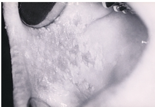
Slika 1. Bijeli spužvasti nevus na obraznoj sluznici Figure 1. White sponge nevus on the buccal mucosa

Klinički nalaz u usnoj šupljini pokazuje bijela hiperkeratotična područja s djelomičnim ekfolijacijama te s blagim eritemom u podlozi navedenih promjena koje se nalaze obostrano na bukalnoj sluznici, veličine 3x3 cm.