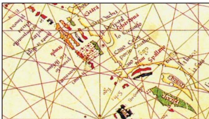
Sl. 2. Srednji Jadran na mletačkom portulanu Grattiosusa Benincase iz 1480. godine