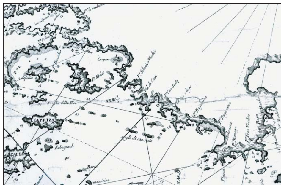
Sl. 4. Mletačka plovidbena karta s početka 18. stoljeća s prikazom šibenskog akvatorija