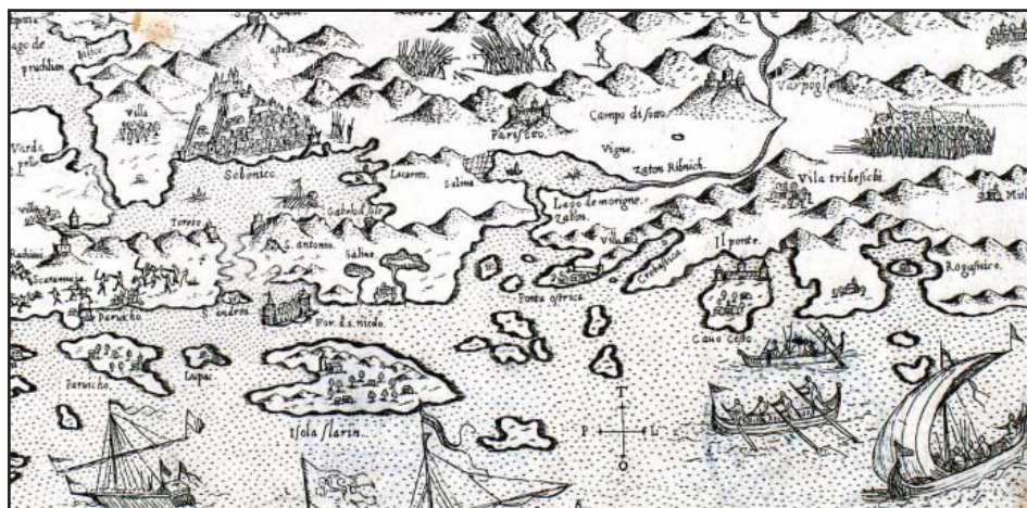
Sl. 3. Šibenski akvatorij na Kolunićevoj karti iz 1570. godine