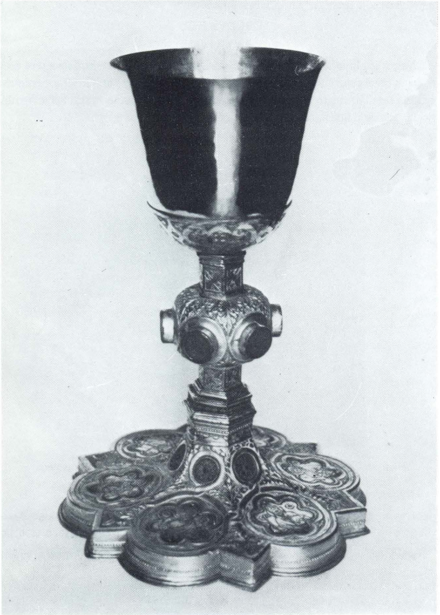
Hvar, stolnica, gotički kalež s grbom biskupa Tome Tomasinija