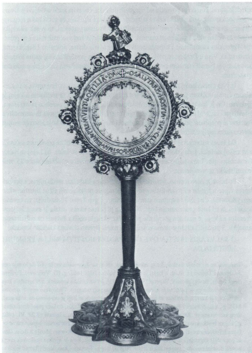
Hvar, stolnica, gotička pokaznica biskupa Tome Tomasinija