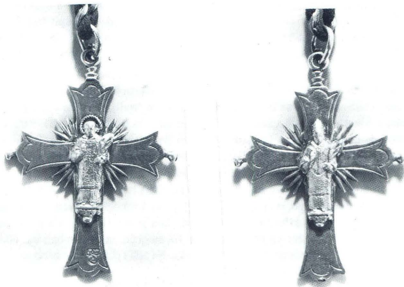
Hvar, stolnica, gotički pektoral

U svojoj oporuci Tomasini spominje i nekoliko komada crkvenog ruha. Tako oporukom potvrđuje raniju darovnicu nadžupskoj crkvi u Nerežišćima jedne misnice zelene boje s ukrasnim damastom, s dalmatikom iste boje i jedan plašt (unum pluviale) koji je ranije bio u benediktinskom samostanu u Komiži (in monasterio Lissae). Hvarskoj je stolnici ostavio jednu mitru optočenu zlatom, i po njegovoj izreci lijepa izgleda (mitram aurifusatam et pulchram), kao i sve ostalo crkveno ruho (omnia alia paramenta).