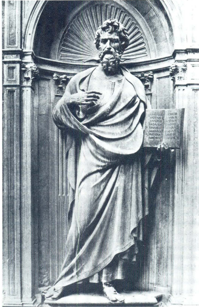
Lorenzo Ghiberti, Sv. Matej v niši (1419-1422, Firenze, Or San Michele)

Oblikovanje vzhodne apsidalne zunanjščine stolne cerkve v Šibeniku sodi med najimpresivnejše arhitekturne stvaritve Jurija Dalmatinca. Načrt zanjo je umetnik nedvomno napravil takoj po nastopu službe protomagistra leta 1441. Na to lahko sklepamo po naročitlih za kamenje in njegovi dobavi 9 in znamenitem napisu na zunanjem pilastru na