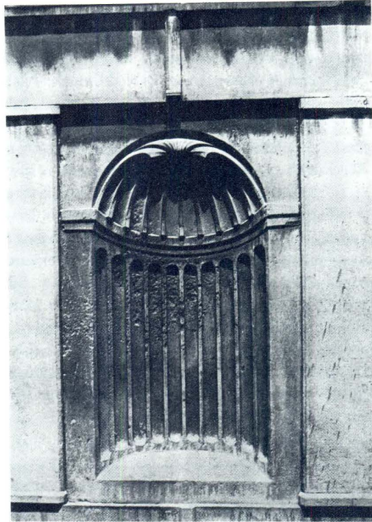
Šibenik, stolnica sv. Jakoba, školjčna niša srednje apside.

turi Dalmacije je žal moralo ostati v rokopisu; objavljen je bil del o Pagu, 3 osnovni pogledi pa so predstavljeni v avtorjevi sintetični knjigi o umetnosti srednjega veka in renesanse v Dalmaciji. 4 Te študije kažejo, da je bil Jurij Dalmatinec vsaj posredno seznanjen s tvornostjo florentinske zgodnje renesanse, pri čemer se kot križiščni točki pojavljajo najprej Benetke (delavnica Giovannija in Bartolomea Bon za posredovanje Ghibertijevih predlog) in Padova za vplive samega Donatella in njegovega kroga (Niccolò Pizzolo); latentno vprašanje morebitnega Dalmatinčevega potovanja v Firence pa je seveda še vedno ostalo odprto. 5