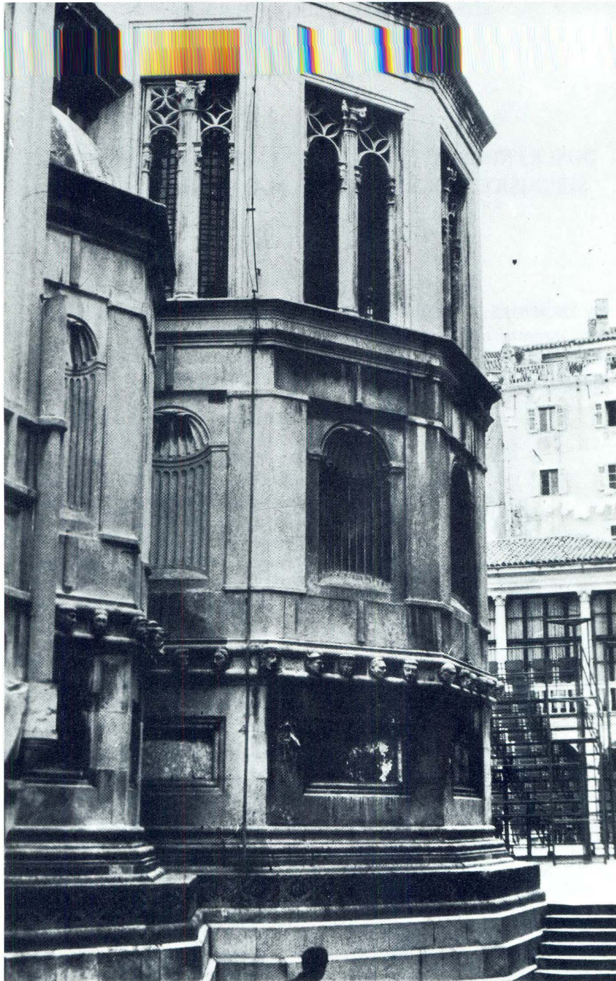
Šibenik, stolnica sv. Jakoba, apside, spodnji del (Jurij Matejev Dalmatinec, nacrt 1441, zgrajene 1443-1459).