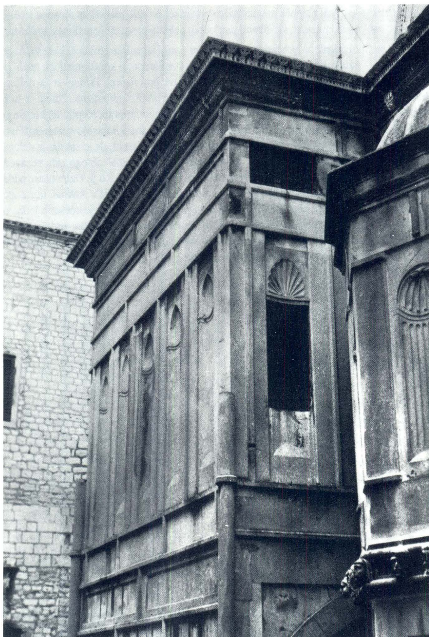
Zakristija pri stolnici v Šibeniku (po načrtu Jurija Matejeva Dalmatinca 1452)