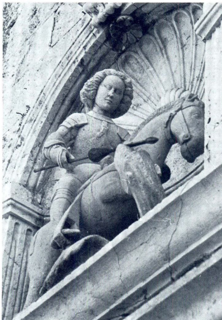
Brusje (otok Hvar), župna crkva, sv. Mihovil

Nad vratima župne crkve u Brusju nedaleko od Hvara stoji stari kameni kip crkvenog naslovnika sv. Jurja (vis. 115 cm), prikazanog na tradicionalan način kako jašući na konju probada zmaja. Kip je samo registriran kao "reljef !/!" u renesansnoj niši ugrađenoj nad ulazom u župsku crkvu sv. Jurja. 24 No i pored renesansnog motiva plošne i plitke školjke u svom gornjem dijelu, ta niša po okviru i profilaciji pripada vremenu gradnje crkvenog pročelja koje se, prema sačuvanim dokumentima, podizalo oko 1800. godine 25 i nosi pečat