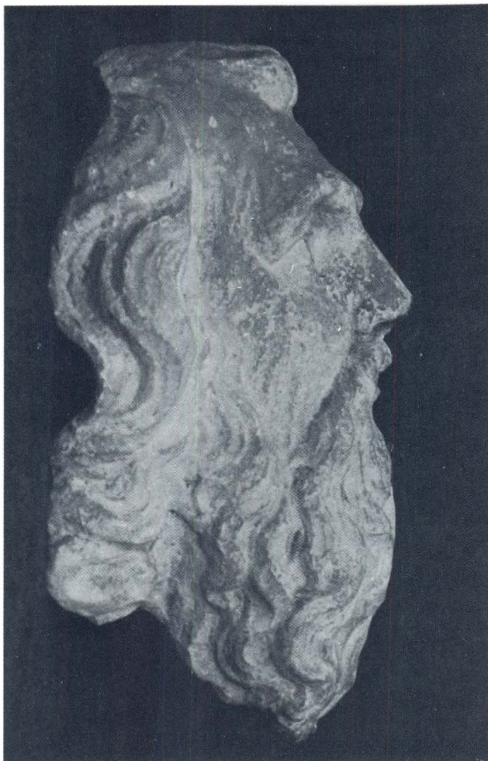
Hvar, katedrala, glava Boga Oca, profil

Ch/r/istofori Sancti speciem quicumque tuetur,