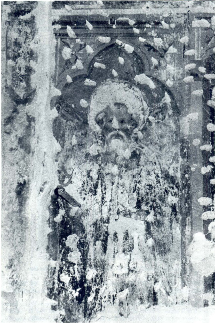
Antonio Veneziano (?), Sv. Antun Opat, Zadar, Crkva Sv. Šime