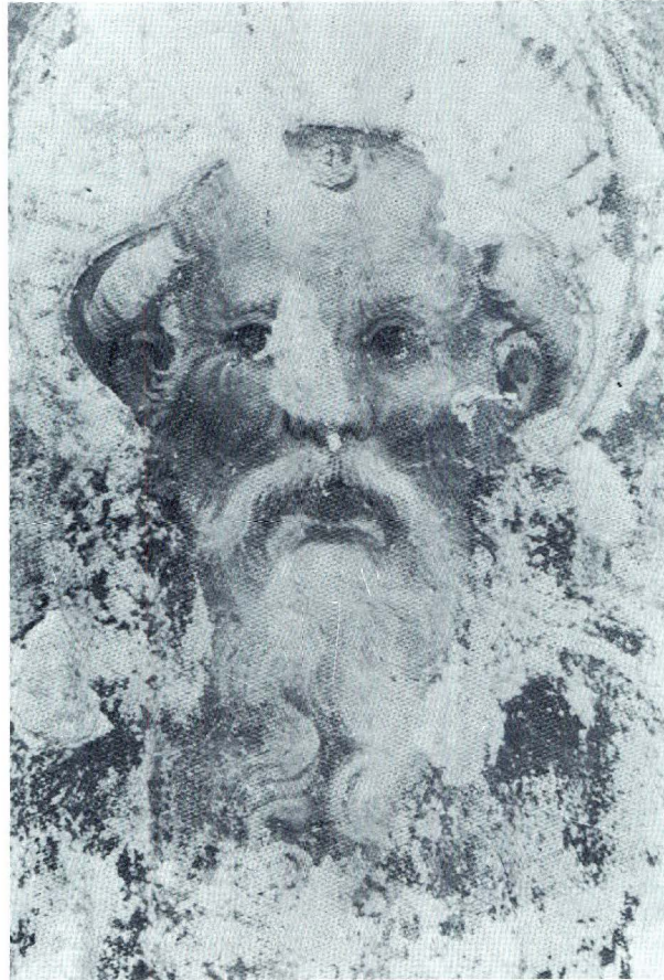
Antonio Veneziano (?), Sv. Antun Opat, (detalj), Zadar, Crkva Sv. Šime

U tom svjetlu, dva, do sada nepoznata dokumenta datirana 17. i 20. srpnja 1388. godine, u kojima se kao svjedok spominje slikar Antun iz Venecije, stanovnik Zadra, 4 dobivaju na značenju. Naime, u to doba, jedini slikar tog imena podrijetlom iz Venecije je