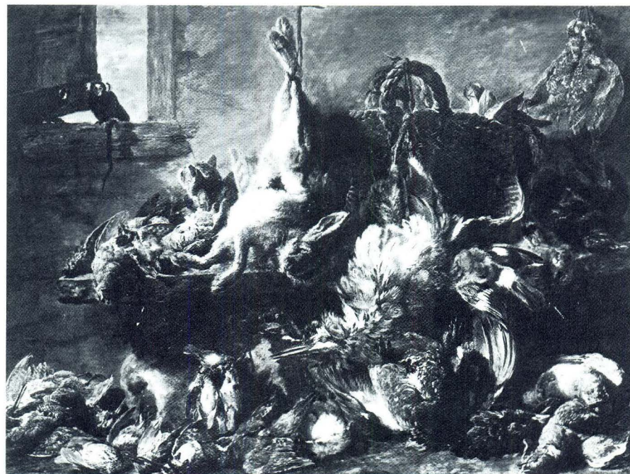
Jan Fyt, Spremište s policom s mrtvom divljači, brojnim drugim pticama, obješenim zecom, košarom i dva majmuna na prozoru, Pariz, Louvre