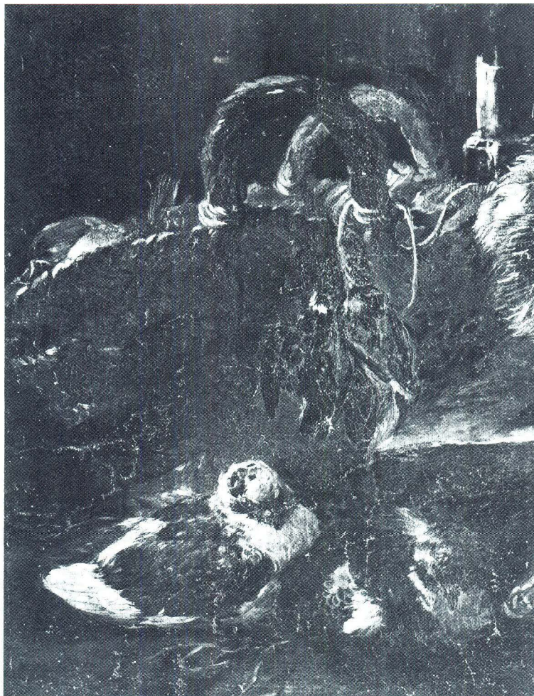
Jan Fyt (?), Letušće, Dubrovnik, Biskupska pinakoteka, detalj

kog slikara lovačkih tema i mrtvih priroda sa divljači Francois Desportesa (1661.—1743.). 2