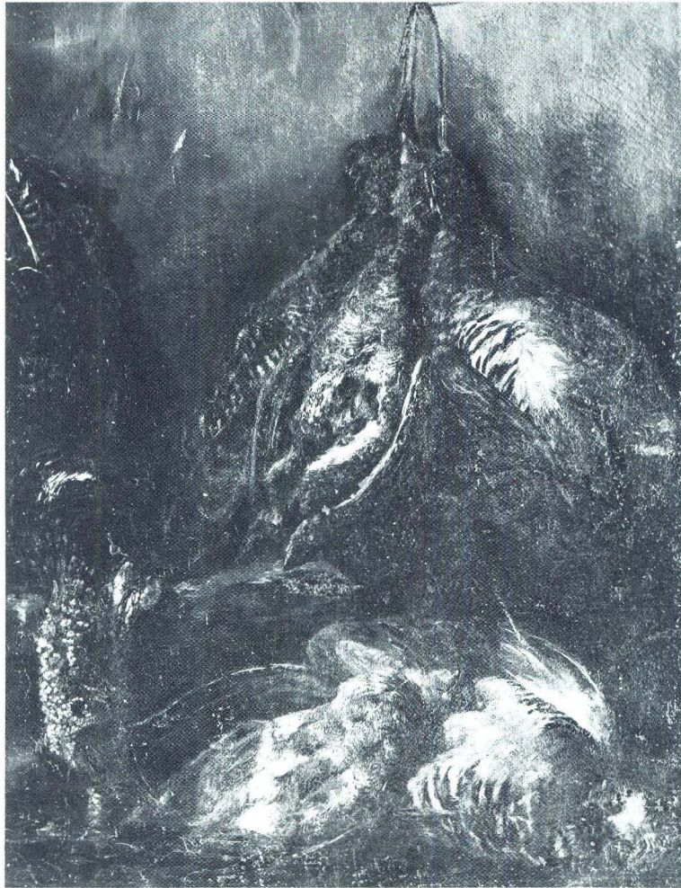
Jan Fyt (?), Letušće, Dubrovnik, Biskupska pinakoteka, detalj

»Nicasio« je očito flamanski slikar Nicasius Bernaerts, učenik Fransa Snydersa (1579.—1657.), rođen oko 1620. u Antwerpenu, a umro 1678. u Parizu. Kao vrlo mlad spominje se već 1633.—34. u bratovštini slikara grada Antwerpena. Nakon školovanja putovao je u Italiju, zatim u Francusku gdje se 1643. spominje u Parizu. Godine 1654. opet je u Flandriji, a zatim 1663. ponovno u Francuskoj gdje se upravo javlja pod imenom »Nicasius« i 1665. postaje članom pariške slikarske Akademije u koju je primljen sa slikom »Mrtva priroda s divljači i s psom«, danas u Muzeju u Dijonu. U Francuskoj radi i tapiserije za »Manufacture des Gobelins« s francuskim slikarom Jeanom Garnierom i Flamancem Pieterom Boelom također Snydersovim učenikom. Bio je učitelj poznatog francus-