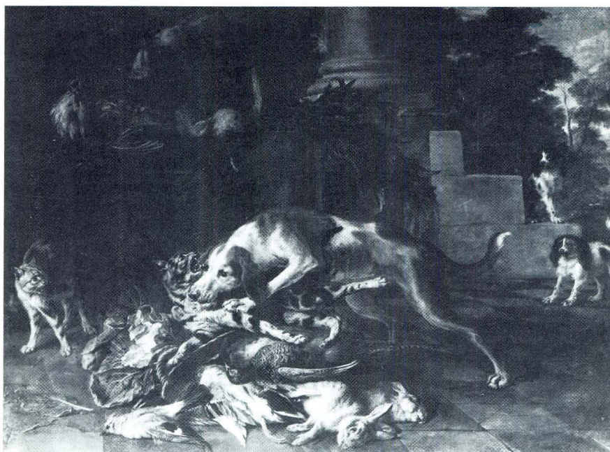
Nicasius Bernaerts, Psi, mačke i divljač, Dijon, Musée de Dijon