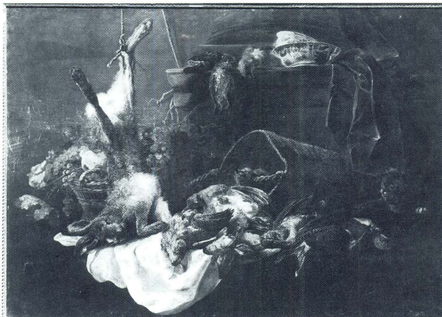
Jan Fyt, Mačak promatra divljač i košaru grožđa, Pariz, Louvre