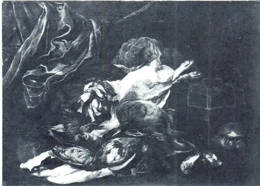
Jan Fyt, Mačak gleda na obješenog zeca, ptice i lovačke potrepštine, Pariz, Louvre