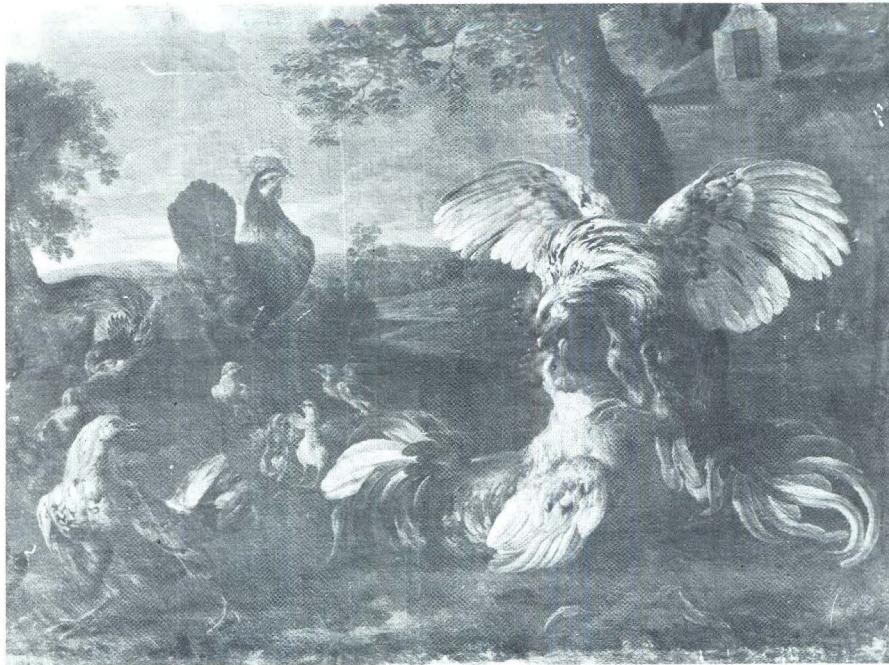
Nicasius Bernaerts (?), Sukob pijetlova i kokoši, Pariz, Louvre

U spremištu Louvrea nalazi se i slika atribuirana Nicasiusu pod naslovom »Sukob pijetlova i kokoši«, koja se ranije pripisivala njegovu učeniku Francoisu Desportesu. Isto se tako tu čuva i 14 slika na temu studija životinja, od kojih najveći broj predstavlja ptice, a među kojima se ističe niz varijacija na temu pijetlova i kokoši (»Galinacées«). Sve su te slike u vrlo slabom stanju i za precizniji sud bi ih nužno trebalo restaurirati. Slike, čini se, potječu iz zbirke »Manufacture des Gobelins«, te se smatra da su mogle pripadati seriji naručenoj od samog kralja Luja XIV., ali s obzirom na njihov osrednji kvalitet drži se da najveći broj tih predstavlja kopije iz 18. stoljeća prema Nicasiusovim originalima.