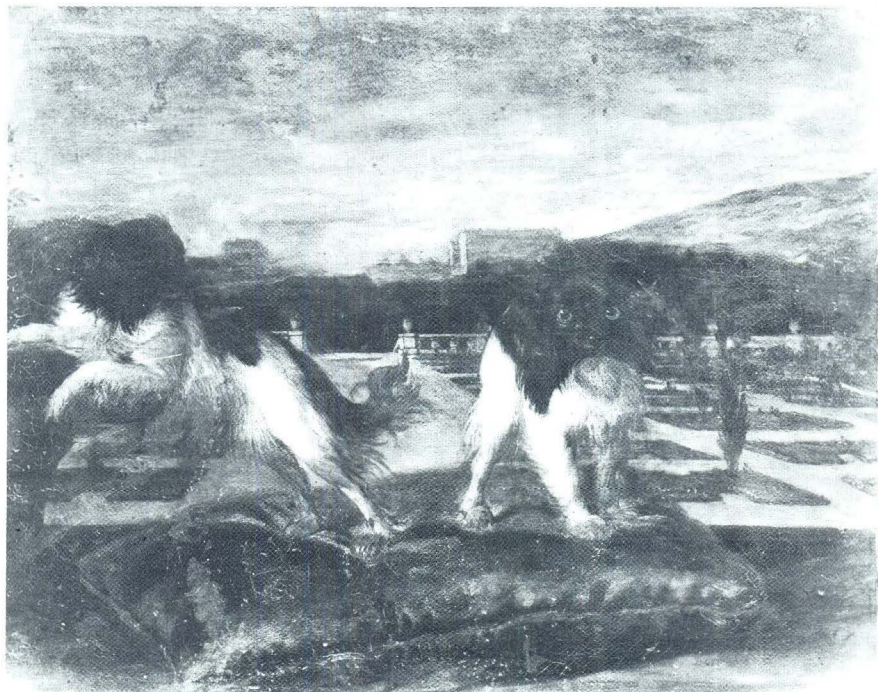
Nicasius Bernaerts, Dva psa tipa »King Charles«, Pariz, Louvre

U muzeju u Dijonu (Musée du Dijon) čuva se slika koja je predstavljala umjetnikov »Morceau de reception« u Akademiju lijepih umjetnosti. Na središnjem dijelu slike prikazan je pas koji grize svom snagom zaprepaštenu mačku. Lijevo od te centralne skupine, ispod koje je hrpa zečeva, peradi i kupusa, druga je mačka, a desno su dva psića tipa »King Charles«. U pozadini se naziru antikni reljef i baza klasičnog stupa te zeleni grmovi, a nad reljefom još je jedna skupina peradi i slamnata košara.