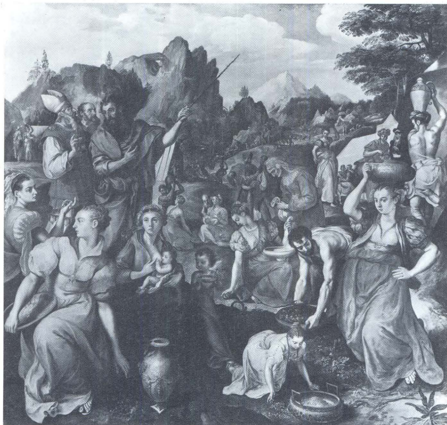
Marten de Vos, Čudo mäne, München, Alte Pinakothek

Takav način gradnje pejzaža, s naglim suprotstavljanjem bliskog i udaljenog, velikog i malog te skokovitim, gustim i usitnjenim izmjenama osvjetljenog i zasjenjenog općenit je i učestao u slikarstvu kasnog flamanskog manirizma.