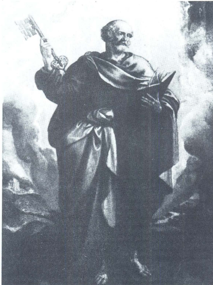
Marten de Vos, Sv. Petar, Meksiko, Cuantitlán, Iglesia Conventual

I na drugoj slici iz iste meksičke crkve, koja prikazuje Krunjenje Marijino, isto je osvijetljenje neba i postava oblaka. Ali za nas je možda važnije što su do glavnog, Marijinog lika prikazani lebdeći anđeli, kao i do Marije s grguričke pale. Oba, na slikama s desne strane postavljena anđela vrlo su bliski položajem tijela i proporcijским odnosima. Prikazani su naprijed nagnuti, u profilu, sklopljenih i podignutih ruku, iza leđa zabačenih krila, sitne glave, s istim obrisima lica, izrazito visokog čela i suviše prema zatiljku postavljenim uhom, kratke kose, koja je iza glave ponešena jakim strujanjem zraka. Karakteristično je da su oba oblikovana istom crtačkom nesigurnošću, osobito izraženom u postavi vrata, ramena i korijena krila. Opisujući meksičku sliku, autor Vosove monografije, Armin Zwite zato anđela i ostale oko Bogorodice pripisuje ruci