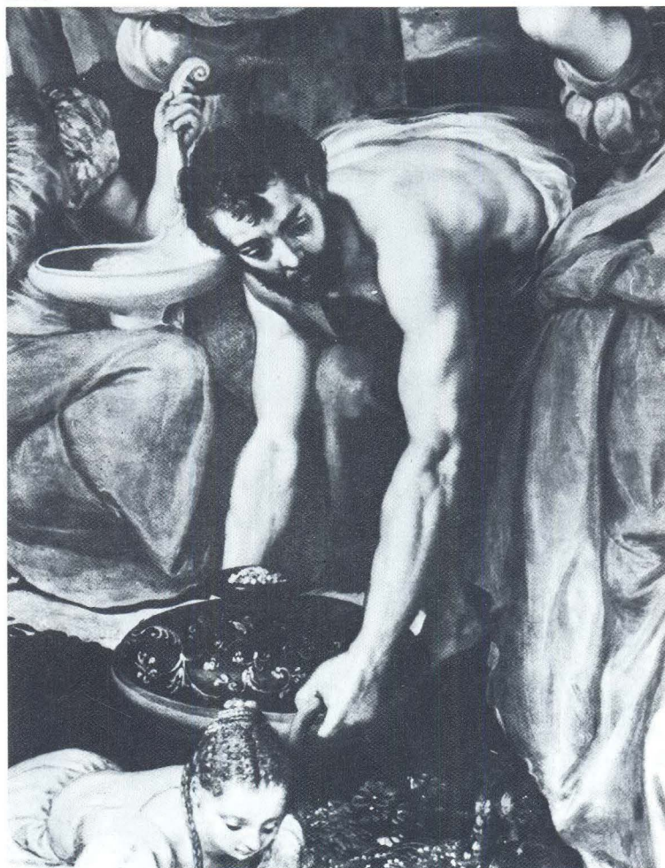
Marten de Vos, Čudo măně, Alte Pinakothek, München, detalj

djeteta — anđela, a u münchenskoj slici nedorasle djevojke zaokupljene skupljanjem nebeske hrane. U manirizmu učestalo suprotstavljanje velikog i malog, krhkog i robusnog, u ovom primjeru ne može se smatrati samo općenitom osobinom zbog izrazitih sličnosti prikazanih sudionika na obje slike. Također se na istoj münchenskoj slici može na odjeći, pa i u licu Mojsijevu prepoznati sličnosti sa rubno postavljenim svetim vračem s pale iz Grgurića, i osobito u njihovim preko leđa prebačenim plaštevima koji se oko pojasa sabiru u širokim, zavojito uvijenim naborima. U tom pogledu jednako je za nas zanimljiva i Vosova slika s likom sv. Petra iz devetog desetljeća 16. stoljeća — istovremena dakle grgurićkoj pali — koja se nalazi u crkvi Iglesia Conventual meksičkog grada Cuantilána. Draperija Petrovog širokog plašta, naime, ovješnim rubovima ispisuje umnoženu »S« liniju, objedinjujući tako isti motiv s odjeće