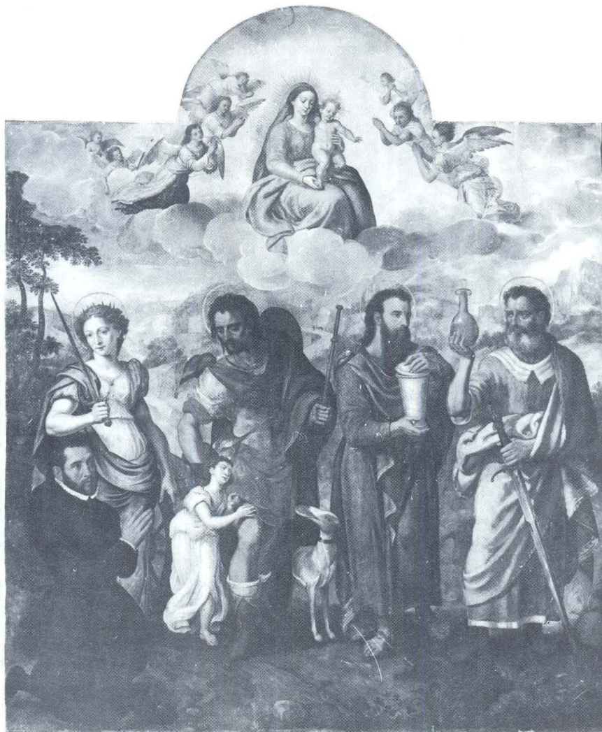
Marten de Vos, Oltarna pala Tonka Matkovog Gradića, Grgurići kraj Šlanog, kapela Sv. Roka

su postavljeni u različite položaje, pognuti su i skupljaju dar božji, nose posude, pa okupljeni u grupe razgovaraju, sjede, odmaraju se ili su zabavljeni djecom. Međusobno su postavljeni tako da cjelinom vlada maniristička rasutost radnje i kod mnogih se likova ne raspoznaje smisao njihova pokreta.