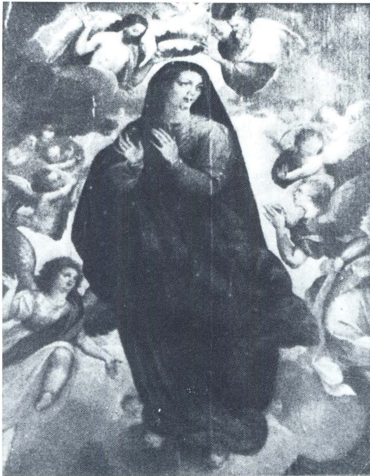
Marten de Vos, Sv. Marija, Meksiko, Cuantitlán, Iglesia Conventual

slikareva pomagača. 7 I na grguričkoj pali prepoznaje se takva suradnja. Upravo u toj podudarnosti između Vosove slike iz Cuantiliána i pale iz Grgurića mogli bismo utemeljiti zaključak da se u obje slike ponavlja raspodjela radioničkih poslova, a kako su slike nastale istodobno, u njoj su vjerojatno sudjelovali isti pomagači.