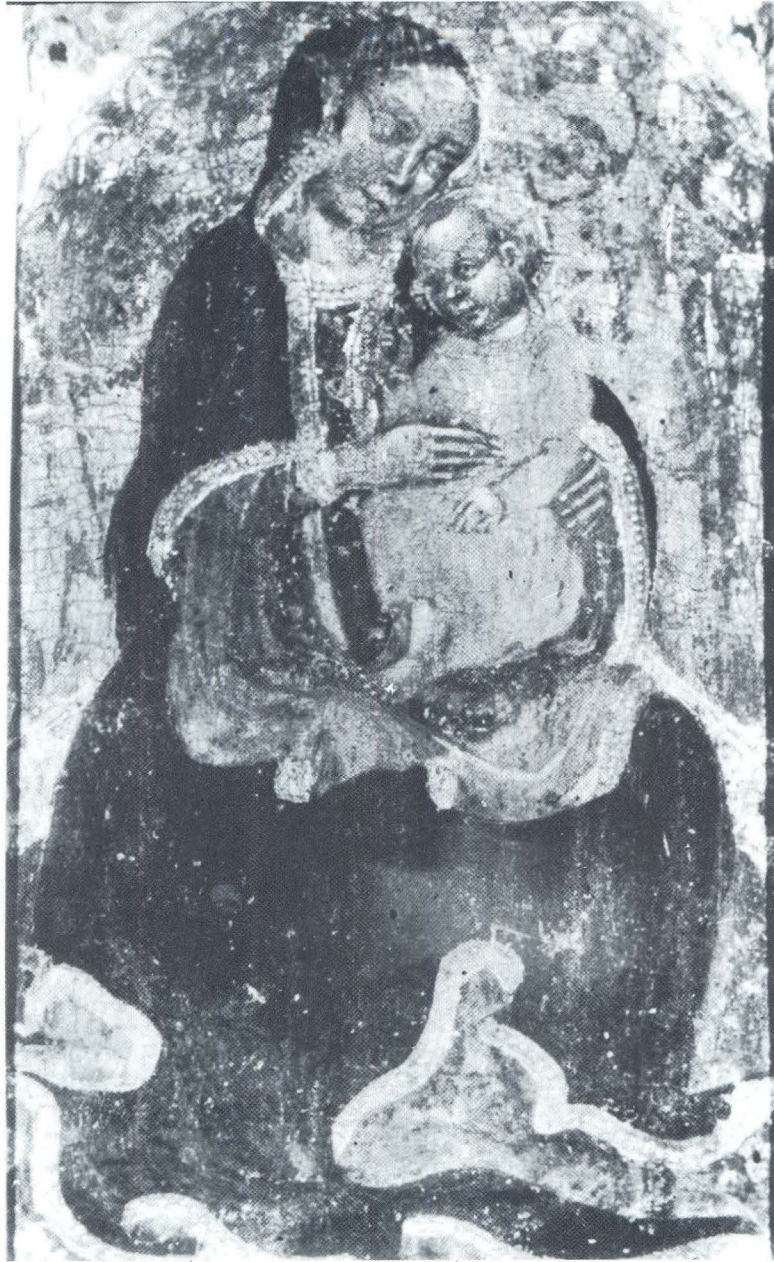
Bogrodica s Djetetom, Padova, Museo Civico