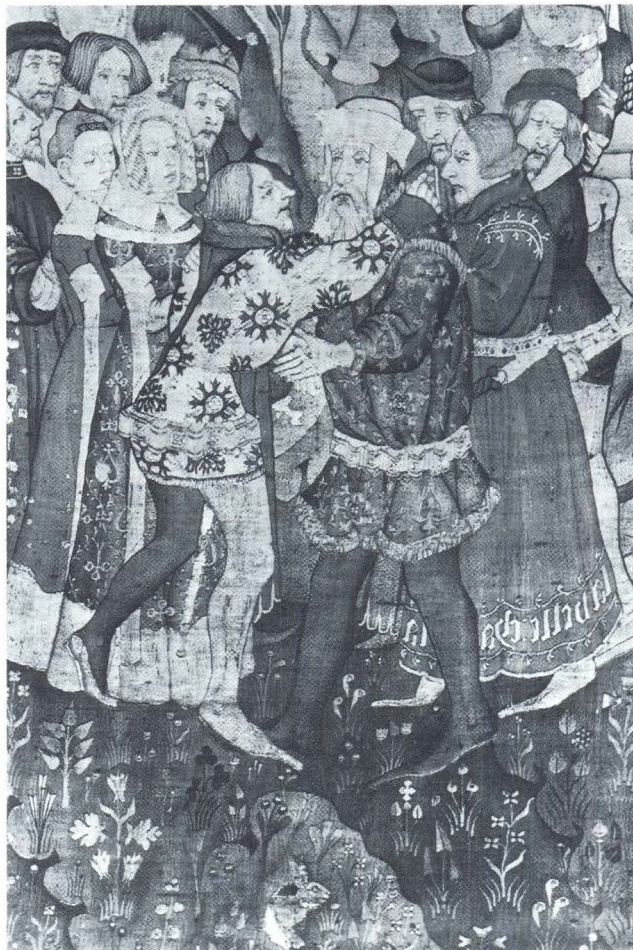
Susret Fromonta i Girarta, Padova, Museo Civico

nimljivo je da se i ovo djelo, kao i ona venecijanska, povezuje sa spomenutim radionicama u Arrasu i Parizu, te naročito s također navedenim ciklusom Apokalipse iz Angersa. Datira se u kraj 14. ili početak 15. stoljeća. 30 Tema tapiserije je jedna od priča iz srednjovjekovnih francuskih viteških romana i poema. Djelo potječe iz palače padovanske porodice Santa Croce. U 14. i 15. stoljeću vladala je među talijanskim plemstvom prava pomama za francuskom kulturom, o čemu nam svjedoče brojne