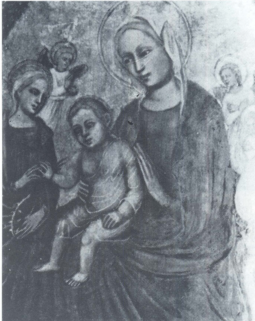
Mistično vjenčanje sv. Katarine, Rožmberk