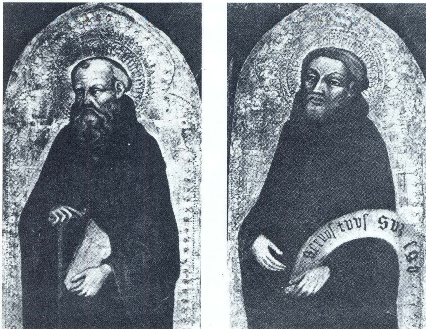
Sv. Antun pustinjač i sv. Filip Benizzi, Konopište, dvorac d'Este