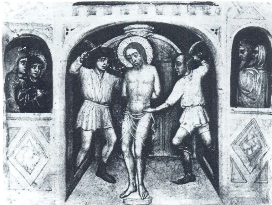
Bičevanje Krista, Venecija, Museo Correr

umjetnosti. Ugljanski poliptih može nam poslužiti kao didaktički primjer suradnje nekolicine majstora (slikara i drvorezbara) unutar jedne radionice, kao i njihove težnje da usklade svoje stilove radi postizavanja dojma jedinstvene cjeline. Zanimljivo je da su naša dva majstora ostavila svjedočanstvo o svojoj slikarskoj suradnji na dva djela, jedno na samom početku njihove zajedničke djelatnosti (freske na ciboriju oltara sv. Dujma u splitskoj katedrali iz 1429.) i prethodno analizirani Ugljanski poliptih iz 1446./47. godine na kraju njihove suradnje. Naime, Ivan Petrov umire 1448. godine. Poznavanje tih djela, kao i onih samostalnih radova, pruža nam mogućnost praćenja uplivanja jednog majstora na