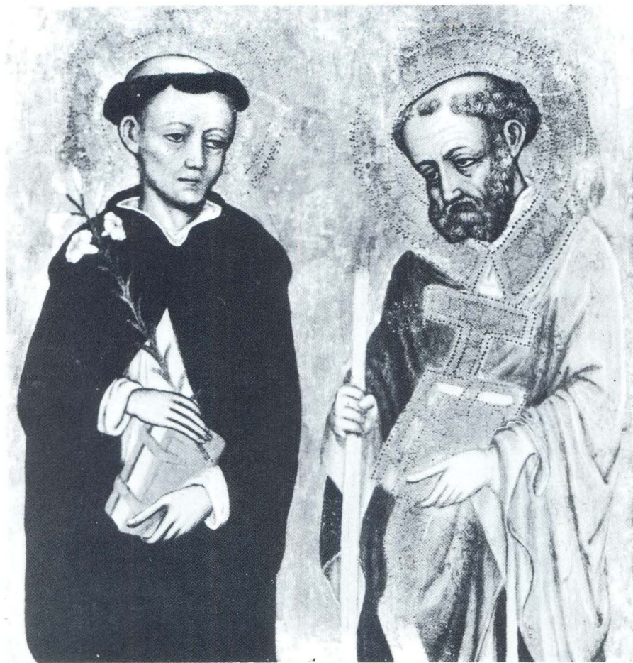
Sv. Dominik i nepoznati svetac, Švicarska, privatna zbirka