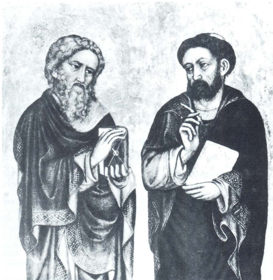
Dva evanđelista, Švicarska, privatna zbirka

Pretpostavka o Dujmu Vuškoviću kao mogućem autoru poliptiha o kojem je riječ temeljila bi se na njegovom hipotetičnom važnijem udjelu u izradi fresaka na stropu kapele sv. Duje u splitskoj katedrali i hipotetičnom autorstvu niza slika sa zadarskog područja sličnih stilsko-tipoloških karakteristika (slika Mrtvog Krista iz Luke na Dugom otoku, Bogorodica s Djetetom iz zadarskog franjevačkog samostana, Bogorodica s Djetetom na prijestolju iz samostana sv. Marija u Zadru i nestali poliptih iz crkve sv. Ivana u Stanovima u Zadru). Međutim, ni za jednu od tih djela nije postojao neki čvršći dokaz da je to uistinu Dujmovo djelo, osim splitskih fresaka, koje su, sudeći po narudžbi iz 1429. godine, zajednički rad oba majstora. 10 Budući da se na osnovi spomenutog dokumenta nije moglo utvrditi što je na freskama izradio jedan, a što drugi majstor, ovo djelo u stvari nije moglo biti od velike pomoći u komparativnoj analizi