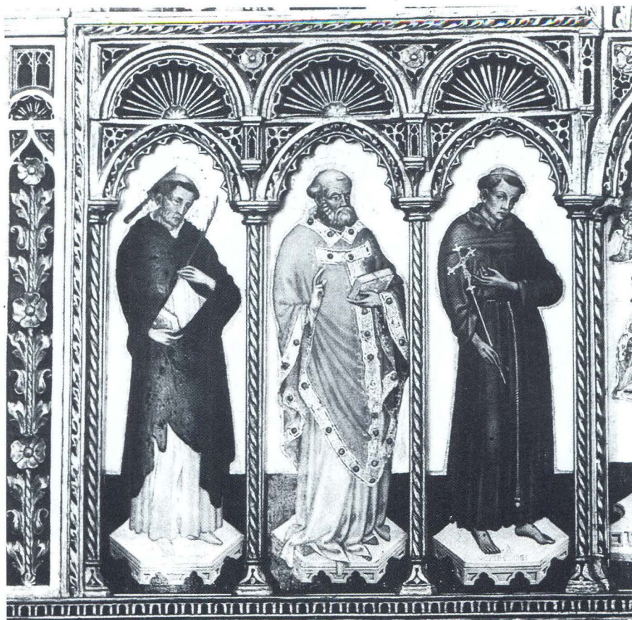
Sv. Petar mučenik, sv. Nikola i sv. Franjo, detalj Ugljanskog poliptiha, Zadar, zbirka franjevačkog samostana