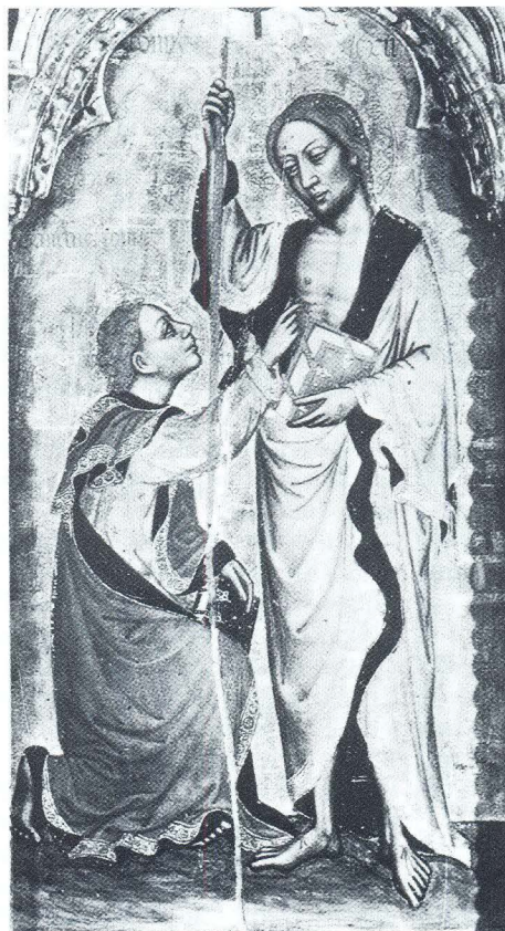
Nevjerni Toma, Mombaroccio, svetište blaženog Santaea

ka na slici iz privatne kolekcije u Švicarskoj. 13 Sličnu fizionomiju (malo povijena glava s tonzurom, trokutasto lice) posjeduje i lik svetog Frane u franjevačkom ruhu na Ugljanskom poliptihu.