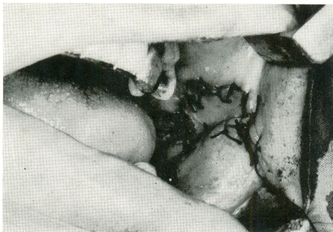
Slika 2. Defekt zatvoren sluzničkim režnjem

direktnom suturom. Na mjestu rotacije sluzničkog režnja dolazilo je do stvaranja obilja tkiva, a nabori nastali skvrčavanjem slobodnog kožnog transplantata otežavali su otvaranje usta. Radi ovoga i radi jednostavnog pristupa primjena otočnog režnja na submukoznoj peteljci je preporučljiva u slučaju cirkularnih defekata obraza.