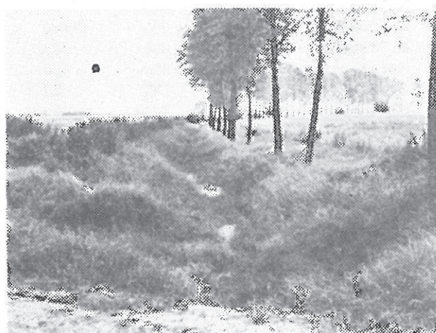
Sl. 4. Drenažni kanal zvan »Miloševac« u selu Ladimirevci

Primjer dužine i površine nekih drenažnih kanala u slivu Karašica — Vučica prikazat ćemo za neka sela: