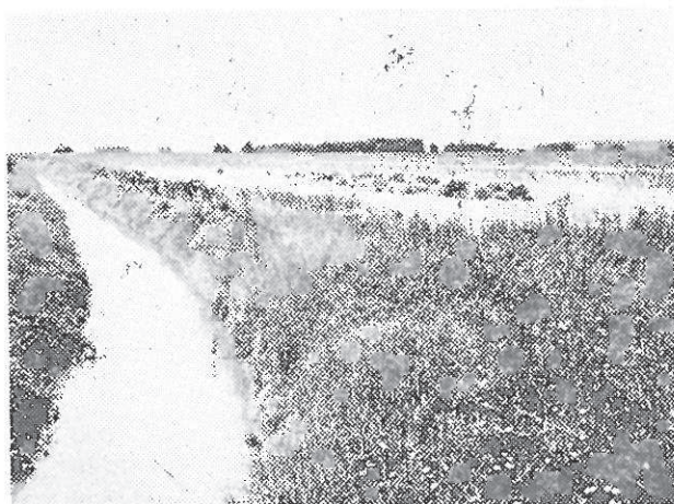
Sl. 3. Jedan od drenažnih kanala zvan »Pavlovci 3« u selu Ladimirevci

sa oranica ili velikih ploha pod nekom od monokultura (pšenica, kukuruz, šećerna repa, suncokret, duhan i dr.). Mnogi drenažni kanali su pretežno suhog korita (slika 4), dok se samo u nekim zadržava voda preko cijele godine a njihovo dno je jako obrašteno (uglavnom šaš), gdje se zadržavaju razne vrste puževa (Planorbis spp., Limnea spp.) i račići (gammarusi) i množe žabe.