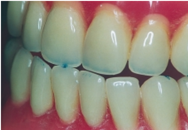
Slika 5. Prerani dodir na zubima 11 i 41 tijekom protruzijske kretnje

Figure 5. Deflective contact on the tooth 11 and 41 during protrusive movement