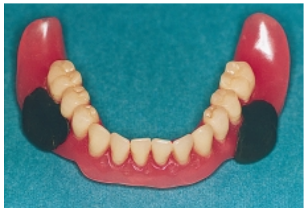
Slika 2. Nasloni za terapeutove prste na donjoj potpunoj protezi

Donja proteza sa slojem voska uroni se u kupelj od 52°C na 20 sekundi te postavi na protezno ležište. Pacijent lagano, kako je uvježban, zatvori usta, a dodiranjem antagonističkih zuba terapeut provjerava zabilježeni razmak između kontrolnih točaka, koji mora biti jednak ili povećan za prostor između zuba za samo 0,2 - 0,5 mm. Donja proteza izvadi se iz usta, skalpelom se odstrane impresije u vosku ohla-