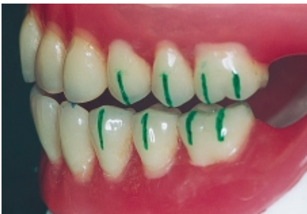
Slika 6. Dodir na očnjacima u lateralnoj kretnji vođenom zubima.

mještanje Bennettova kuta, obostranim postavljanjem crvenog SAM nastavka na 10°). Počinje se desnom lateralnom kretnjom. Gornji dio artikulatora povuče se ulijevo tako da pri tom kondilna kugla na radnoj strani dodiruje stražnji zid kućišta. Selektivnim brušenjem potrebno je postići dodire na očnjacima, odnosno na pretkutnjacima radne strane (Slika 6). Prerani dodiri odstranjuju se brušenjem ekscurzivnih dodira (dio uz kvržicu), a sačuvaju se oni bliže jamicama, jer se tu nalaze RKP kontakti. Svaki dodir na slobodnoj ili balansnoj strani se uklanja (Slika 7). Jednaka korekcija provodi se i na lijevoj strani.