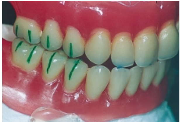
Slika 7. Mogući dodir zuba na slobodnoj strani treba ispraviti

Figure 6. Contact on canines produced in lateral movement by tooth guidance