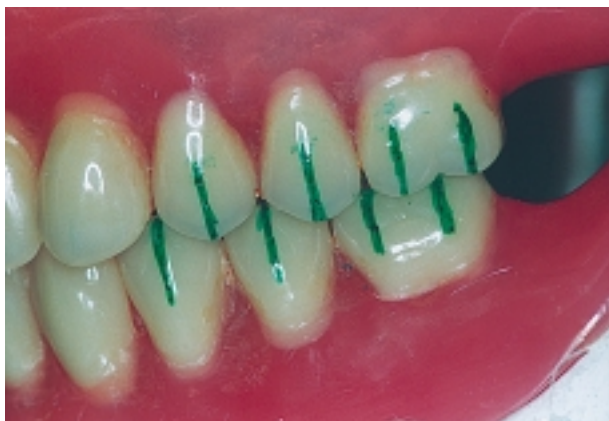
Slika 3. Voodootpornim markerom označen odnos jamica i kvržica zuba potpune proteze

Konačna korekcija moguće okluzijske disharmonije na protezama rješava se postupkom se-