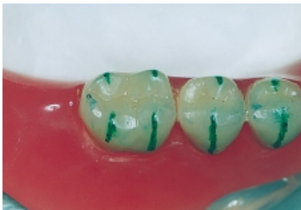
Slika 4. Prerani dodir na zubu 36

lektivnog brušenja. Selektivnim brušenjem čuva se željeni oblik zuba i vrsta okluzije (22). U RKP-u označe se okluzijski kontakti tankim artikulacijskim papirom. Proces označavanja i brušenja ponavlja se sve dok se ne postignu obostrani, istodobni i jednakomjerni kontakti svih postraničnih zuba, fakultativno i očnjaka. Potreban je dovoljan broj anteroposteriornih i bukolingvalnih stabilizirajućih zubnih dodira. Svaki prerani dodir izbrusi se frezom, tako da se sačuva morfologija zuba (Slika 4). Sjekutići su obvezatno izvan okluzije. Važno je da incizalni kolčić uvijek dodiruje incizalni tanjurić u isto vrijeme kada i zubi međusobno.