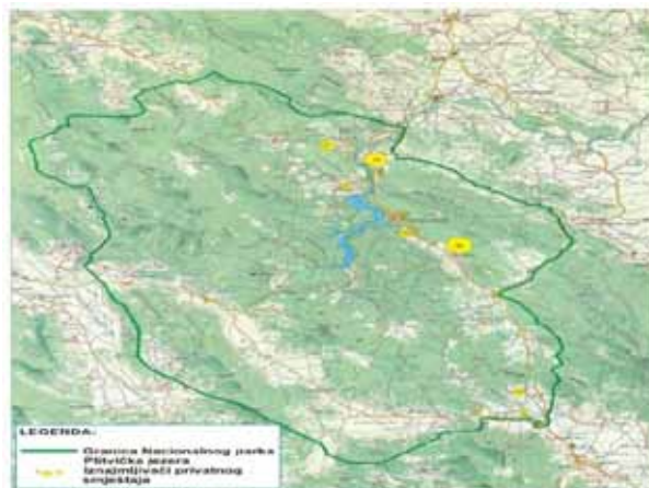
SHEMA 2: GRANICE NACIONALNOG PARKA I LOKACIJA PRIVATNIH IZNAJMLJIVAČA