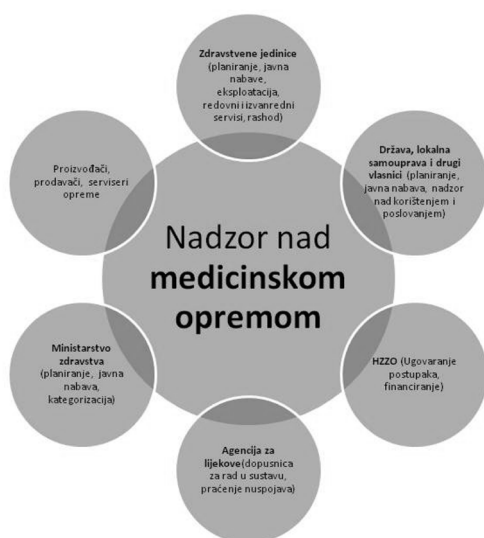
Sl. 3. Izvori podataka za nadzor nad medicinskom opremom

Prijedlog za unaprjeđenje: Suvremeni sustav Registra tehnološki napredne medicinske opreme tek treba razviti. Postojeća tehnologija omogućava razvoj dijeljenog javnog resursa zasnovanog na web-tehnologijama koji bi koristili korisnici na različitim razinama, počevši od Ministarstva zdravstva i socijalne skrbi, državnih i županijskih zavoda, lokalne samouprave, zdravstvenih jedinica (ustanove, trgovačka društva, privatne poliklinike i ordinacije) sukladno njihovim nadležnostima i obvezama. Podatak o opremi morao bi biti obuhvaćen od trenutka ishođenja dopusnice za rad određenog tipa opreme u zdravstvenom sustavu kojega bi morala dodijeliti Agencija za lijekove i potvrditi Ministarstvo zdravstva i socijalne skrbi. Oprema bi se od strane zdravstvenih jedinica morala moći pratiti tijekom čitavog ciklusa njenog radnog vijeka, tj. od propisivanja i provođenja javne nabave, puštanja u dnevni rad, praćenja njenog korištenja, praćenja redovitih i izvanrednih servisa i popravaka te konačno do trenutka njene prodaje ili rashoda. Za svaki komad opreme bilo bi poželjno uvesti jedinstveni identifikator koji bi se bilježilo u propisanoj medicinskoj dokumentaciji (nalaz, račun) i koji bi omogućio njegovo kontinuirano praćenje u zdravstvenom sustavu (sl. 3). Opisani sustav bio bi potpora upravljanju medicinskom opremom u samim