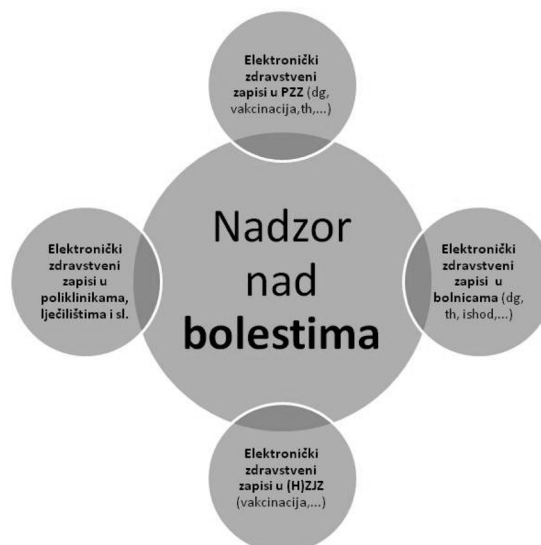
Sl. 1. Izvori podataka za nadzor nad bolestima

Činjenica je da je informatizacija potrebna, da je neophodno napraviti elektronički zdravstveni zapis (koji će sadržavati kompletnu medicinsku dokumentaciju pojedinačnog pacijenta), i da se pritom mora poštivati međunarodne norme. Međunarodnim normama se normira elektronički zdravstveni zapis (npr. HRV EN 13606:2008), komunikacija informacija među sudionicima u zdravstvenom sustavu (npr. HL7), ujednačenost bilježenja podataka (klasifikacije i sl., npr. MKB-10), sigurnost i zaštita podataka. Time medicinska dokumentacija postaje uporabljiva od strane svih koji su za to ovlašteni. Ovlasti pojedinih korisnika (liječnika, sestre, javnozdravstvenog djelatnika) pri korištenju podataka također treba jasno definirati.