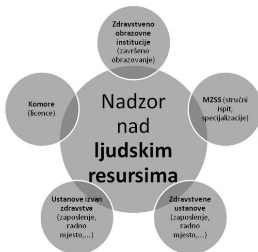
Sl. 2. Izvori podataka za nadzor nad ljudskim resursima

Prijedlog za unaprjeđenje: Suvremene sustave za praćenje zdravstvenih resursa treba razvijati na način da postanu javni resurs koji služi najširem krugu korisnika sukladno njihovim nadležnostima i obavezama. Npr. zdravstveno-obrazovne ustanove u takav resurs mogu unositi podatke o svakoj osobi koja je završila njihov program, Ministarstvo zdravstva podatke o uspješno položenom stručnom ispitu te specijalističkim ispitima, zdravstvene ustanove o zapošljavanju, rasporedu na određeno radno mjesto, promjenama mjesta zaposlenja. Nadležne komore upisivale bi podatak o licenci i njenom produžavanju i sl. Na taj bi se način dobio ažurni sustav kao podloga za promptno izvješćivanje, a mogao bi se koristiti i u druge svrhe, primjerice za planiranje upisne edukacijske kvote za zdravstvena zanimanja (sl. 2).