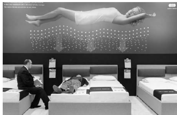
Slika 21. Detalj iz paviljona 9 – Sleep

Uspjeh što ih spomenuta struka doživljava unutar proizvodnje namještaja i opreme može zahvaliti uložnim investicijama i ujedinenosti na području istraživanja, razvoja i inovacija te otvorenim raspravama i konferencijama koje su se održavale i za vrijeme sajma. Taj je sektor sve jači i veliku pozornost pridaje zdravlju i dobrobiti korisnika (sl. 21).