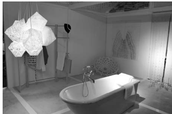
Slika 20. Detalj kupaonice otvorene pogledu, bez paravana