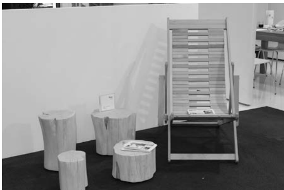
Slika 29. Proizvođač Efektiv iz Vinkovaca domišljato je iskoristio i oblikovao panjeve i ležaljku od cjelovitog drva