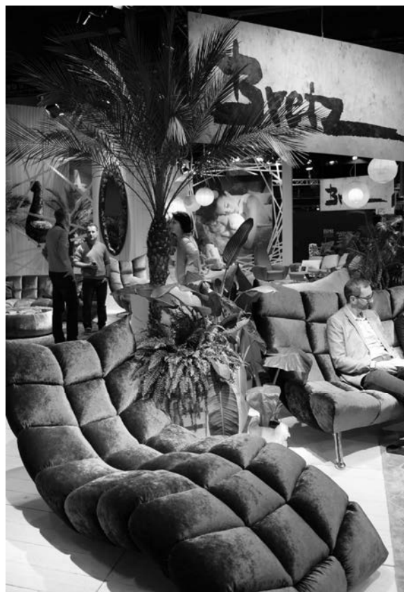
Slika 5. Oaze zelenila na štandovima izlagača; tvrtka Bretz

Tehnologija i zdravlje i dalje su nerazdvojni. Konkretno, udobnost i osjećaj korisnosti pridonose prevenciji zdravlja, a da bi postigli sklad i ravnotežu tijela i duha, dizajneri se služe tehnološkim dostignućima, osobito u kupaonici i spavaćoj sobi te u dnevnom boravku. Simbioza prirodnih i ekološki prihvatljivih elemenata, kojima dizajneri daju prednost, upotpunjeni su zelenim oazama (sl. 5), mirisima i mekanim formama, čime se mijenja nekadašnji izgled tih prostora.