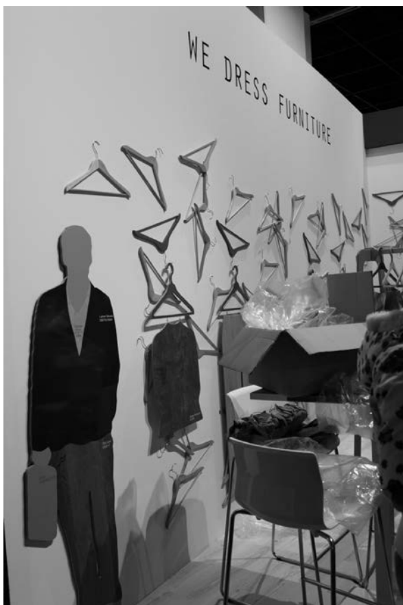
Slika 4. Obucite svoj namještaj – slogan je koji svakom korisniku omogućuje da sam individualno i trenutačno odluči o izgledu svojega doma

detalje, harmoniju boja, oblika i udobnih pratećih elemenata kojima će ukrasiti svoj dom. Predmeti su pomno odabrani i postavljeni na mjesto koje naglašava autentičnost, izvornost i individualnost korisnika. Unikatnost je na prvome mjestu. Nekadašnje shvaćanje da možete biti modno osviješteni i u „trendu“ tako da pratite i primjenjujete modne detalje na odjeći, ove se godine protegnulo na područje namještaja, tako da kupci sami, prema vlastitim željama i zamislima, „oblače“ dijelove namještaja u boju ili dekore koje žele (sl. 4). Ključna je riječ individualnost!