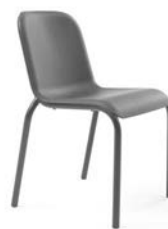
Slika 10. Interior Innovation Award 2014 – Best of Best. Proizvod: stolac Buzz; proizvođač: Arco BV; dizajn: Bertjan Pot / Arco BV