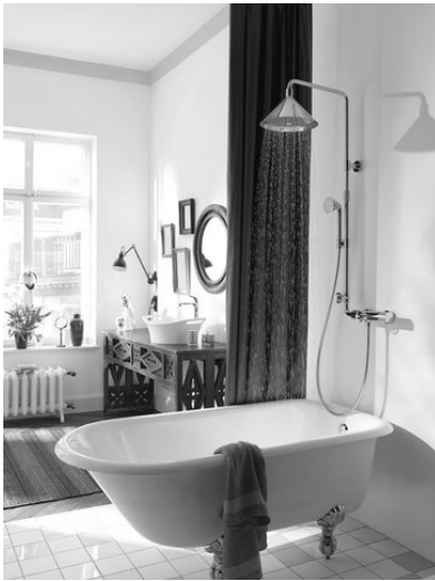
Slika 12. Interior Innovation Award 2014 – Best of Best. Proizvod: serija proizvoda za tuširanje Axor; proizvođač: Hansgrohe SE; dizajn: Front Design AB

U sklopu Interior Innovation Awarda – Selection nagrade dodijeljene su u kategorijama kupaonica i wellnessa; ureda i radnog prostora; gradbenih materijala; kuhinja i kuhinjskih aparata; rasvjete; namještaja; proizvoda za vanjsko uređenje te dekoracije zidova, podova i stropova. Neki od nagrađenih proizvoda prikazani su na slikama od 13. do 16.