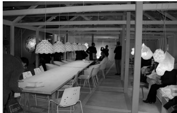
Slika 19. Dugački blagovaonički stol namijenjen druženju, raspravama i drugim zajedničkim aktivnostima