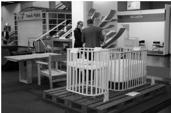
Slika 28. Proizvođač Noona izložio je program dječjih krevetića koji dimenzijama „rastu” s djetetom