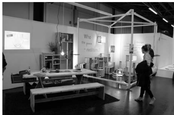
Slike 23 – 26. Atmosfera na [d3] Schoolsu

Iduće godine na bijenalnom će IMM Cologne/LivingKitchenu, u razdoblju od 19. do 25. siječnja 2015, nastupiti proizvođači i dizajneri kuhinjskog namještaja i opreme.