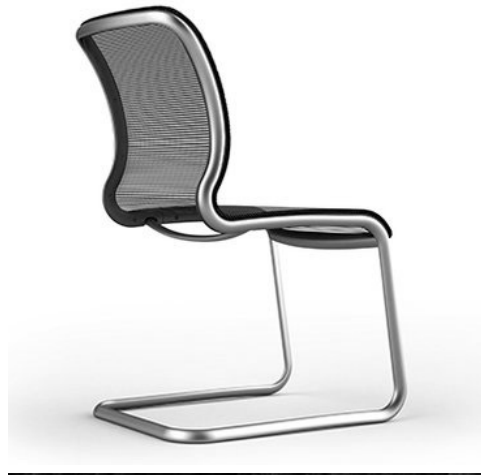
Slika 14. Interior Innovation Award 2014 – Selection. Proizvod: konferencijski stolac LOVA; proizvođač: Alfons Venjakob GmbH & Co. KG; dizajn: In-house design