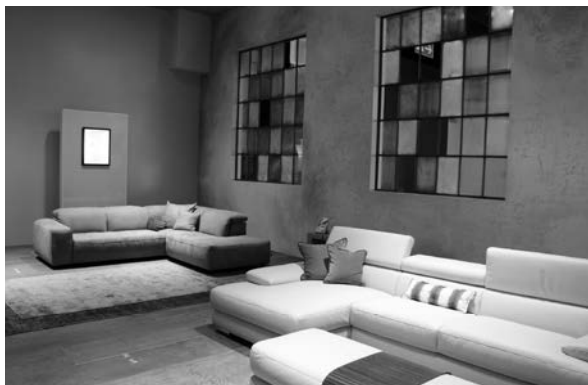
Slika 7. Igre bojama najbolje su se mogle zamijetiti na ojaštucenom namještaju; primjer pastelnih tonova ...

Od vrsta drva i boja prevladavaju prirodni uljani tonovi orahovine, hrastovine i jasenovine, uz detalje bijele boje i pastelnih tonova, poput pastelno plave, tirkizne, sive, ružičaste (sl. 7). Osim pastelnim tonovima, brojni su proizvođači svoje proizvode naglašavali akcentima jakih tonova, poput tirkizne i purpurne, crvene, narančaste... (sl. 8).