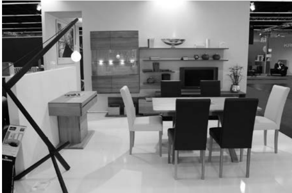
Slika 27. DIN Novoselec već tradicionalno izlaže suvremene garniture za opremanje blagovaonica i dnevnih boravaka, kao i proizvođači okupljeni u Drvnom klasteru sjeverozapadne Hrvatske

Ove godine naglasak je bio na dizajnu, što se moglo zaključiti i po odabranim izlošcima (sl. 27 – 31).