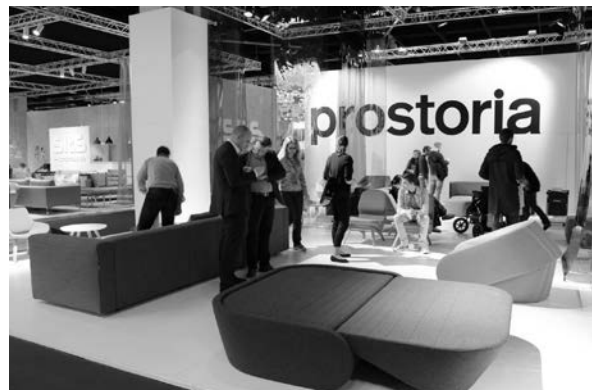
Slika 32. Izlagački prostor tvrtke Prostorija, bivše Kvadre

Kao i proteklih godina, tvrtka Kvadra izložila je svoje proizvode u drugom paviljonu. Bez obzira na to što je promijenila ime u Prostorija , bivša je Kvadra i ove godine dobitnik nekoliko nagrada (Interior Innovation Award 2014) za proizvode nastale u suradnji s hrvatskim dizajnerima (sl. 32 – 33). Čestitamo!