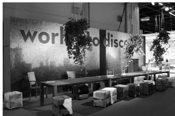
Slika 3. Priroda ulazi u domove u obliku biljaka, masivnog drva i životinjske kože

Ove godine naglasak je bio na predmetima koji stanove transformiraju u domove: u svakom kutku osjeća se toplina, taktilnost, ugođaj, odmor, prirodnost (sl. 3). Unutar LivingInteriorsa naglasak je bio na detaljima kupaonica, dekoraciji zidova, podova, tekstila i rasvjetе.