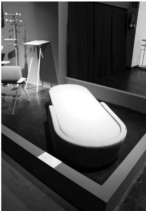
Slika 33. Nagrađeni preklopni naslonjač dizajnera Nevena i Sanje Kovačić dizajniran za tvrtku Prostorija

Četvrti put zaredom, samostalno kao i spomenuta Prostorija, izlagala je i hrvatska tvrtka Prima namještaj. Riječ je o tvrtki s dugogodišnjom tradicijom u proizvodnji, maloprodaji i veleprodaji kućnog namještaja koja se, ne bez razloga, ubraja među najveće hrvatske proizvođače. Ove godine Prima se predstavila novitetima za koje se nada da će ostvariti izvozni plasman na već utvrđena tržišta desetak europskih zemalja i time potvrditi svoju misiju – ostati pouzdan strateški partner koji kontinuiranim praćenjem tržišnih kretanja, unapređenjem proizvodnje te praćenjem i oblikovanjem trendova ispunjava zahtjeve svojih klijenata i kupaca.