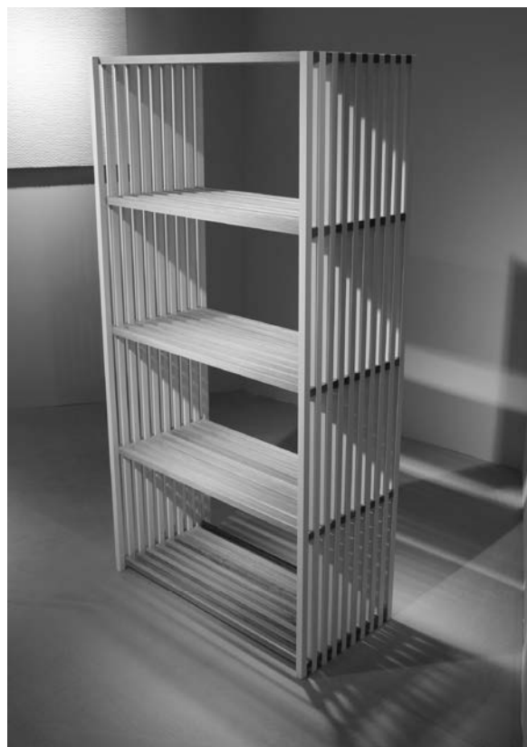
Slika 9. Interior Innovation Award 2014 – Best of Best. Proizvod: sustav polica REBAR; proizvođač: joval GmbH; dizajn: Jonas Schroeder

And the Award goes to... – tako je počinjalo ovogodišnje proglašenje svake od nagrada dodijeljenih proizvodima u kategoriji Best of best , a dobilo ju je 15 proizvoda (sl. 9 – 12).