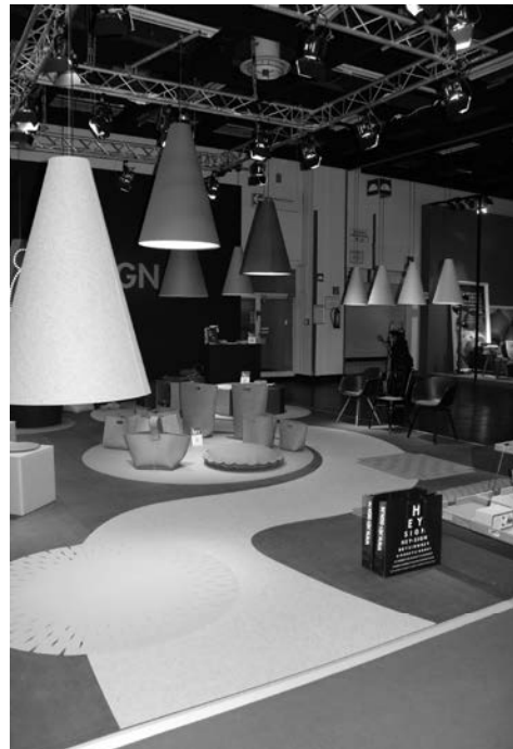
Slika 16. Interior Innovation Award 2014 – Selection. Proizvod: HEY – Light; proizvođač: HEY-SIGN GmbH; dizajn: In-house design