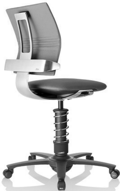
Slika 13. Interior Innovation Award 2014 – Selection. Proizvod: aktivna uredska stolica 3DEE; proizvođač: aeris-Impulsmoebel GmbH & Co. KG; dizajn: aeris-Impulsmoebel GmbH & Co. KG

U sklopu Interior Innovation Awarda – Selection nagrade dodijeljene su u kategorijama kupaonica i wellnessa; ureda i radnog prostora; gradbenih materijala; kuhinja i kuhinjskih aparata; rasvjete; namještaja; proizvoda za vanjsko uređenje te dekoracije zidova, podova i stropova. Neki od nagrađenih proizvoda prikazani su na slikama od 13. do 16.