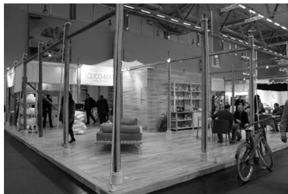
Slika 6. Cjeloviti pristup uređenju štanda i izloženim ekološkim proizvodima za spavanje; grčka tvrtka COCO-MAT

U kontekstu zdravlja i spavanja, ove su godine „spavači“ postigli rekord u popunjenosti izlagačkih površina (sl. 6). „Spavači“, kao i proizvođači ojaštucenog namještaja, pomiču horizonte u smislu multifunkcionalnosti i udobnosti. Za razliku od nekadašnjih „idealnih i zdravih položaja pri ležanju i sjedenju“, danas se nude koncepti udobnosti koji su neizostavno ugrađeni u sve proizvode za ležanje i sjedenje. Korisnici ne doživljavaju krevet ili naslonjač kao proizvod za spavanje ili popodnevno drijemanje nego kao cjeloviti koncept zdravoga i relaksirajućeg sustava.