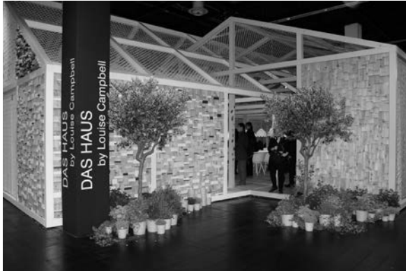
Slika 17. Das Haus – Interiors on Stage 2014

Das Haus – Interiors on Stage 2014 (sl. 17) dizajnerice Louise Campbell ove je godine izazvala velik broj komentara. Pod nazivom 0-100 (Made to measure) (u prijevodu: napravljeno po mjeri, nap. a.) autorica je evocirala odnose muškarca i žene, njihove potrebe, sličnosti i različitosti, ustaljene navike i obrasce.