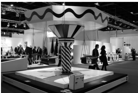
Slika 1. Detalj sajma IMM Cologne/LivingInteriors

Ove je godine na sajmu prezentirana multiizražajnost i različitost u razinama predstavljanja i u kvaliteti proizvoda. Prema posljednjim podacima za novinare (press release), izjava direktora IMM-a nadasve je optimistična za 2014. glede trgovine namještajem. Pozitivni učinci sajma itekako će utjecati na buduću potražnju, što se već moglo vidjeti po razini posjećenosti na većini izlagačkih štandova (sl. 2).