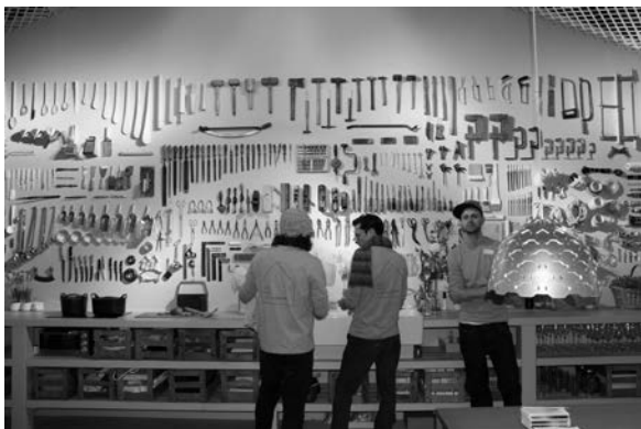
Slika 18. Kuhinja i alatnica jedan su zid na kojemu se miješaju ručni pribor, alati i posuđe. Sve je otvoreno i na dohvata ruke

Slike od 17. do 20. predaju neke detalje interijera ovogodišnjega Das Hausa .