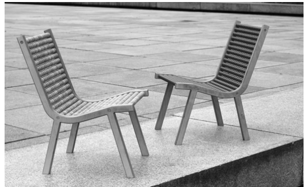
Slika 15. Stolac 0432; proizvođač: Atelier Fessler; dizajn: Frederic Fessler